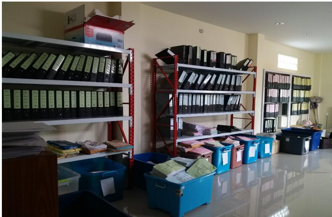
ภาพที่ 6 แสดงชั้นเก็บเอกสารต่าง ๆ ภายในสำนักงาน