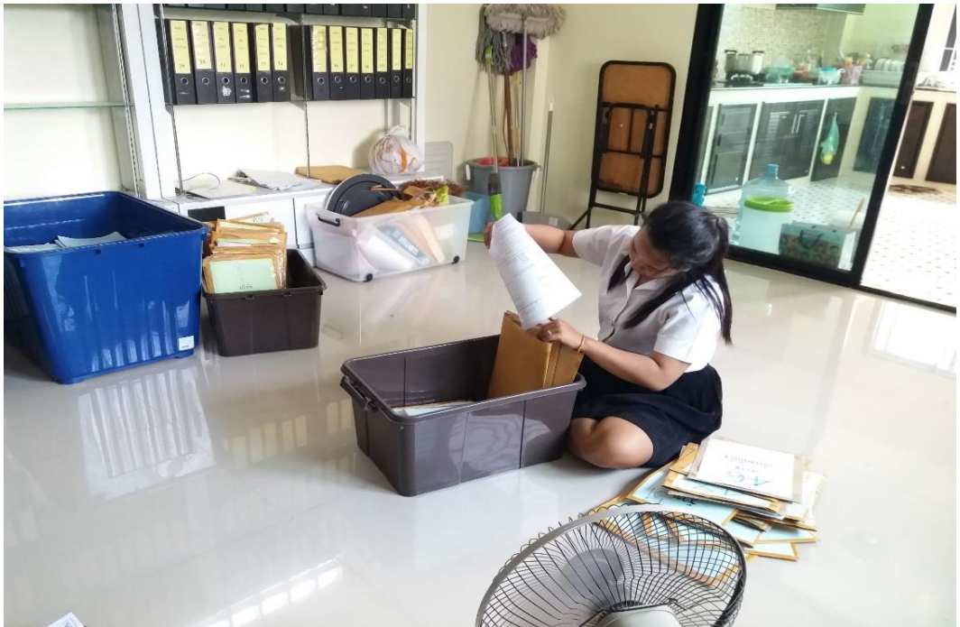
ภาพที่ 7 แสดงการเก็บเอกสารต่าง ๆ ภายในสำนักงาน