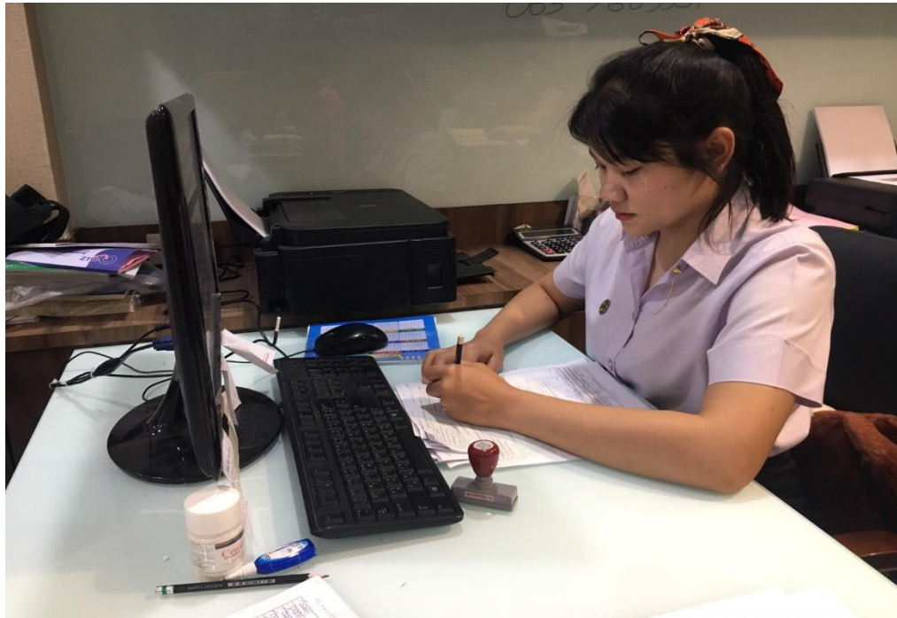
ภาพที่ 11 แสดงการทำงานบันทึกบัญชีโปรแกรมสำเร็จรูปทางบัญชี EASY-ACC