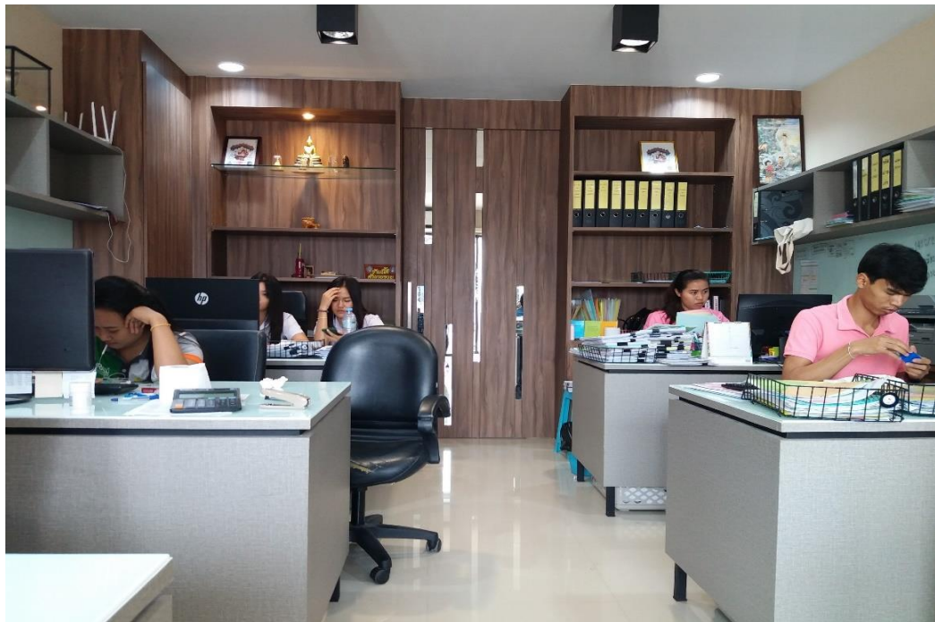
ภาพที่ 2 แสดงบรรยากาศภายในสำนักงาน