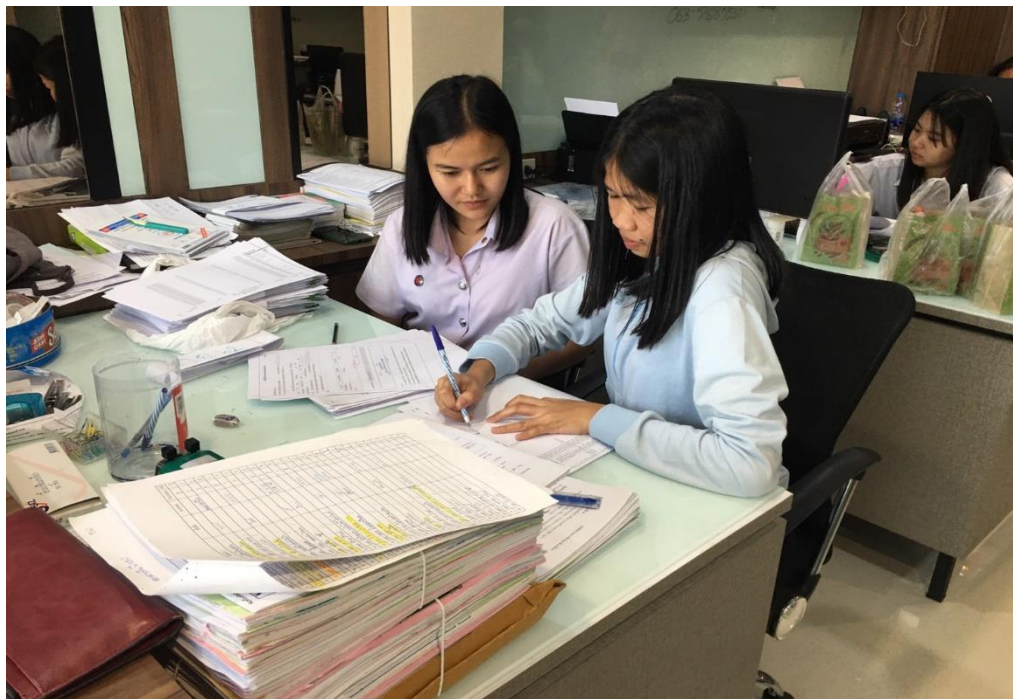
ภาพที่ 12 แสดงการสัมภาษณ์น้องผู้ใช้โปรแกรมสำเร็จรูปทางบัญชี EASY