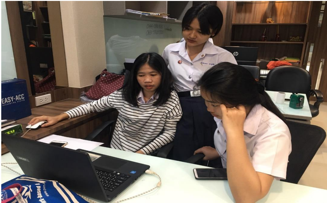
ภาพที่ 9 แสดงการสอนน้องใช้คู่มือโปรแกรมสำเร็จรูปทางบัญชี EASY-ACC