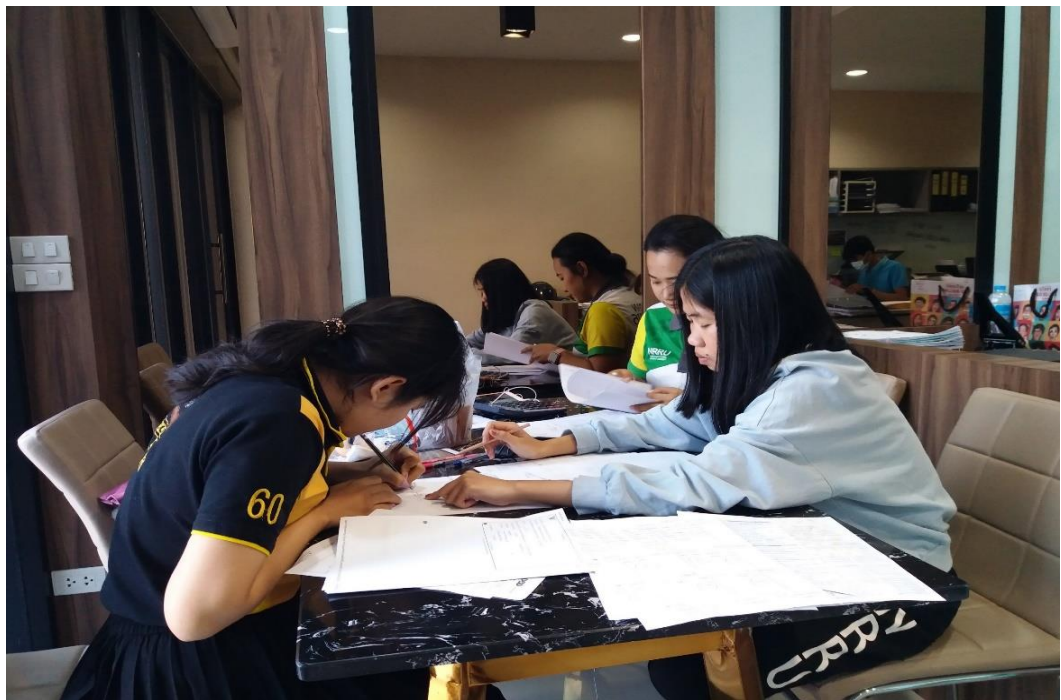
ภาพที่ 8 แสดงการทำงานภายในสำนักงาน