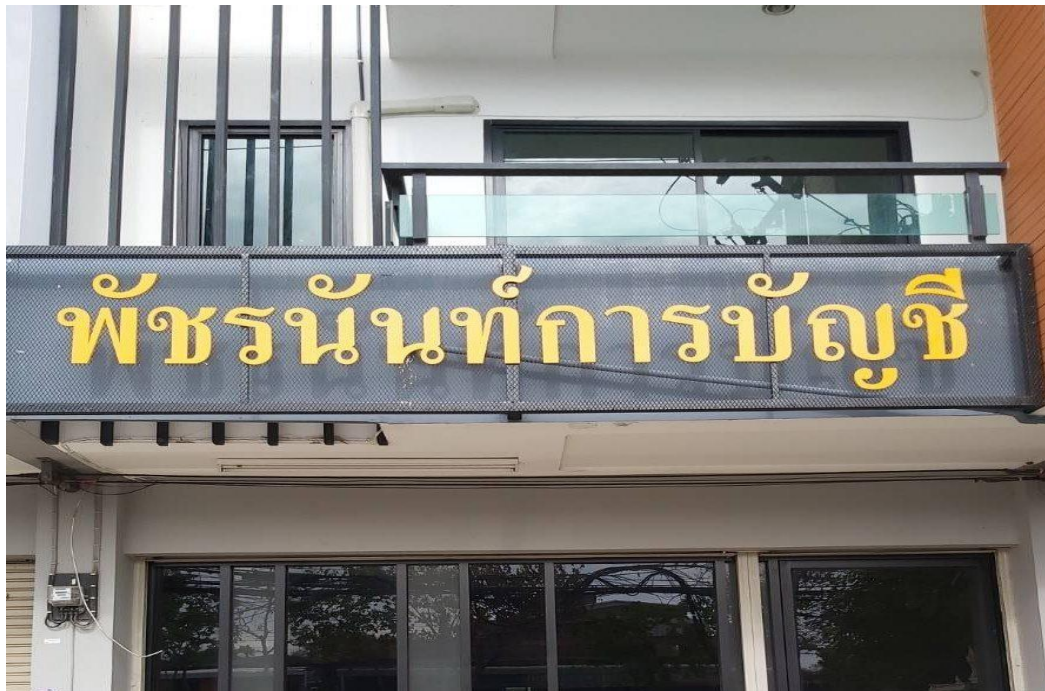
ภาพที่ 1 แสดงป้ายชื่อสำนักงาน