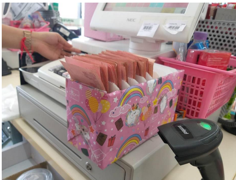
รูปที่ 3.2 ก่อนนำเข้าเครื่อง

ในปัจจุบันคู่แข่งชั้นทางการตลาดเพิ่มสูงขึ้น ในกลุ่มธุรกิจประเภทเดียวกัน จึงทำให้ต้องหากกลยุทธ์และวิธีการรับมือกับคู่แข่งชั้นทางการตลาด เพื่อการเติบโตของธุรกิจ การอยู่รอด และความมั่นคงในยุคที่มีการแข่งขันสูง ดังนั้นทางผู้จัดทำจึงได้ระดมความคิดวางแผน ก่อให้เกิดเป็นโครงการลดขั้นตอนการนับแบงค์ย่อย (การฝาก - ถอน Banking Agent) ขึ้น เพื่อเพิ่มความสะดวกให้กับพนักงานในการนับแบงค์ ดังรูปที่ 3.2 ถึง 3.4