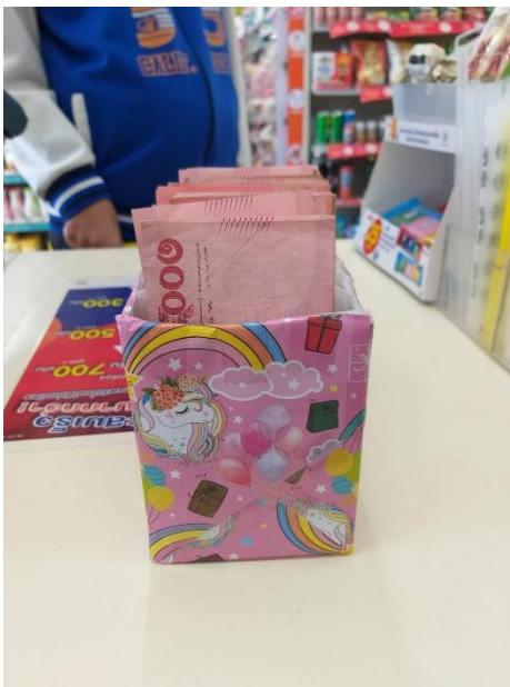
รูปที่ 3.3 ขณะนับเงิน