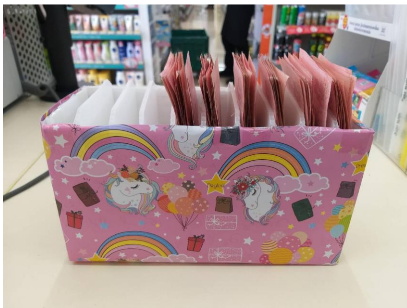
รูปที่ 3.4 ทวนเงินต่อหน้าลูกค้า