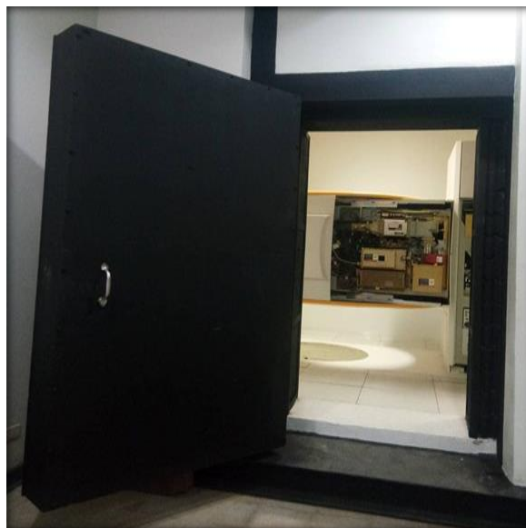
ภาพที่ ก.5 วัสดุกำบังรังสีและห้องฉายรังสี