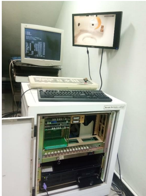
ภาพที่ ก.4 ระบบควบคุมและวิเคราะห์การทำงาน