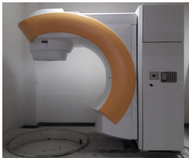
ภาพที่ ก.3 เครื่องเร่งอิเล็กตรอนทางการแพทย์ LINAC