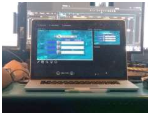
รูปที่ 3.1 การจัดทำหุ้่น

1.2 จัดสคริปต์สำหรับพิธีกรและเจ้าหน้าที่ควบคุม