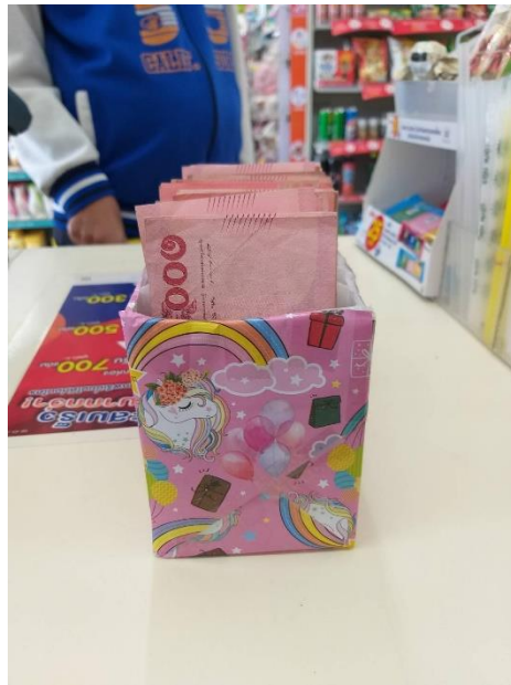
รูปที่ 3.3 ขณะนับเงิน