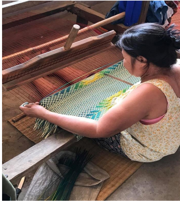
ภาพที่ 1.5 การทอเสื่อกก ปลายพื้นบ้าน