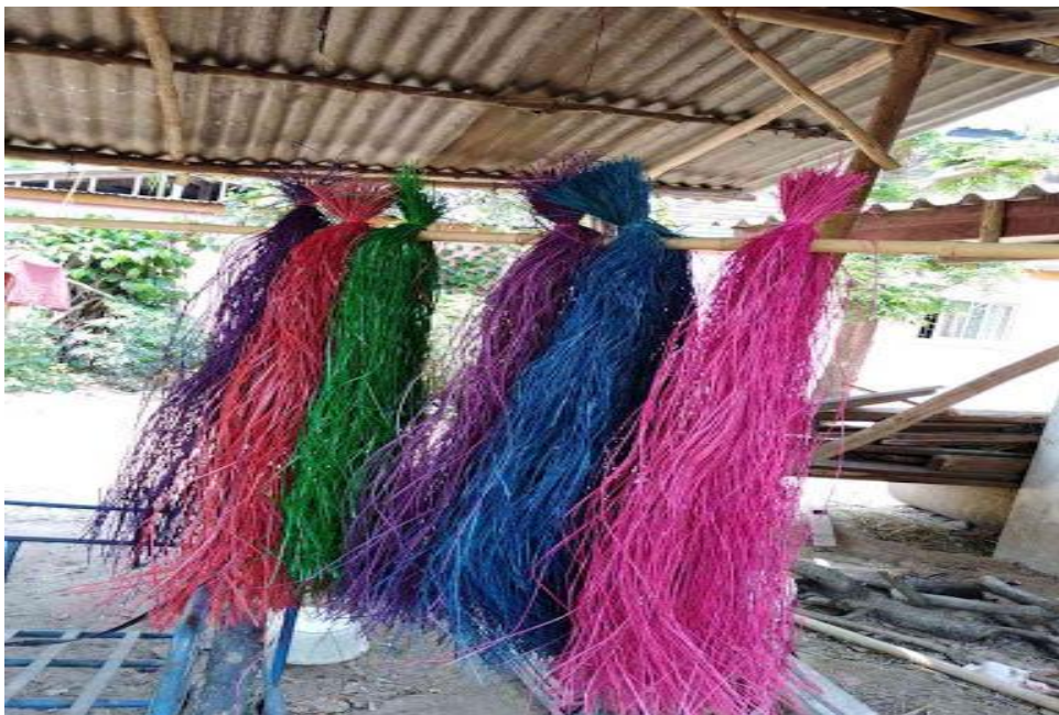
ภาพที่ 1.4 การย้อมสีกก