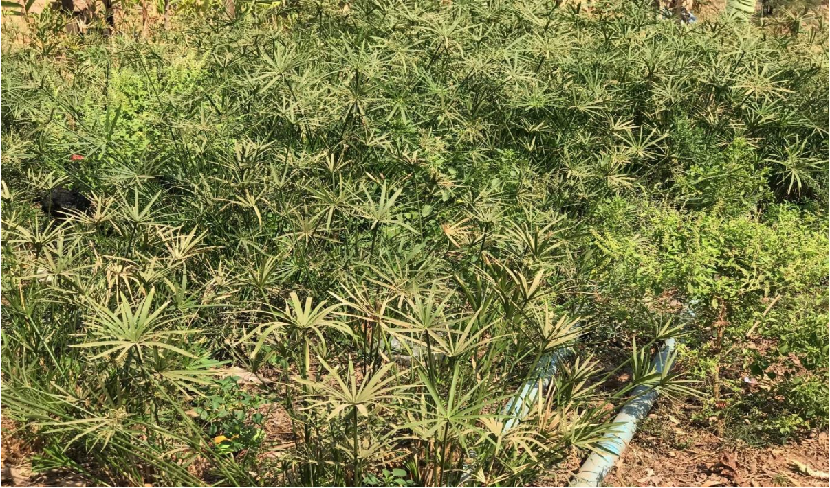
ภาพที่ 1.3 ต้นไผ่หรือกก