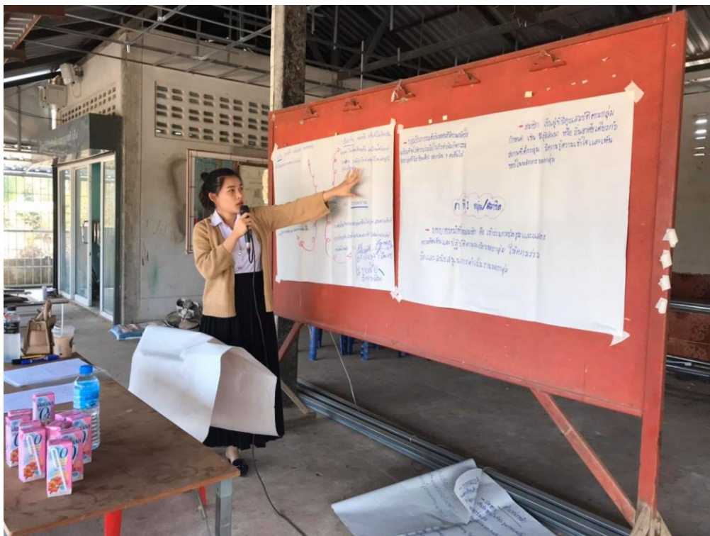
ภาพที่ 1.1 อบรมให้ความรู้เกี่ยวกับการจัดตั้งกลุ่ม