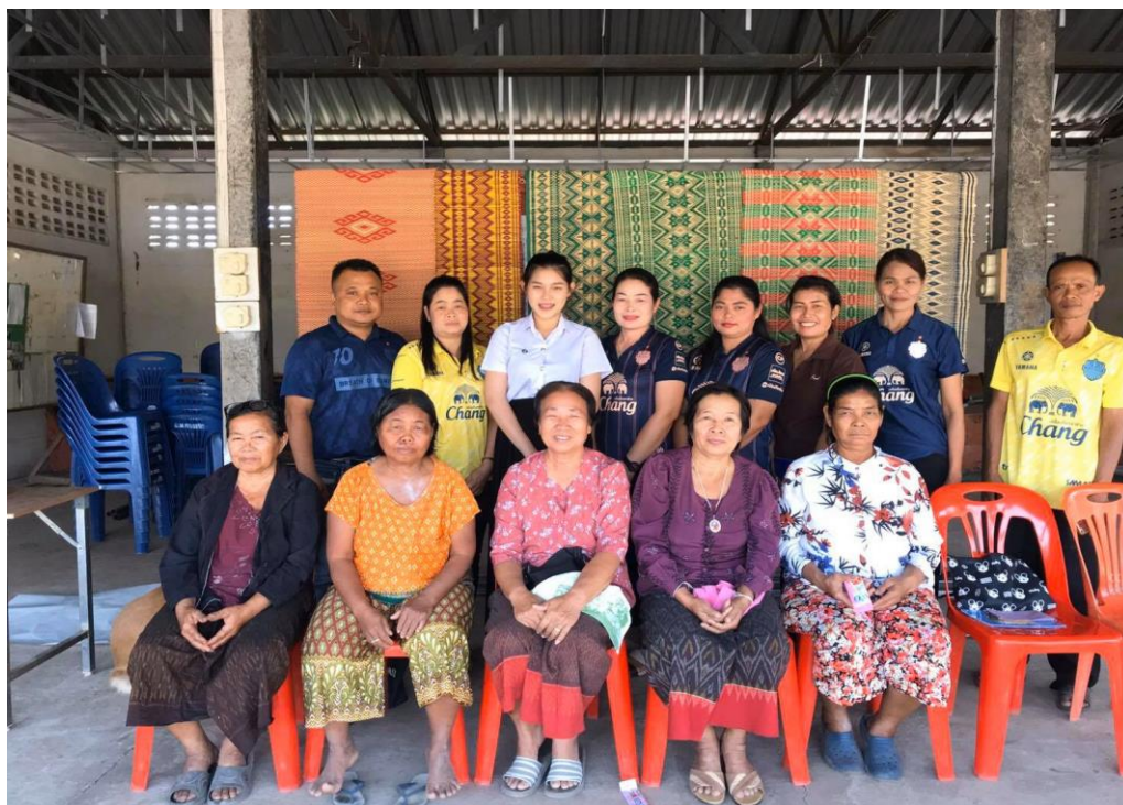
ภาพที่ 1.2 สมาชิกกลุ่มทอเสื่อ