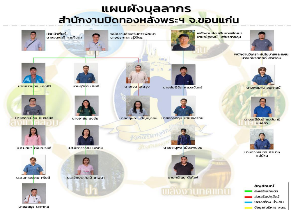
รูปภาพที่ 2 โครงสร้างองค์กรในพื้นที่ขอนแก่น