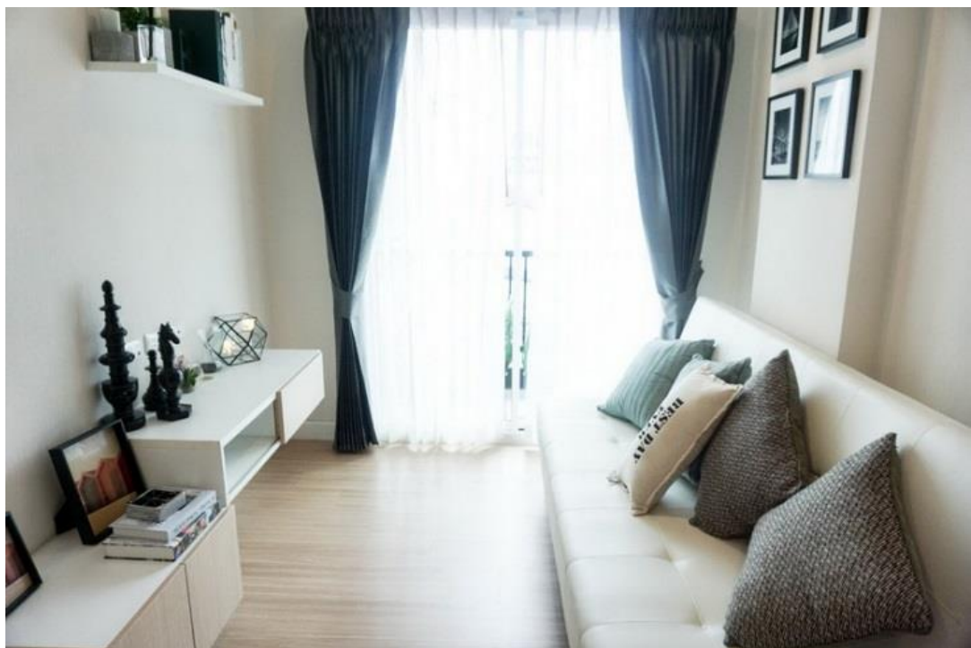
ตัวอย่างห้องชุด บริเวณห้องนั่งเล่น