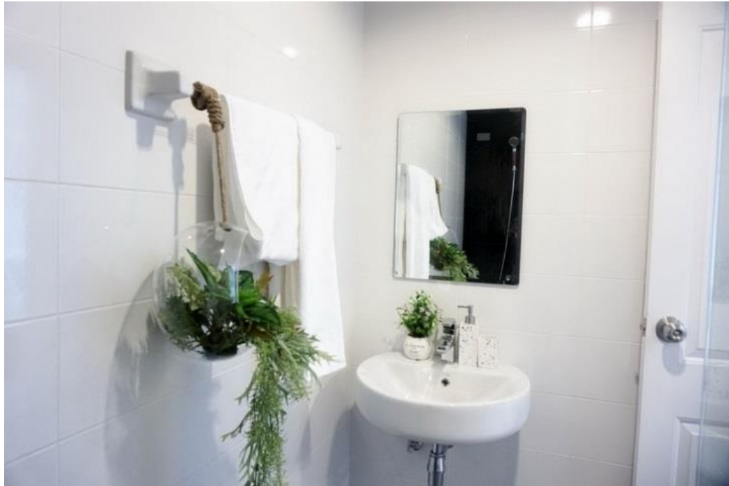
ตัวอย่างห้องชุด บริเวณห้องน้ำ