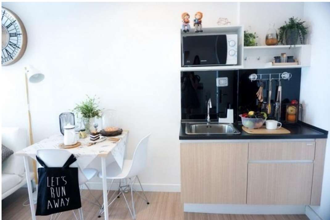
ตัวอย่างห้องชุด บริเวณห้องครัว