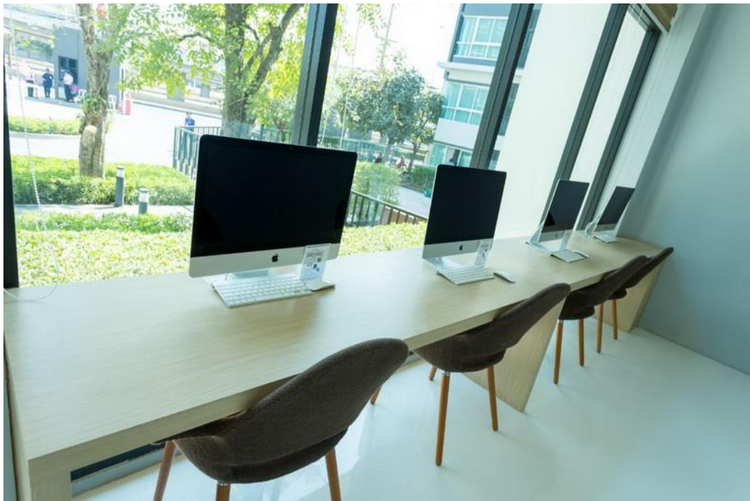
มีคอมพิวเตอร์ส่วนกลางบริการสำหรับลูกบ้าน