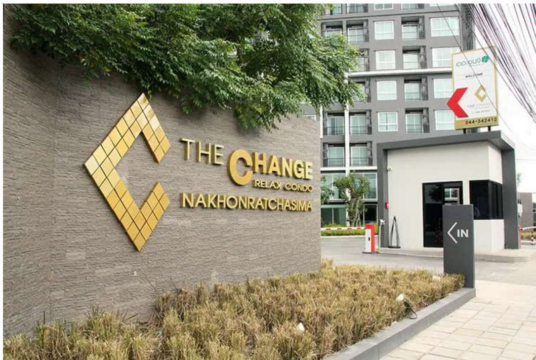
บริเวณทางเข้าของคอนโดมิเนียมอยู่ติดกับถนนเส้นมิตรภาพ สะดวกแก่การเดินทาง