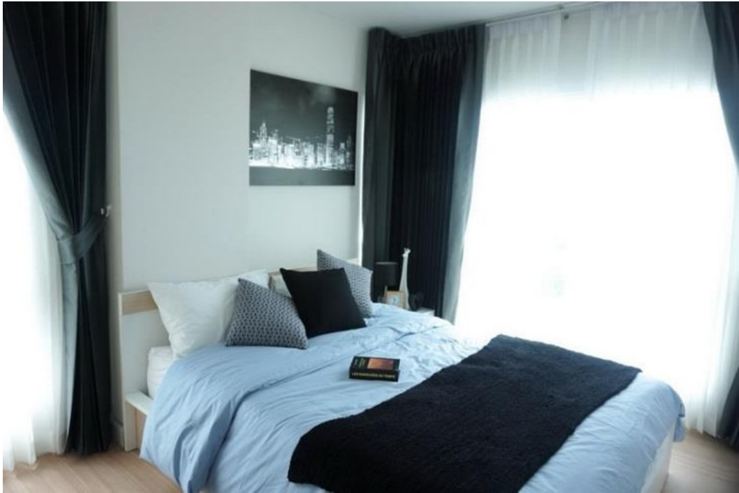
ตัวอย่างห้องชุด บริเวณห้องนอน