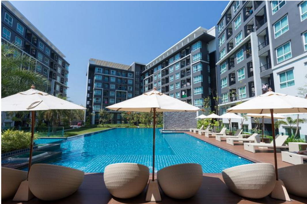
สระน้ำพื้นที่ส่วนกลางมีสไตล์ที่หรูหรา ให้ความรู้สึกผ่อนคลายเหมือนรีสอร์ท