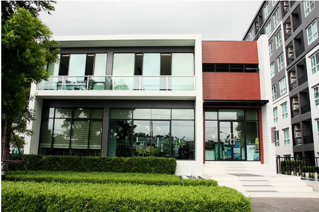
บริเวณด้านหน้าสำนักงานนิติบุคคล