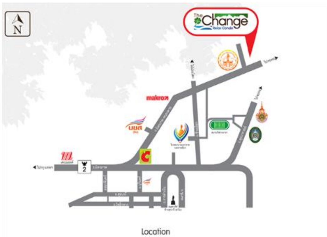
แผนที่คอนโดมิเนียม โครงการ The Change Relax Condo