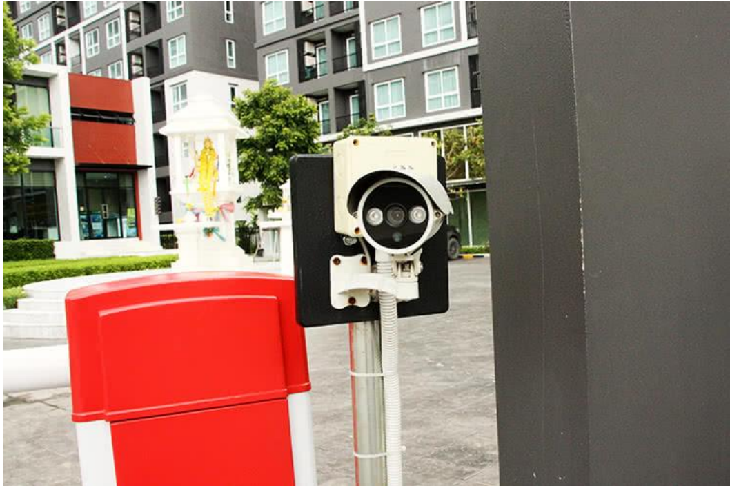
มีการติดตั้งกล้องวงจรปิดรอบโครงการ