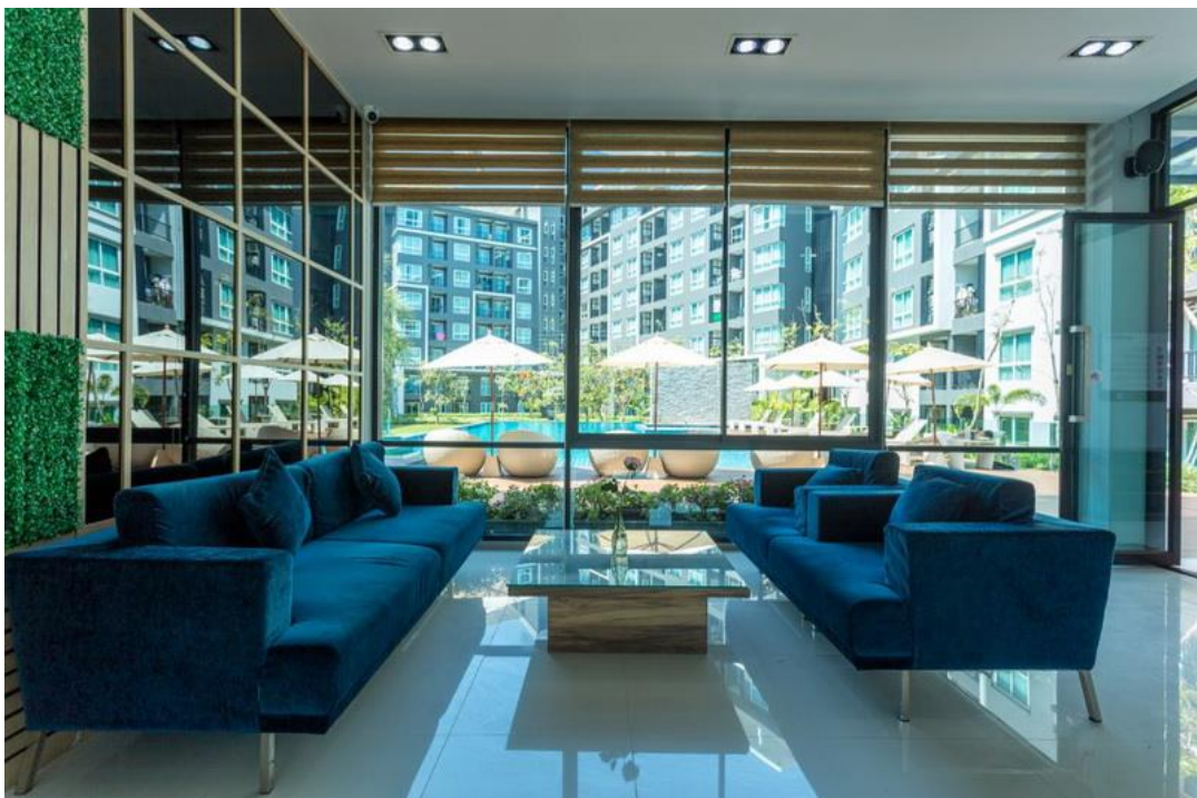
ห้องโถงส่วนกลางสะอาดและเป็นสบาย