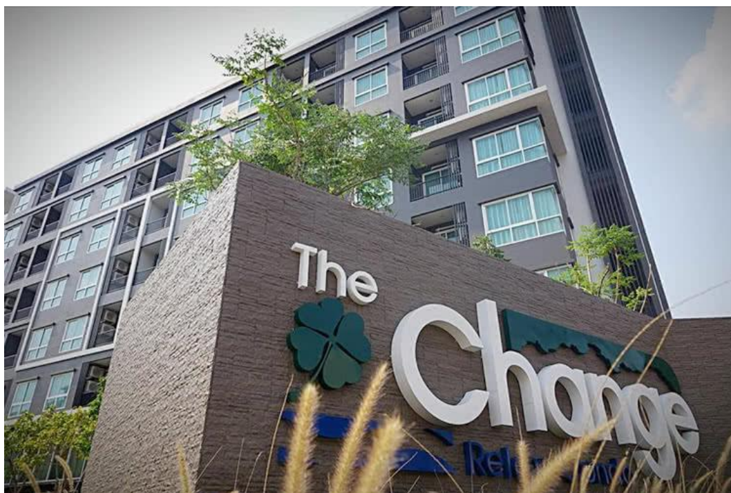
ด้านหน้าของคอนโดมิเนียมมีสไตล์เรียบหรู