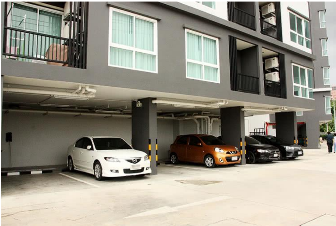
บริเวณพื้นที่จอดรถ