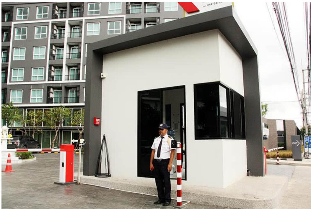
มีระบบรักษาความปลอดภัยอย่างเคร่งครัด