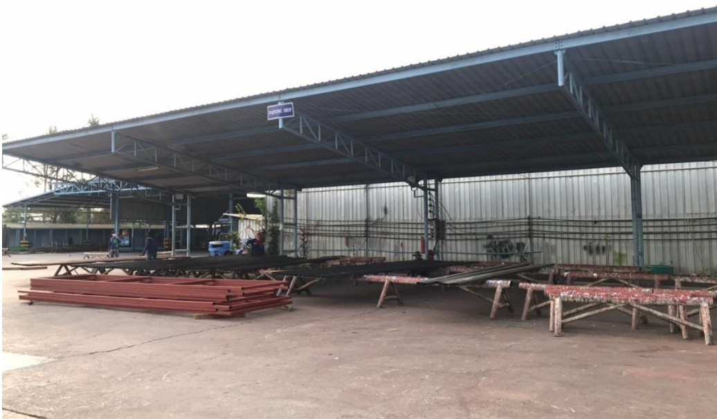
ภาพที่ ก.1 สภาพแวดล้อมในโรงงาน