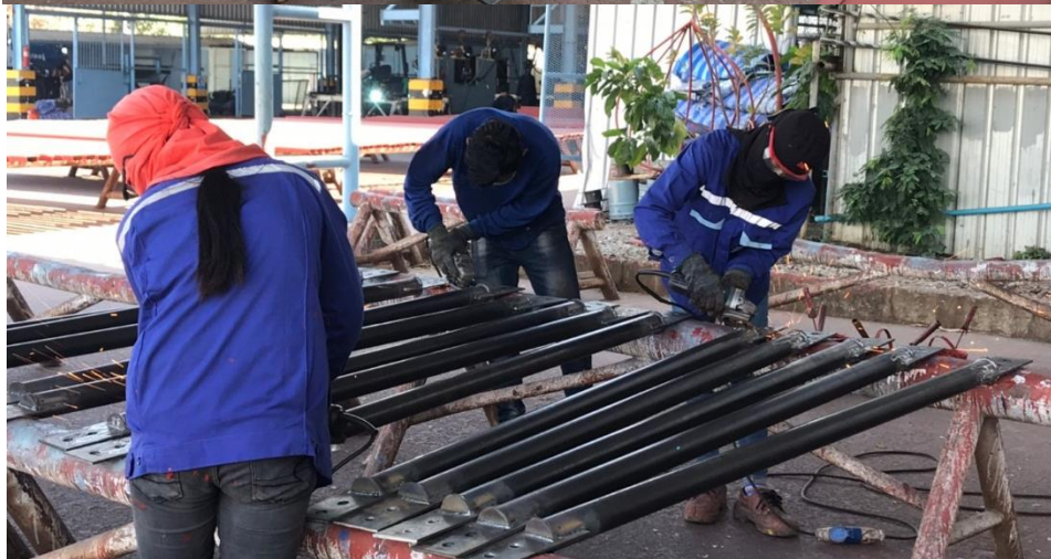
ภาพที่ ก.3 พนักงานสวมอุปกรณ์ป้องกัน (ถุงมือ, แวนตา) ขณะปฏิบัติงาน