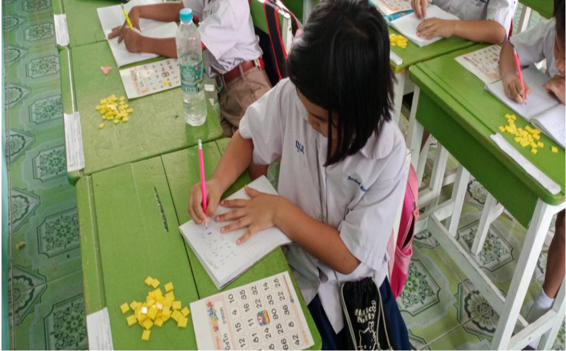
ภาพการทำกิจกรรม