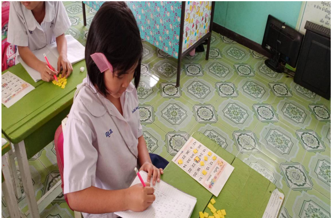
ภาพการทำกิจกรรม