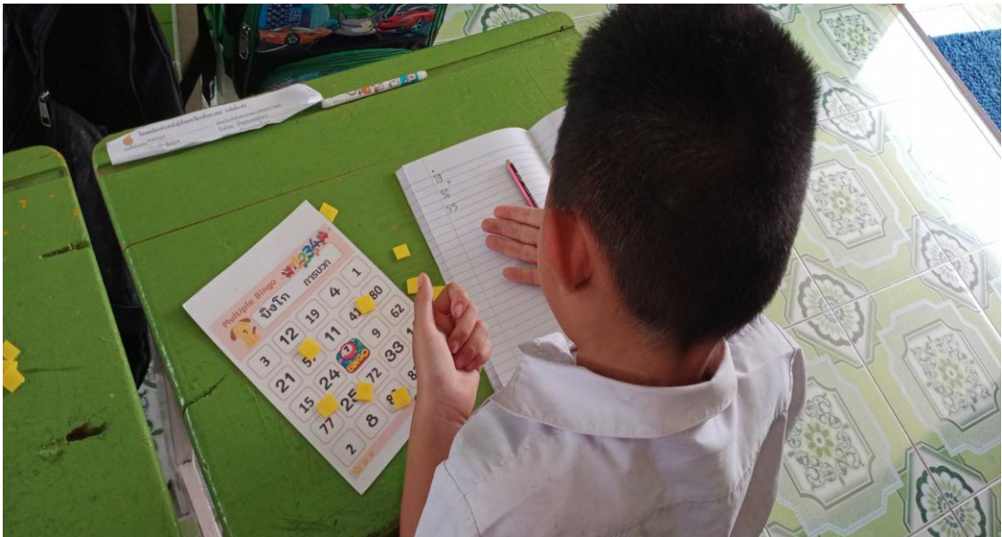
ภาพการทำกิจกรรม