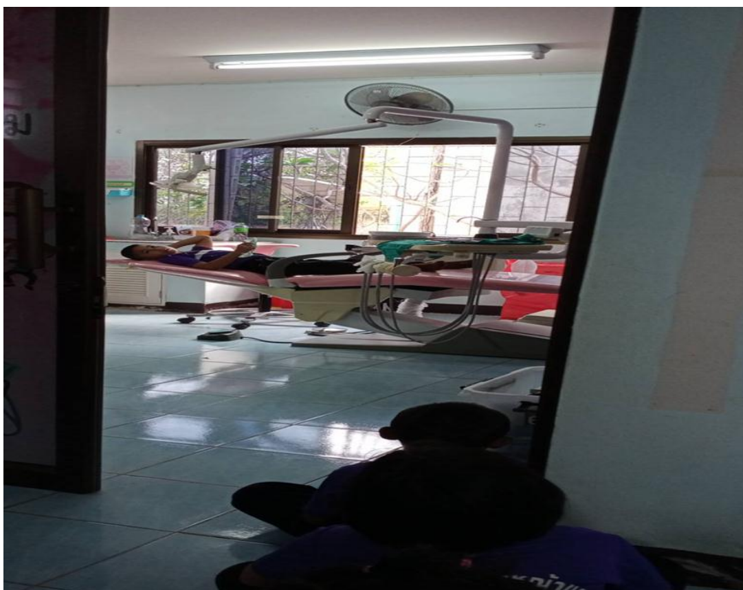
ภาพ 1-4 พานักเรียนชั้นป.1 ไปตรวจฟัน