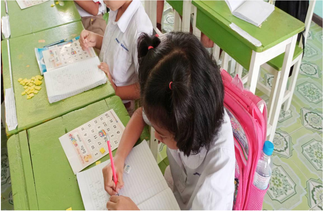
ภาพการทำกิจกรรม