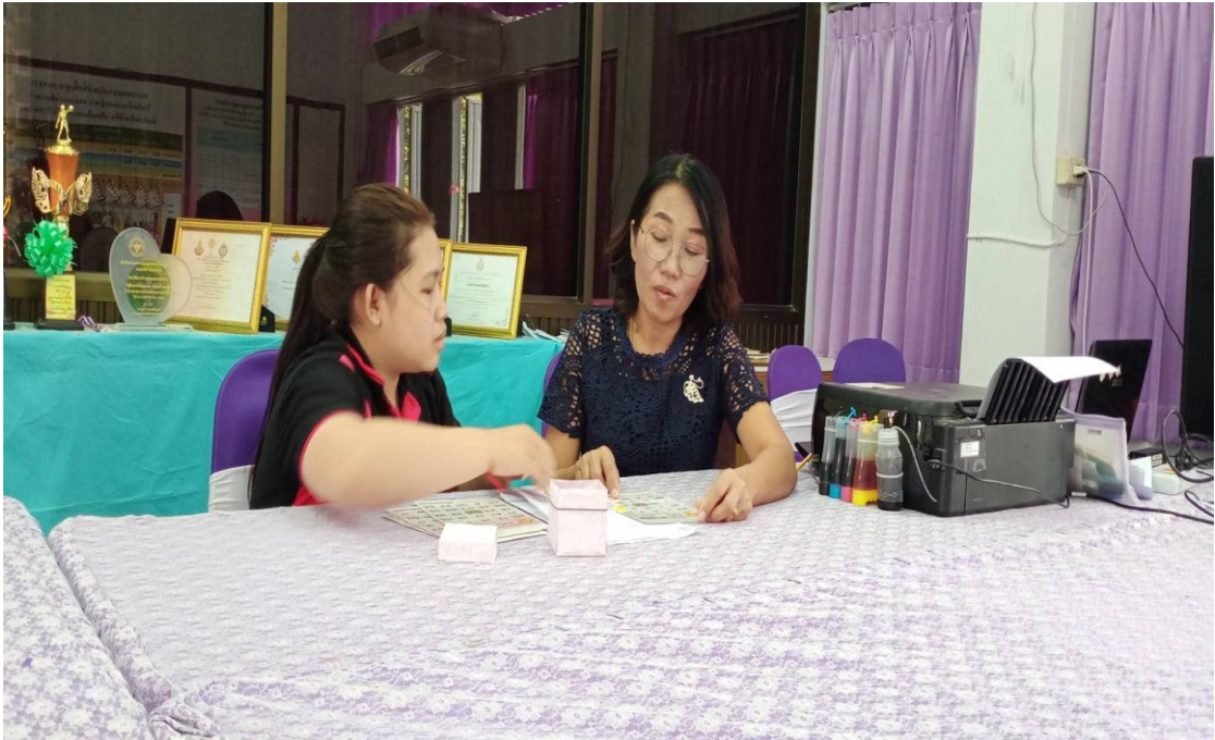
ภาพการพูดคุยกับครูที่ปรึกษา