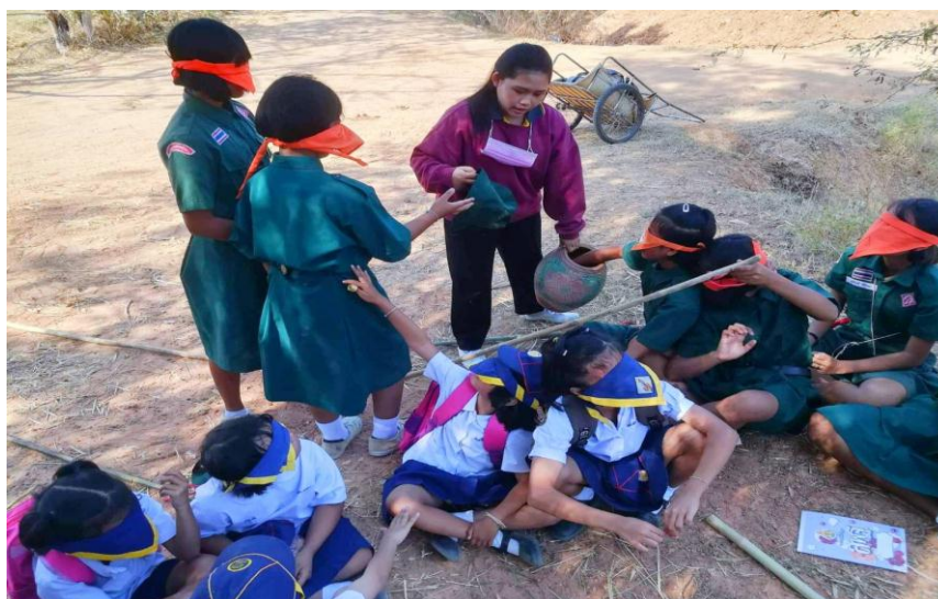
ภาพ 1-2 เข้าร่วมกิจกรรมลูกเสือเนตรนารี