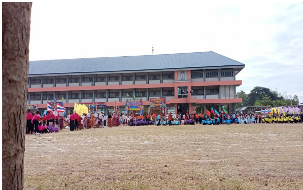
ภาพ 1-5 พานักเรียนไปเดินขบวนพาเหรดกีฬาประจำอำเภอ