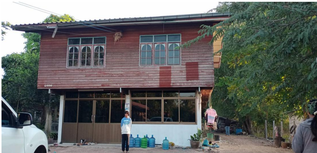
ภาพ 1-3 ออกเยี่ยมบ้านนักเรียนชั้น ป.6