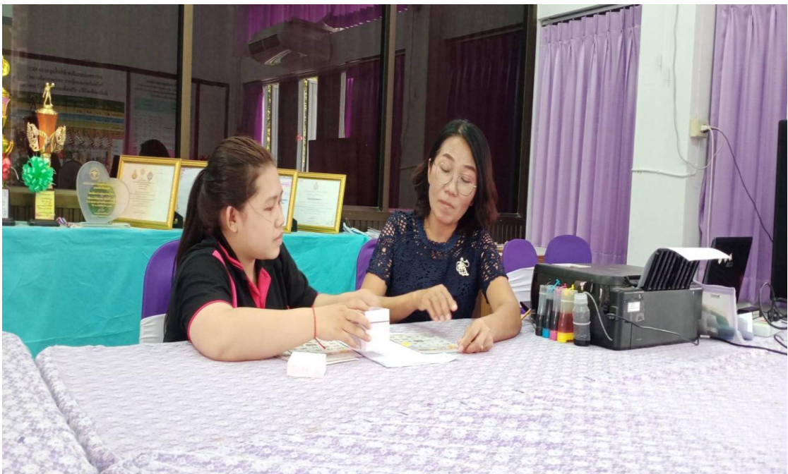
ภาพการพูดคุยกับครูที่ปรึกษา