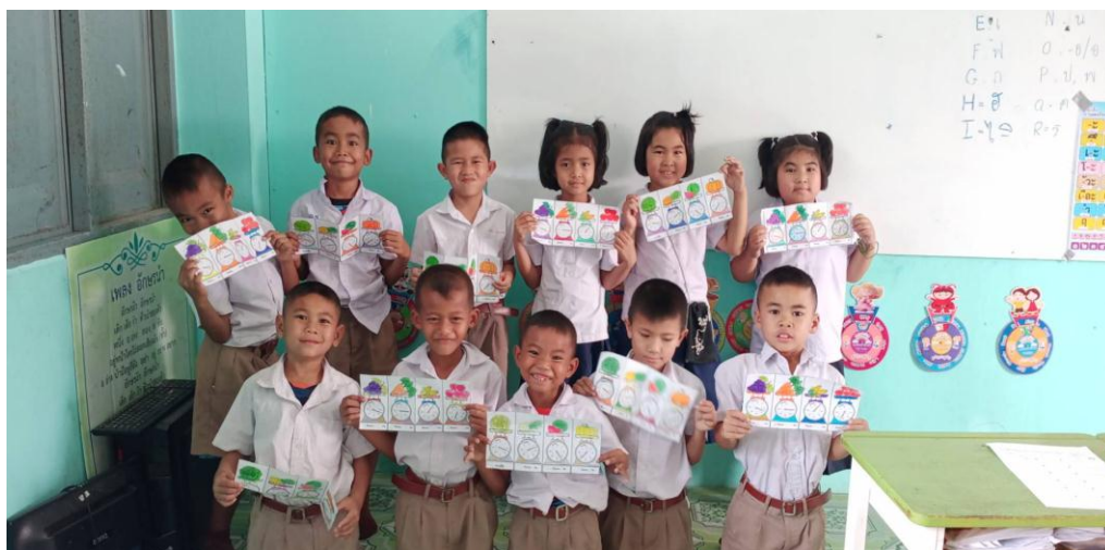
ภาพ 1-1 สอนประจำชั้นประถมศึกษาปีที่ 1