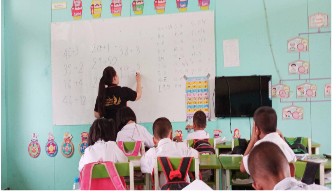
ภาพการทำแบบทดสอบก่อนเรียน