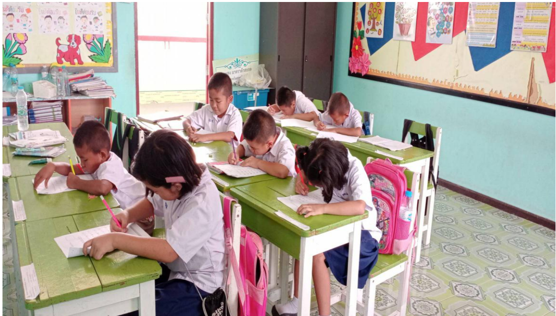
ภาพการทำแบบทดสอบก่อนเรียน