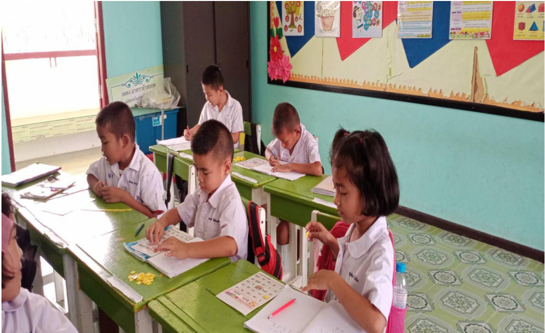
ภาพการทำกิจกรรม