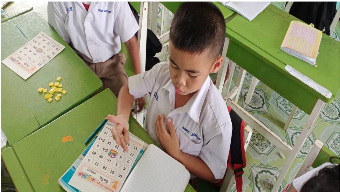
ภาพการทำกิจกรรม