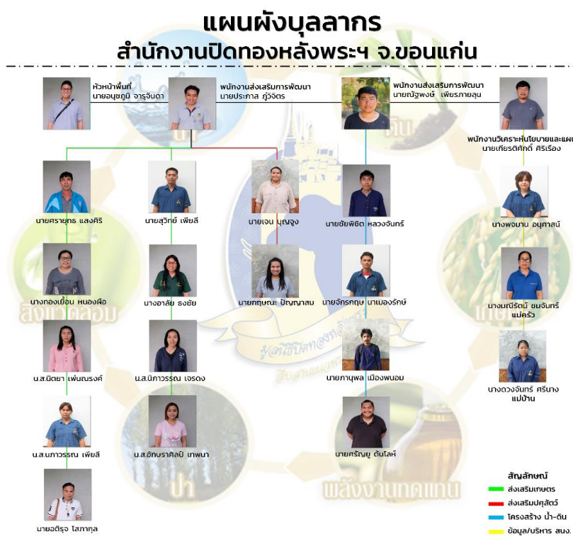
รูปภาพที่ 2 โครงสร้างองค์กรในพื้นที่ขอนแก่น