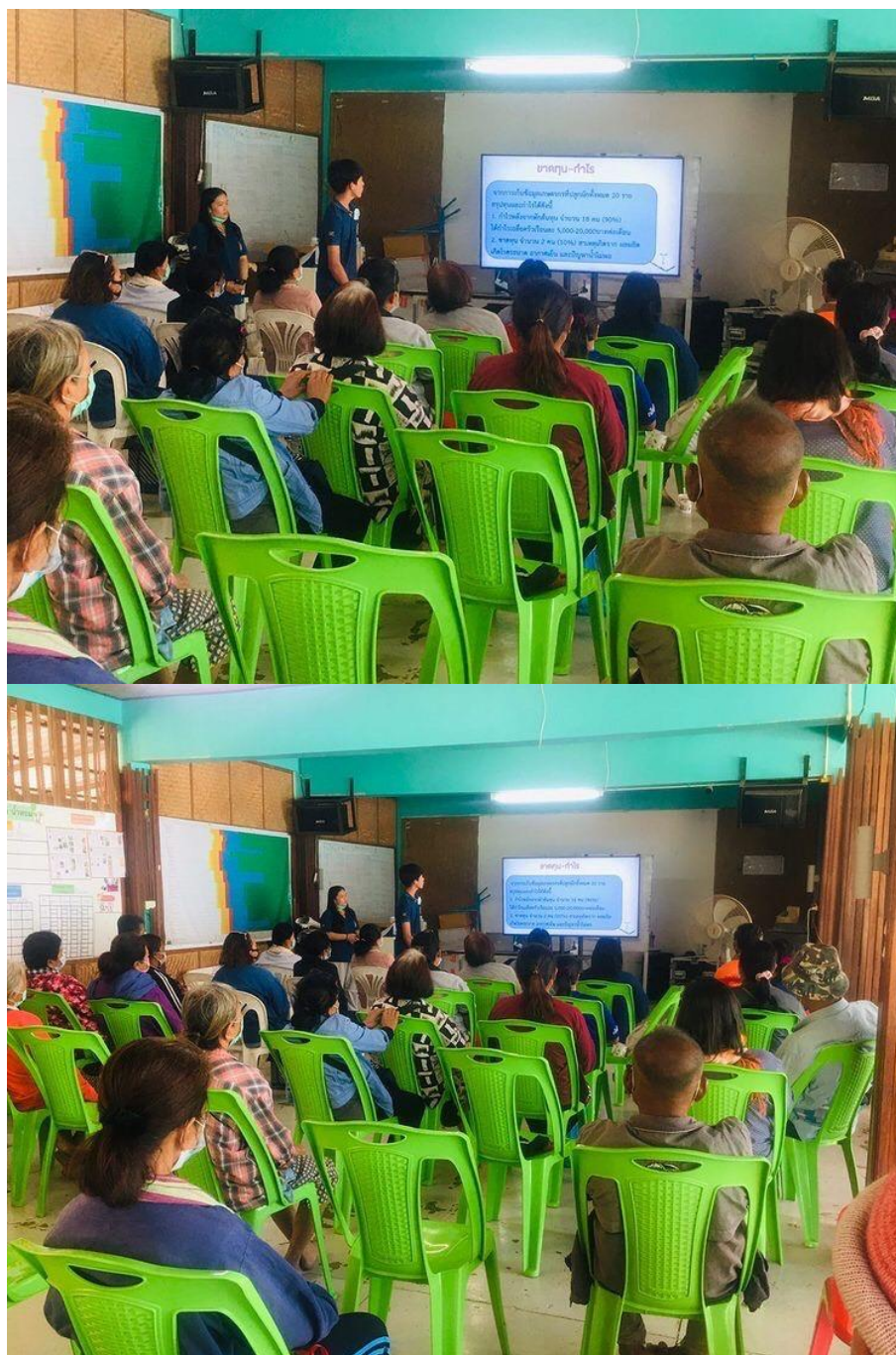
รูปภาพ การจัดกิจกรรม วันที่ 12 กุมภาพันธ์ 2564