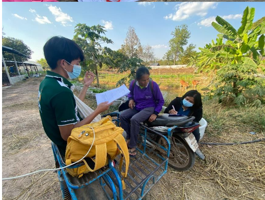
รูปภาพ การลงเก็บแบบสัมภาษณ์เกษตรกรกลุ่มตัวอย่าง