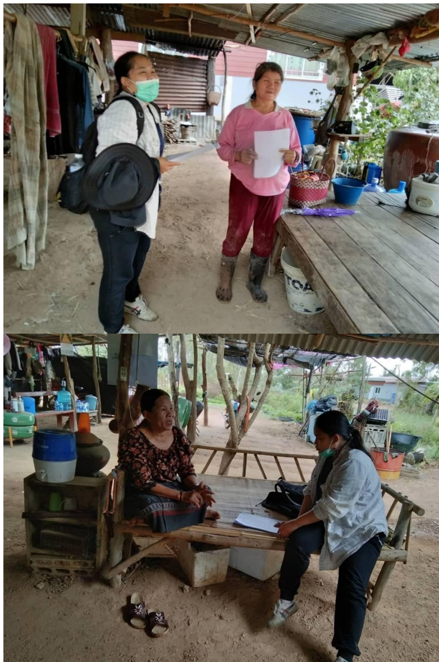
รูปภาพ การลงเก็บแบบสัมภาษณ์เกษตรกรกลุ่มตัวอย่าง