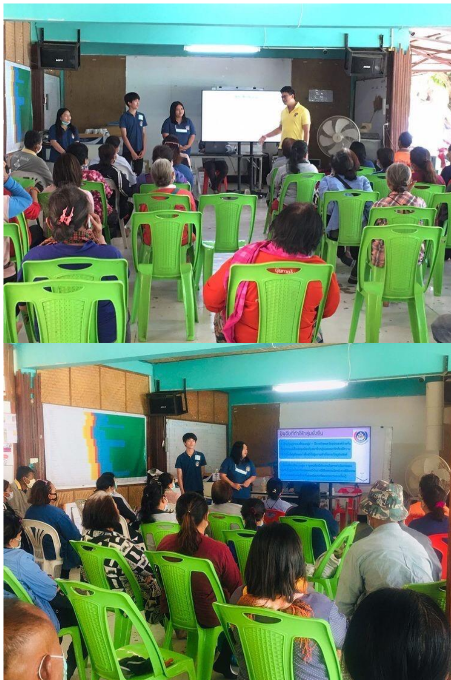
รูปภาพ การจัดกิจกรรม วันที่ 12 กุมภาพันธ์ 2564