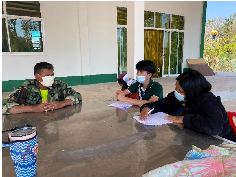
รูปภาพ การลงเก็บแบบสัมภาษณ์เกษตรกรกลุ่มตัวอย่าง