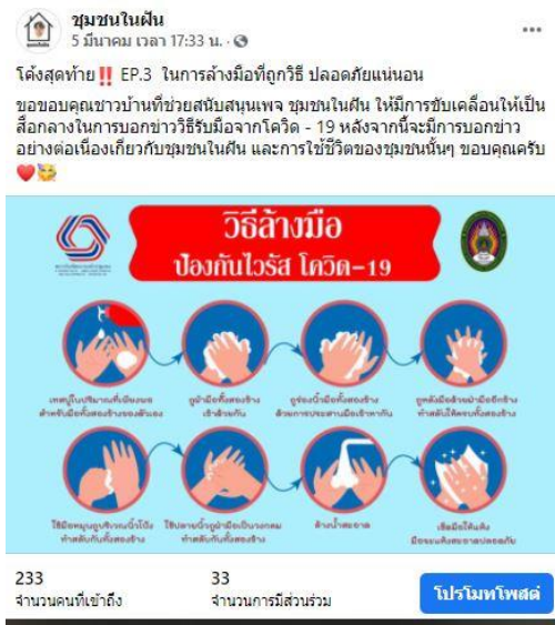
ภาพที่ 4 ภาพการออกแบบการล้างมือไปติดในชุมชน