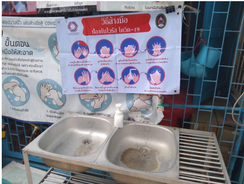
ภาพที่ 6 การดำเนินการติดไลน์