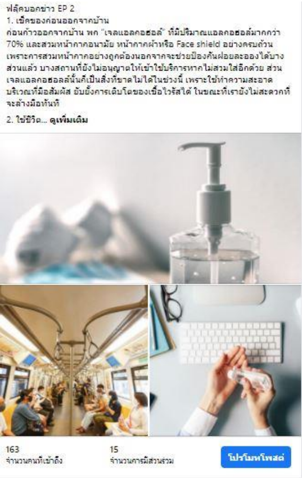
ภาพที่ 3 ภาพการให้ความรู้เกี่ยวกับการล้างมือและการจัดการตนเอง