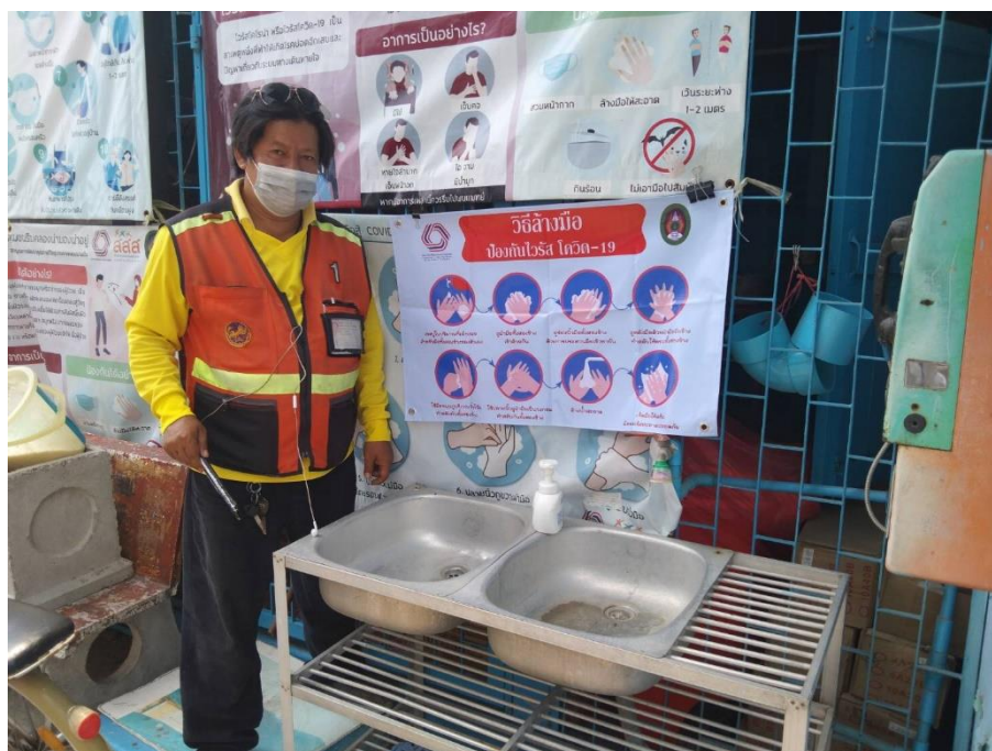
ภาพที่ 5 การดำเนินการติดตั้ง