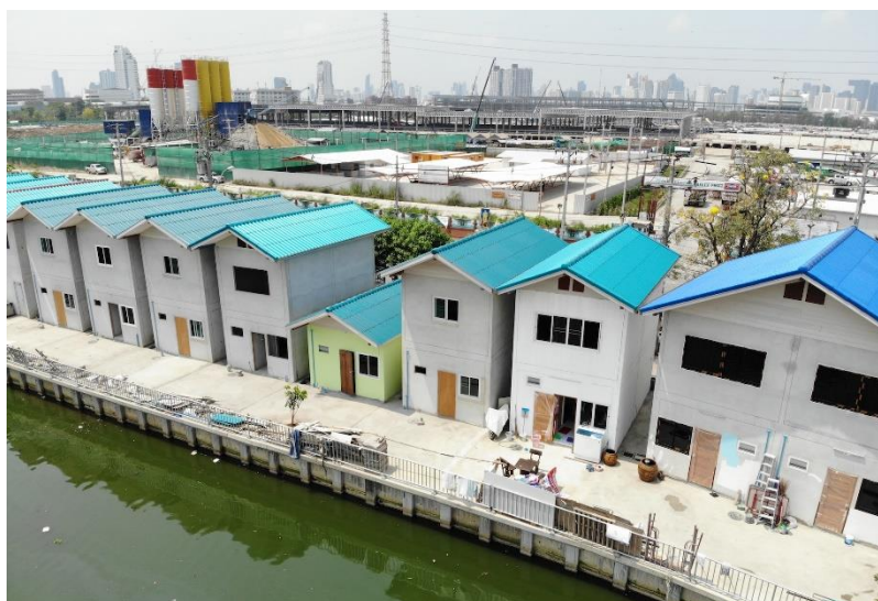
ภาพที่ 1 การจัดที่อยู่อาศัยตามโครงการของภาครัฐ