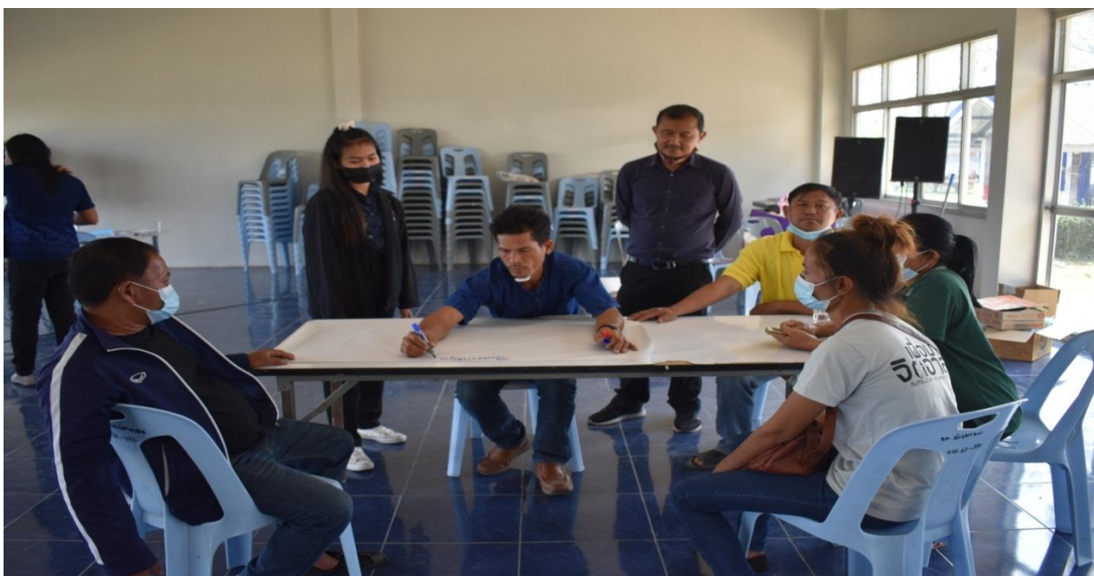
ภาพกิจกรรมวันที่ 3 เข้า เรียนรู้ความสำเร็จ “โก่งธนูโมเดล”/ถอดบทเรียนและการประชาสัมพันธ์ ป้าย มอบใบงาน วิเคราะห์หมู่บ้านด้วยเทคนิค AIC/ทำแผนปฏิบัติการ