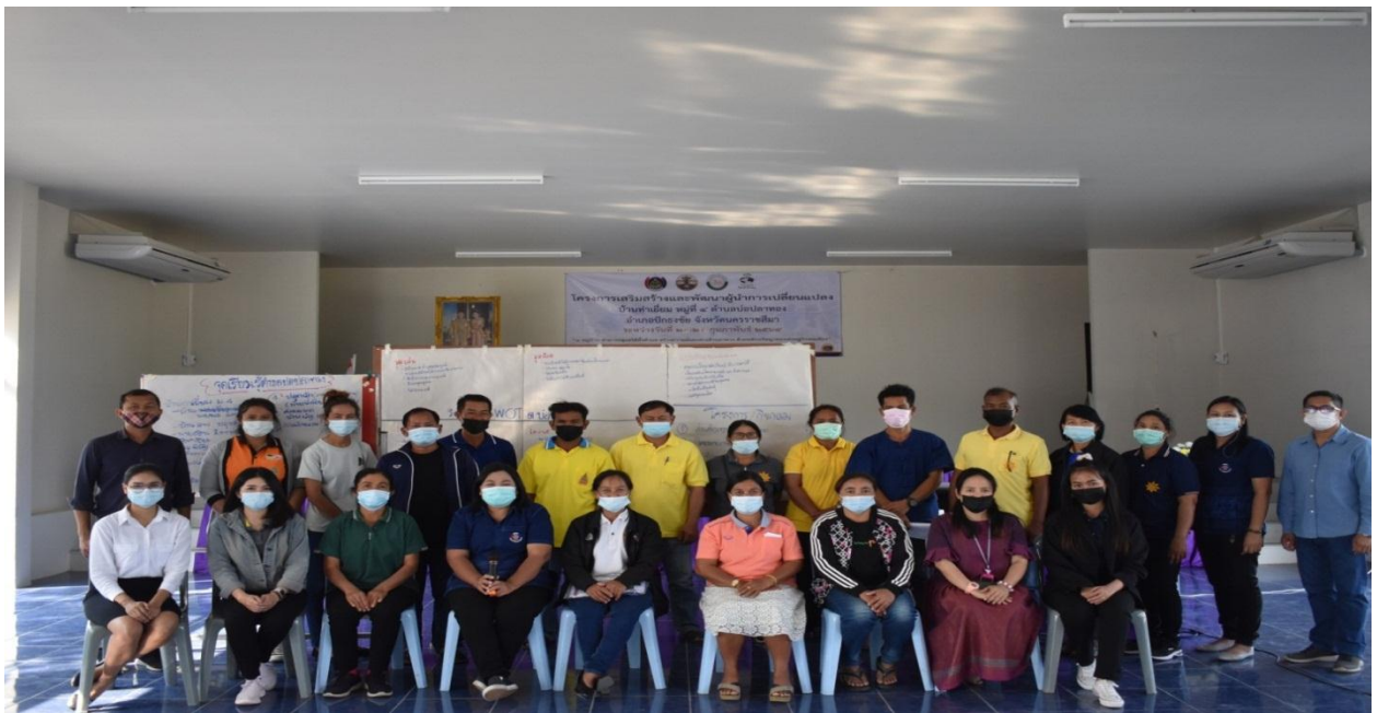
ภาพกิจกรรมวันที่ 3 เข้า เรียนรู้ความสำเร็จ “โกงธนูโมเดล”/ถอดบทเรียนและการประชาสัมพันธ์ บ่าย มอบใบงาน วิเคราะห์หมู่บ้านด้วยเทคนิค AIC/ทำแผนปฏิบัติการ