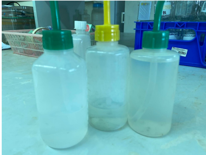
รูปที่ ก-3 ขวดบรรจุน้ำกลั่น