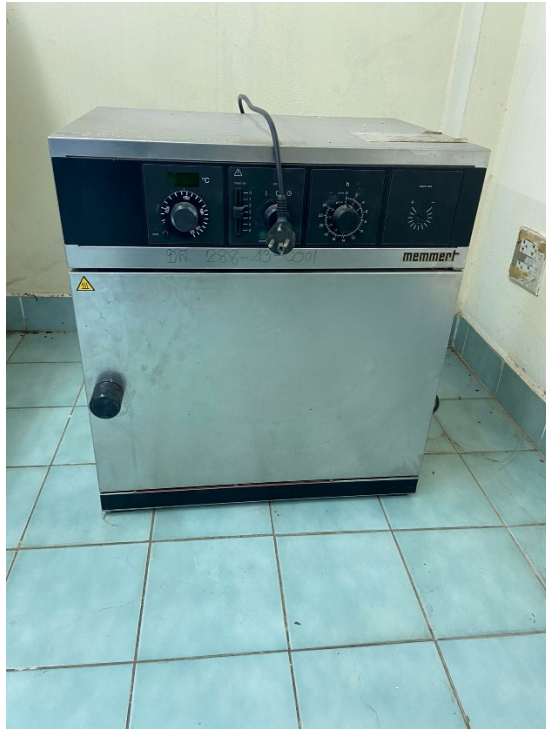
รูปที่ ก-6 ตู้อบ