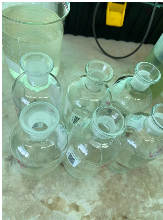
รูปที่ ก-8 ขวดปิโอติขนาด 300 มิลลิลิตร