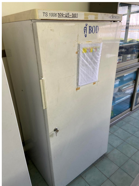
รูปที่ ก-7 ตู้ BOD