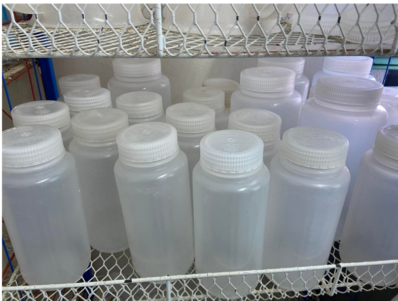
รูปที่ ก-2 ขวดเก็บตัวอย่างน้ำขนาด 1 ลิตร