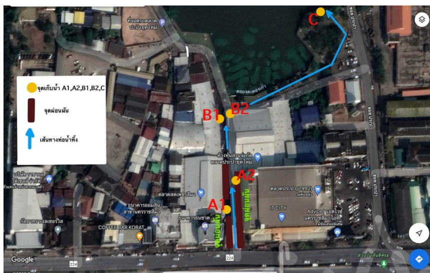
รูปที่ 2 แผนที่ของพื้นที่เก็บตัวอย่างน้ำ

ในการศึกษาคุณภาพน้ำในครั้งนี้ได้ศึกษาแหล่งน้ำทิ้งในตลาดประปาและตลาดเพชรสีมา บริเวณซอยประปา 35 เทศบาลนครราชสีมา ตำบล ในเมือง อำเภอเมืองนครราชสีมา จังหวัดนครราชสีมา