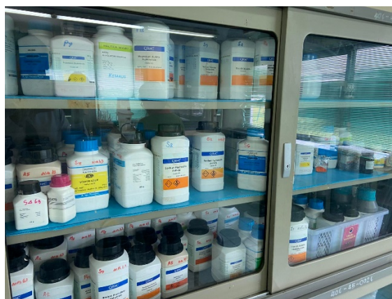
รูปที่ ก-9 สารเคมีต่างๆ ที่ใช้ในการตรวจสอบคุณภาพน้ำตามค่าพารามิเตอร์ที่กำหนด