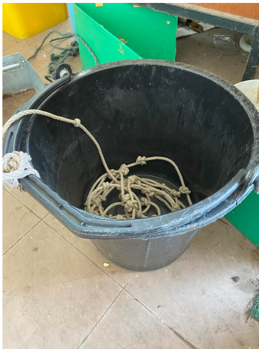
รูปที่ ก-1 ถังเก็บตัวอย่างน้ำ