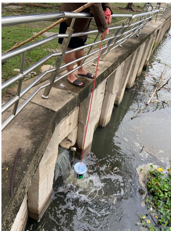
รูปที่ ก-11 นำถังมารองน้ำที่ไหล จากนั้นจับเวลาจนกว่าน้ำจะไหลเข้าเต็มถังเพื่อคำนวณน้ำเสียต่อวัน