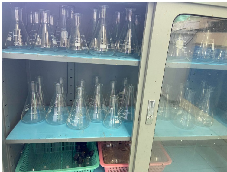
รูปที่ ก-10 เครื่องแก้วต่างๆ