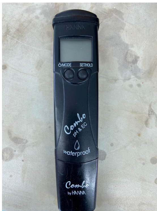
รูปที่ ก-5 พีเอชมิเตอร์