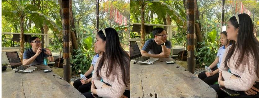
ภาพที่ 1 ประชุมก่อนจัดกิจกรรมอบรมกับวิทยากรและการเตรียมสื่อและอุปกรณ์ในการจัดทำโครงการ