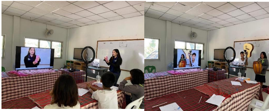
ภาพที่ 5 ทดลองการไลฟ์สดการขายของออนไลน์ให้ห้อง ๆ ได้ลองปฏิบัติขายจริง