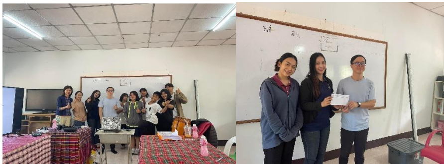
ภาพที่ 6 สิ้นสุดกิจกรรมการอบรมโครงการส่งเสริมทักษะการขายสินค้าเพื่อพัฒนาทักษะชีวิต สำหรับเด็กมูลนิธิช่วยเหลือเด็ก (บ้านลูกรัก) อำเภอเมือง จังหวัดขอนแก่น