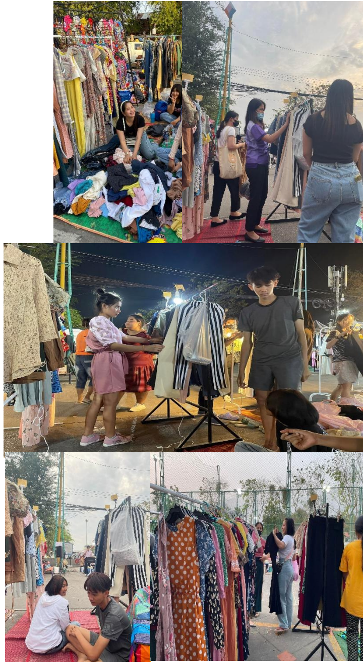
ภาพที่ 9 เป็นการฝึกทักษะให้น้อง ๆ ได้ปฏิบัติจริงมีประสบการณ์จริงพบปะกับผู้คนจริงให้เกิดความกล้า เป็นการสร้างอาชีพเสริมให้น้อง ๆ เพื่อนำรายได้เข้าสู่มูลนิธิเพื่อหมุนเวียนค่าใช้จ่ายต่าง ๆ