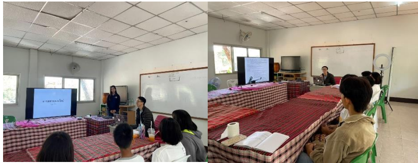
ภาพที่ 2 ผู้จัดทำโครงการกล่าวเปิดการอบรมโครงการส่งเสริมทักษะการขายสินค้าเพื่อพัฒนาทักษะชีวิตสำหรับเด็กมูลนิธิช่วยเหลือเด็ก (บ้านลูกกรัก) อำเภอเมือง จังหวัดขอนแก่น