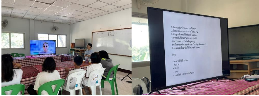
ภาพที่ 4 เข้าสู่กิจกรรมการบรรยายเทคนิคการขายของออนไลน์และยกตัวอย่างคลิปวิดีโอของคน ที่ประสบความสำเร็จของการขายออนไลน์