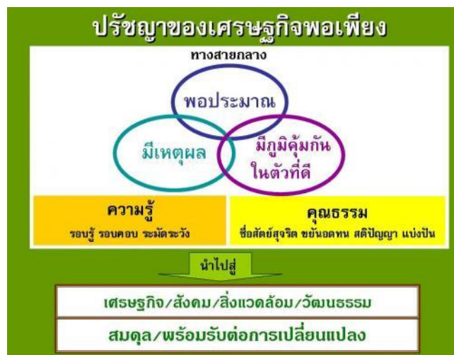
ภาพที่ 2.1 องค์ประกอบปรัชญาของเศรษฐกิจพอเพียง