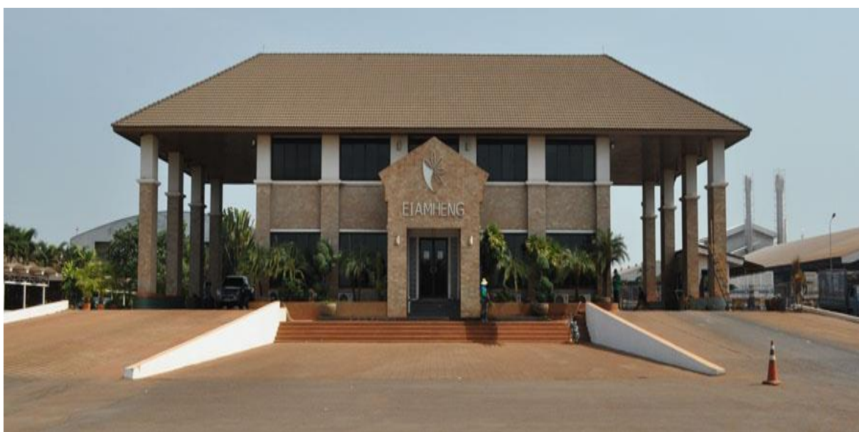
ภาพที่ 2 บริการของบริษัท

บริษัทแป้งมันเอี่ยมเฮงอุตสาหกรรม จำกัด ได้ก่อตั้งขึ้นจากธุรกิจลานมันเอี่ยมเฮงที่ซผลโดยคุณบั๊กเอี่ยม แซ่เฮง และก้าวสู่อุตสาหกรรมผลิตแป้งมันสำปะหลังในปี 2536 ที่ อำเภอเสิงสาง จังหวัดนครราชสีมา ด้วยเงินทุนจด