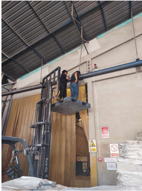
ภาพที่ 3 ผลงานการปฏิบัติงาน