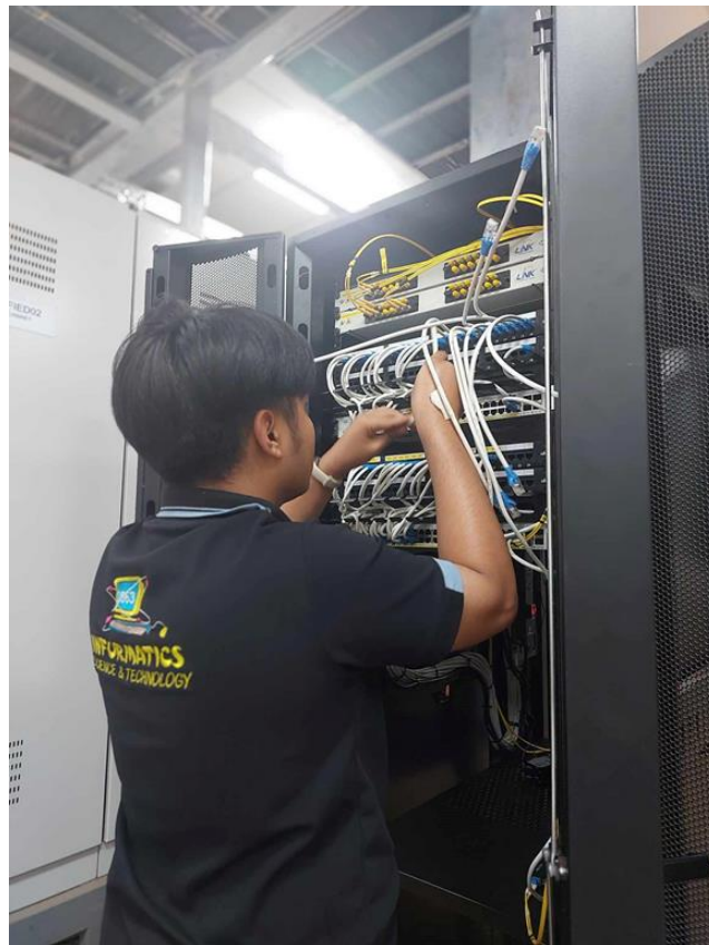
ภาพที่ 4 ผลงานการปฏิบัติงาน