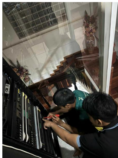
ภาพที่ 2 ผลงานการปฏิบัติงาน