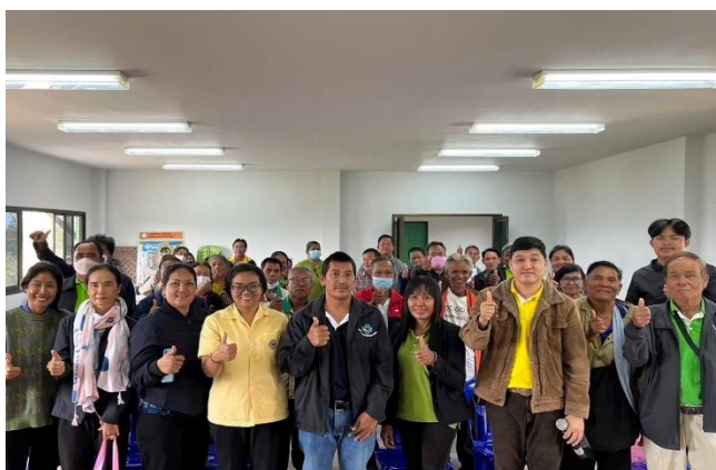
ภาพที่ 2.5 เป็นผู้ช่วยวิทยากรเพื่อเพิ่มองค์ความรู้ให้กับเกษตรกร

1.4 อบรมหมอดินอาสาปี2567 ณ อำเภเทพารักษ์ จังหวัดนครราชสีมา