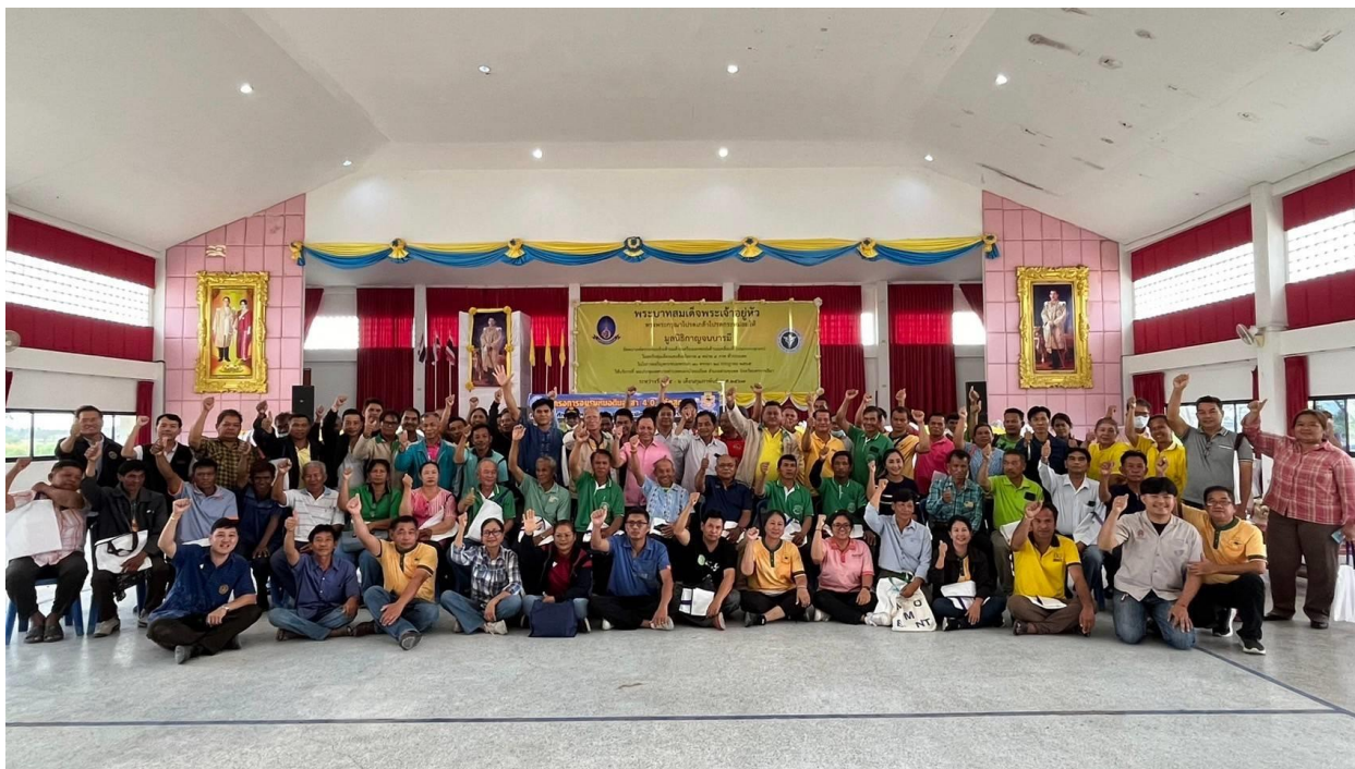
ภาพภาคผนวกที่ 14 อบรมหมอดินเพื่อเพิ่มความรู้ให้แก่หมอดิน ในอำเภอด่านขุนทด จังหวัดนครราชสีมา