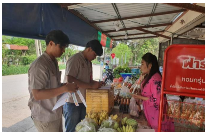
ภาพที่ 2.12 ลงพื้นที่เพื่อตรวจสอบปริมาณน้ำนมดิบและปริมาณโคนมของเกษตรกร