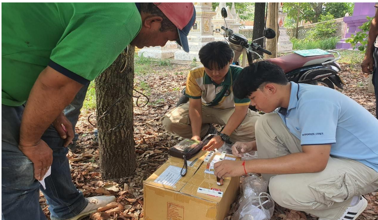
ภาพภาคผนวกที่ 6 ให้บริการโดโลไมท์ให้เกษตรกรในเขตพื้นที่รับผิดชอบ