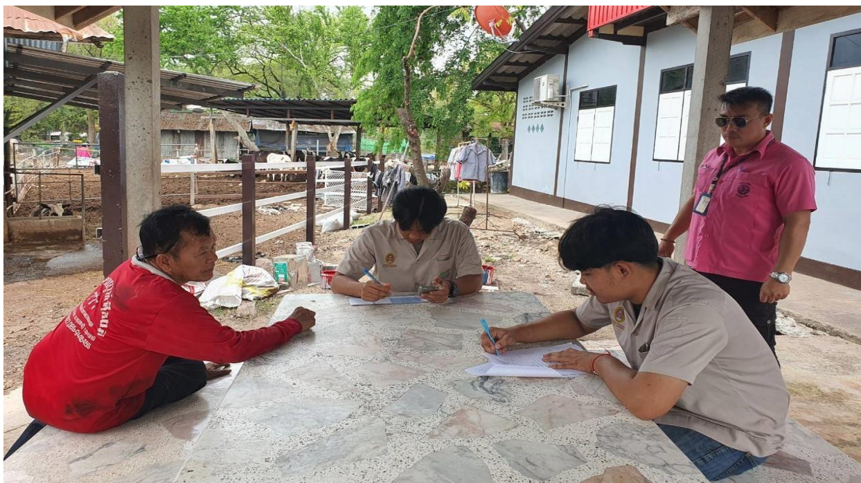
ภาพภาคผนวกที่ 10 ลงพื้นที่เพื่อตรวจสอบเกษตรกรที่เลี้ยงโคนม ณ อำเภอปากช่อง จังหวัดนครราชสีมา