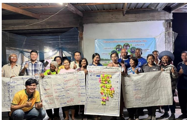
ภาพที่ 2.11 ถอดบทเรียนเพื่อหาวิธีลดต้นทุนและหาแนวทางในการทำการเกษตรแบบใหม่ให้กับเกษตรกร