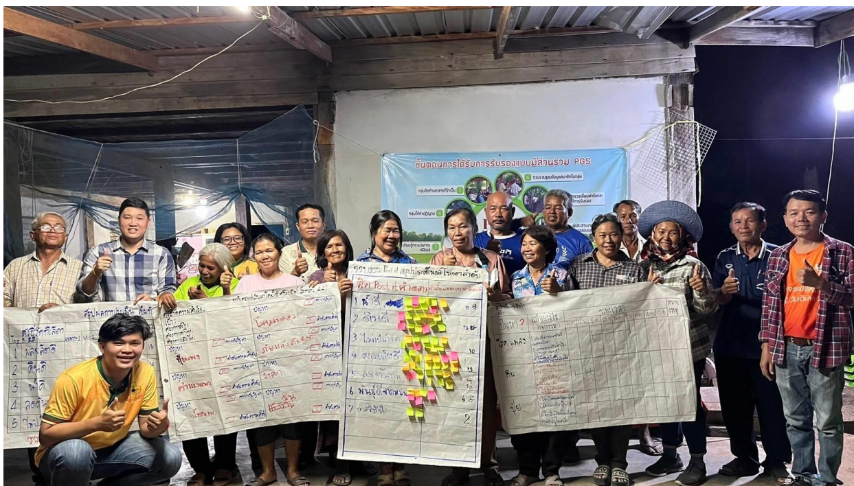
ภาพภาคผนวกที่ 12 ลงพื้นที่บ้านหนองกรด เพื่อถอดบทเรียนเรื่องมันสำปะหลังให้เกษตรกรในพื้นที่