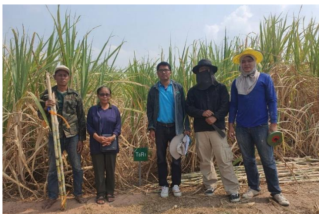
ภาพที่ 2.6 ลงพื้นที่เก็บข้อมูลอ้อยของเกษตรกร

1.5 เก็บตัวอย่างอ้อยของเกษตรกรในพื้นที่ดินเค็มในอำเภอด่านขุนทด จังหวัดนครราชสีมา