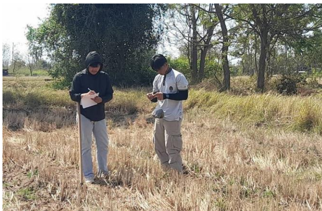
ภาพที่ 2.7 เก็บตัวอย่างดินเพื่อส่งห้องปฏิบัติการ