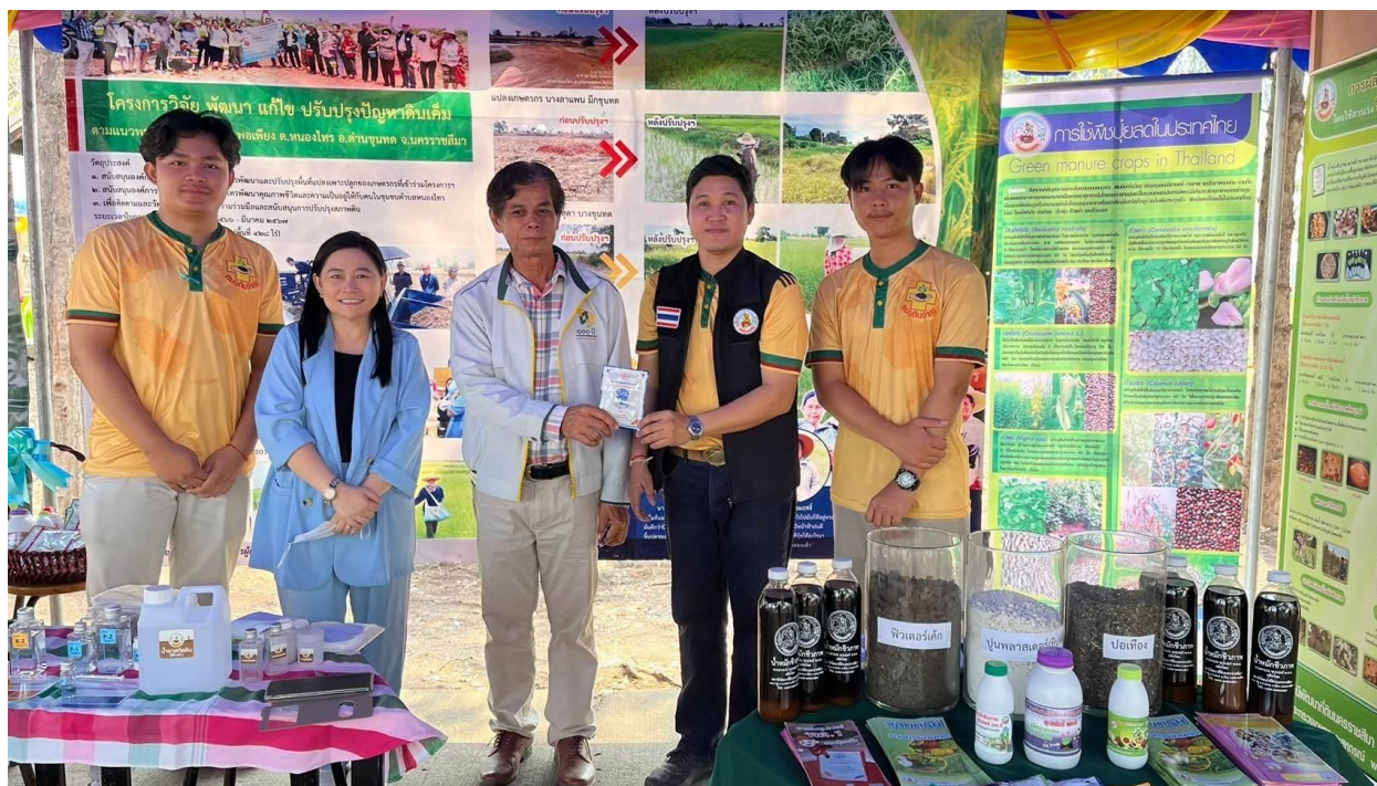
ภาพภาคผนวกที่ 24 ร่วมจัดนิทรรศการให้ความรู้แก่นักเรียน โรงเรียนโนนไทยคุรุอุปถัมภ์ 2