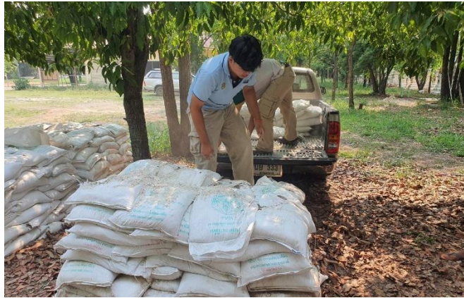
ภาพที่ 2.13 แจกโดโลไมท์ให้กับเกษตรกรเพื่อไปปรับปรุงพื้นที่ของตนเอง