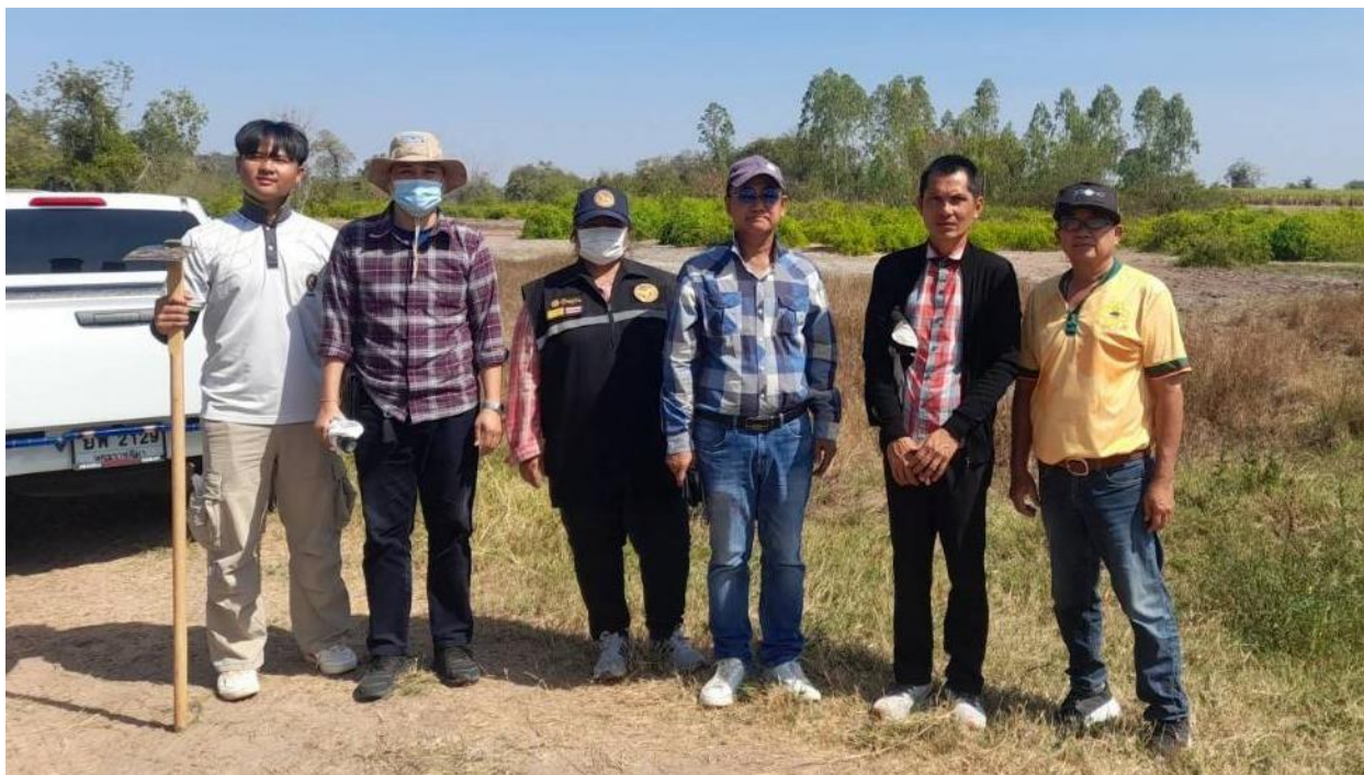
ภาพภาคผนวกที่ 22 ลงพื้นที่เก็บตัวอย่างดินของเกษตรกร ที่อำเภอด่านขุนทด จังหวัดนครราชสีมา