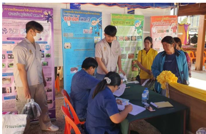
ภาพที่ 2.2 แจกน้ำหมักของกรมพัฒนาที่ดิน