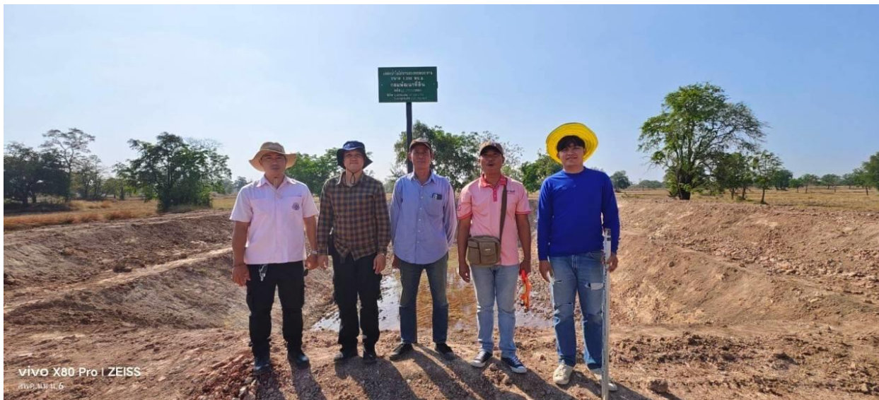
ภาพภาคผนวกที่ 16 ลงพื้นที่ตรวจสอบบ่อของกรมพัฒนาที่ดินที่มอบให้เกษตรกรในพื้นที่ อำเภอนนไทย จังหวัดนครราชสีมา