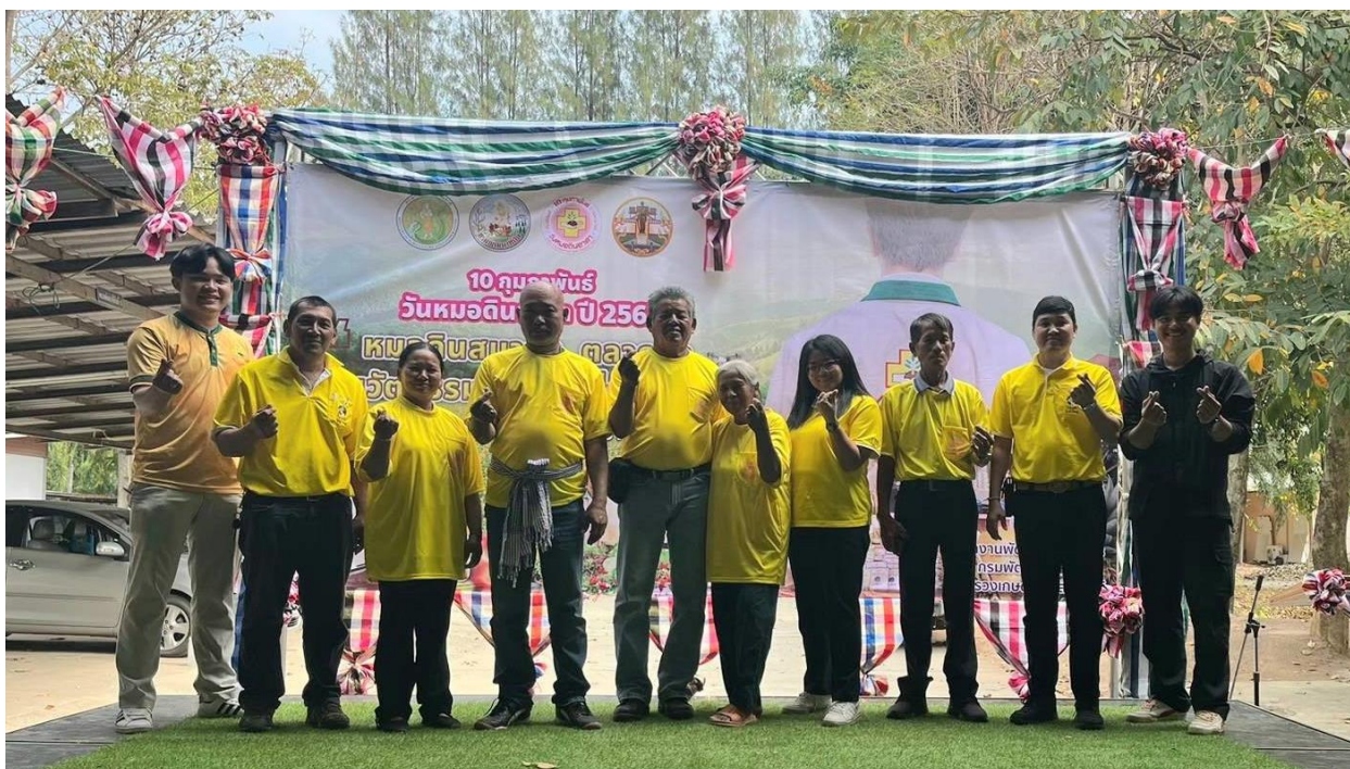
ภาพภาคผนวกที่ 18 ร่วมจัดกิจกรรมงานวันหมอดินอาสา ประจำปี 2567