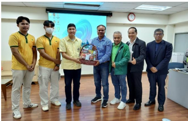
ภาพที่ 2.4 เป็นผู้ช่วยวิทยากรในงานเกษตรมหาวิทยาลัยเทคโนโลยีสุรนารี

1.3 เป็นผู้ช่วยวิทยากรบรรยายในเรื่องของดินเค็มในงานเกษตรของมหาวิทยาลัยเทคโนโลยีสุรนารี