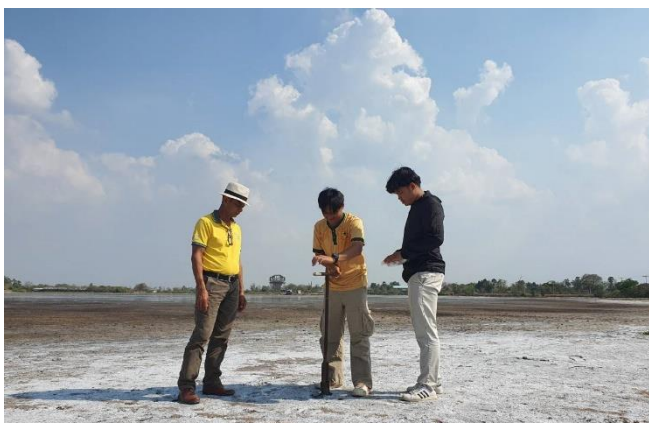
ภาพที่ 2.10 เก็บตัวอย่างดินเค็มที่ตำบลด่านใน อำเภอด่านขุนทด จังหวัดนครราชสีมา