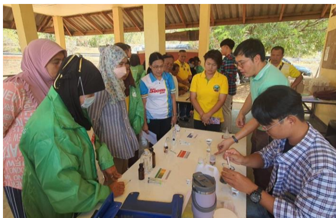
ภาพที่ 2.3 ตรวจวิเคราะห์ธาตุอาหารในดินให้กับเกษตรกร