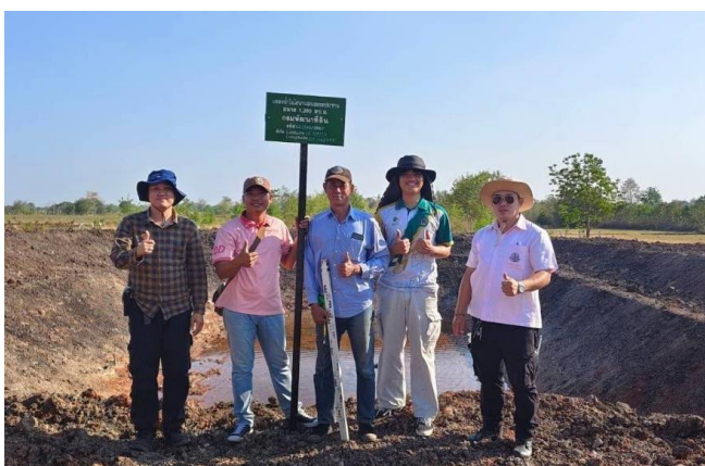
ภาพที่ 2.8 ร่วมตรวจบ่อของกรมพัฒนาที่ดิน