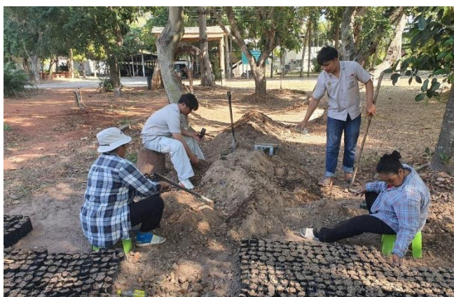
ภาพที่ 2.9 เตรียมดินเพื่อปลูกหญ้าแฝกเพื่อมอบให้กับเกษตรกร