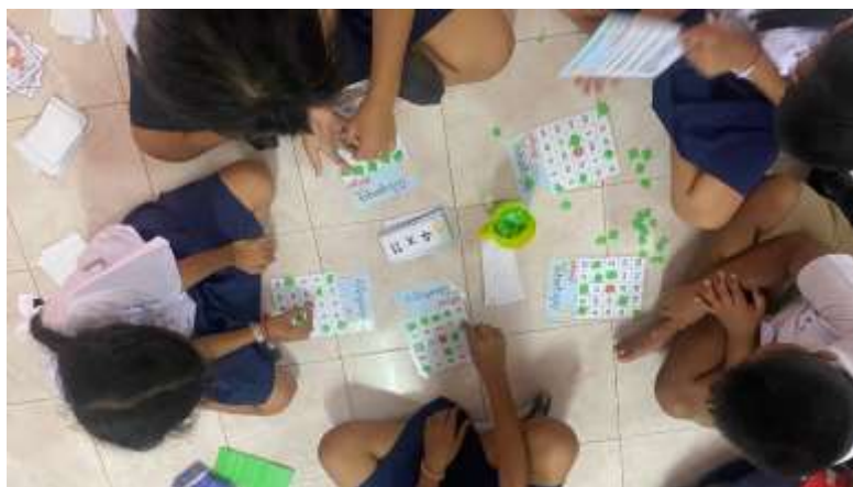
ภาพที่ 2.9 กิจกรรมบิงโกสูตรคูณ