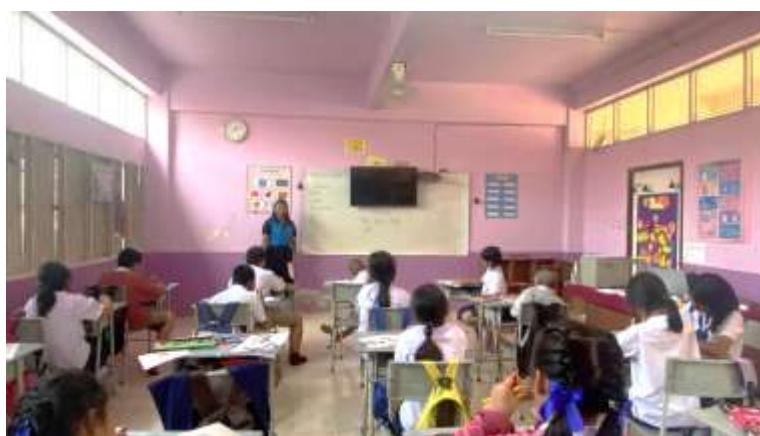
ภาพที่ 2.12 ครูประจำชั้นประถมศึกษาปีที่ 4