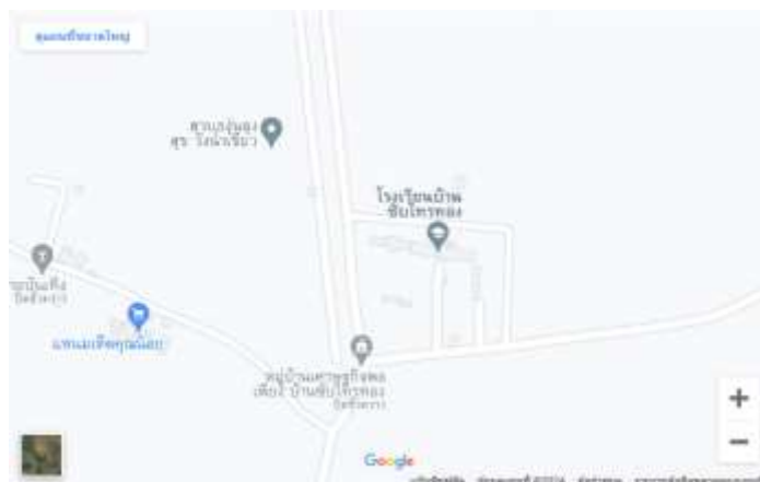
ภาพที่ 1.2 แผนที่ตั้งโรงเรียนบ้านซับไทรทอง