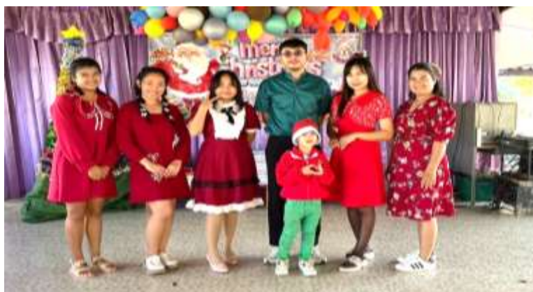
ภาพที่ 2.13 กิจกรรมวันคริสต์มาสและวันปีใหม่