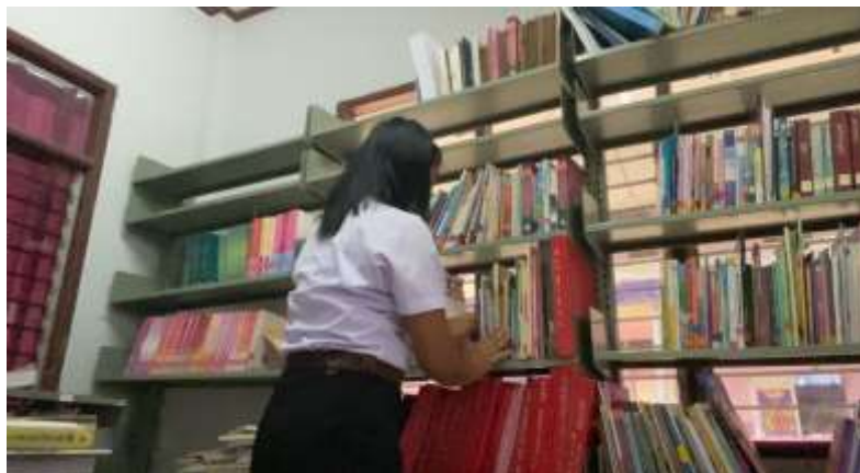
ภาพที่ 2.2 จัดหนังสือเข้าชั้นวางหนังสือ

2.1.2 ผู้ดูแลห้องสมุดโรงเรียนบ้านซับไทรทอง ดูแลทำความสะอาด จัดหนังสือเข้าชั้น และจัดเรียงหนังสือในห้องสมุดโรงเรียนบ้านโกรกกลี ให้น่าใช้