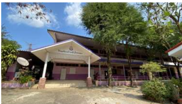
ภาพที่ 1.6 โรงเรียนบ้านซับไทรทอง

โรงเรียนบ้านซับไทรทอง เป็นสถานศึกษาขนาดเล็ก เปิดสอนระดับชั้นปฐมวัย ถึงระดับชั้นประถมศึกษาปีที่ 6 โรงเรียนบ้านซับไทรทอง มีลักษณะการให้บริการ ได้แก่ จัดสอนตามหลักสูตรแกนกลางการศึกษาขั้นพื้นฐาน พุทธศักราช 2551 โดยได้ร่วมกันจัดสัดส่วนของเวลาเรียน : สาระการเรียนรู้ ในแต่ละกลุ่มสาระ สาระเพิ่มเติม และกิจกรรมพัฒนาผู้เรียน รวมถึงการส่งเสริมแหล่งเรียนรู้ภายในโรงเรียน ได้แก่ กิจกรรมชุมนุม กิจกรรมการเรียนรู้ ดนตรี ห้องสมุด สนามฟุตบอล วอลเลย์บอล เพื่อเสริมสร้างทักษะความรู้ ความคิด และการแก้ปัญหาให้ผู้เรียนอยู่เสมอ