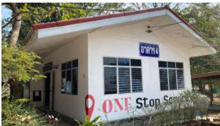
ภาพที่ 1.5 ห้องสมุดโรงเรียนบ้านซับไทรทอง

การให้บริการของโรงเรียนบ้านซับไทรทอง เปิดการเรียนการสอนทุกวันจันทร์ - ศุกร์ (หยุดวันนักขัตฤกษ์และวันเสาร์ - อาทิตย์) เวลาเข้าเรียน 08.30 น. - เวลาเลิกเรียน 16.00 น.