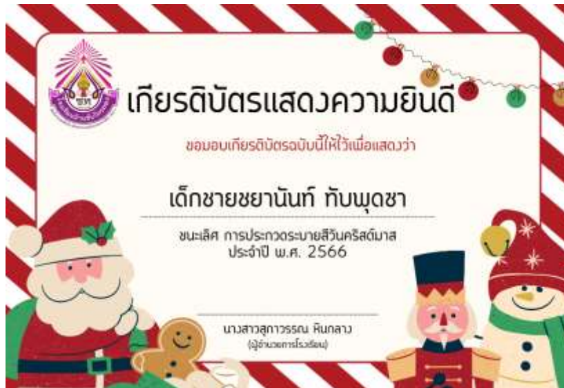
ภาพที่ 3.5 เกียรติบัตรวาดภาพพระบายสีวันคริสต์มาส