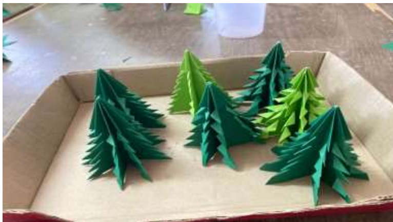
ภาพที่ 2.8 ผลงานจากกิจกรรมต้นคริสต์มาส DIY