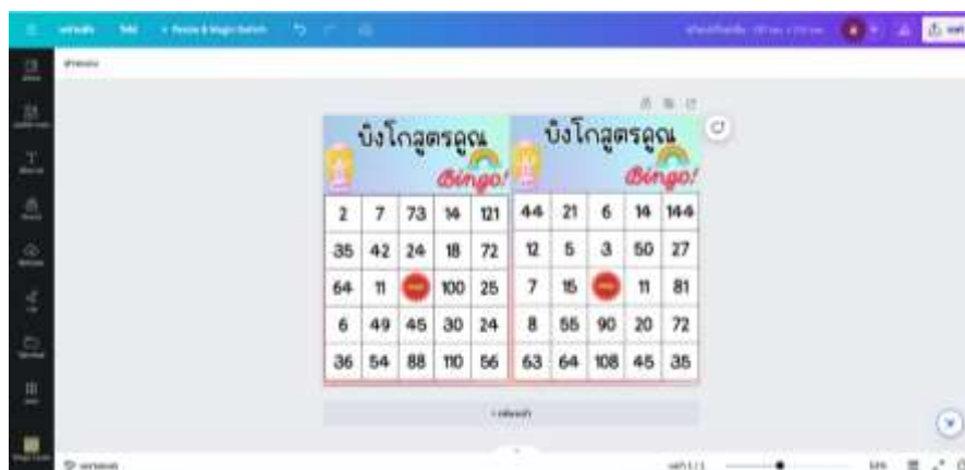
ภาพที่ 2.3 ออกแบบแผ่นเกมบิงโกสุตรคุณ โดยใช้โปรแกรม Canva

2.2.1 วางแผน ออกแบบสื่อ จัดเตรียมอุปกรณ์ และดำเนินการจัดกิจกรรม