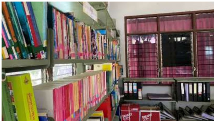
ภาพที่ 2.1 ภาพชั้นหนังสือในห้องสมุดโรงเรียนบ้านซับไทรทอง

2.1.1 ให้บริการและดูแลห้องสมุดโรงเรียนบ้านซับไทรทอง ให้บริการตอบคำถาม และให้คำแนะนำ รวมทั้งจัดกิจกรรมส่งเสริมการอ่าน