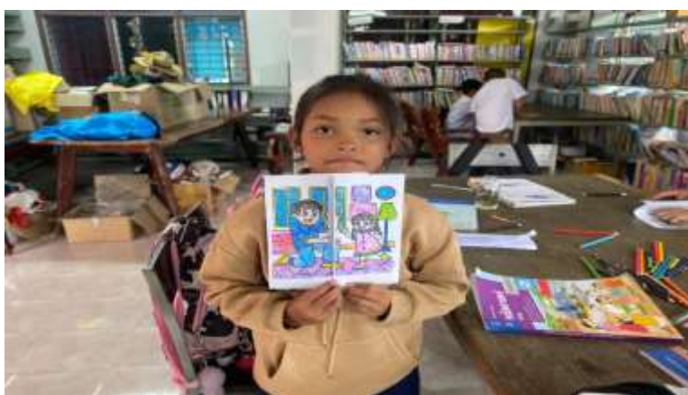
ภาพที่ 2.7 กิจกรรมระบายสีและทำการ์ดวันพ่อแห่งชาติ