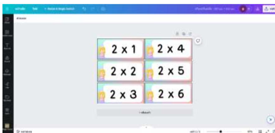
ภาพที่ 2.4 ออกแบบการ์ดสุตรคุณโดยใช้โปรแกรม Canva