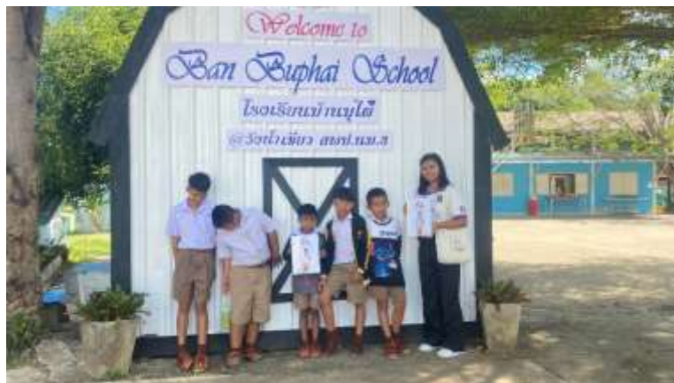
ภาพที่ 2.11 นำเด็กไปแข่งทักษะทางวิชาการ