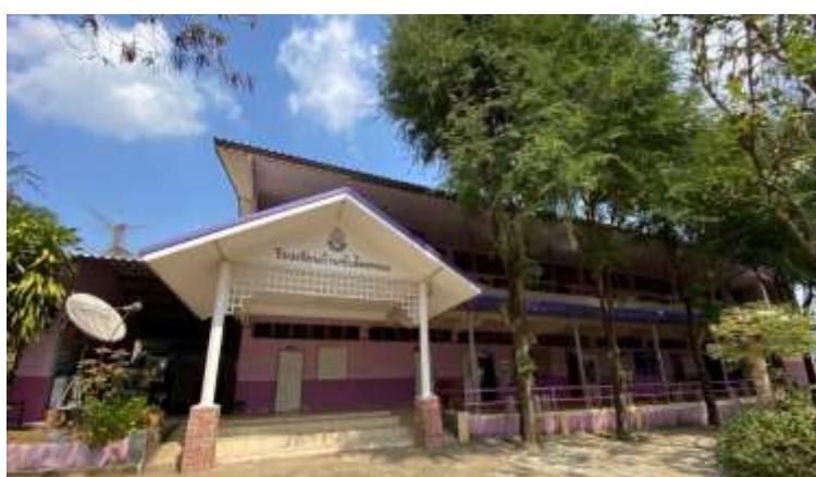
ภาพที่ 1.4 อาคารเรียนระดับชั้นประถมศึกษา