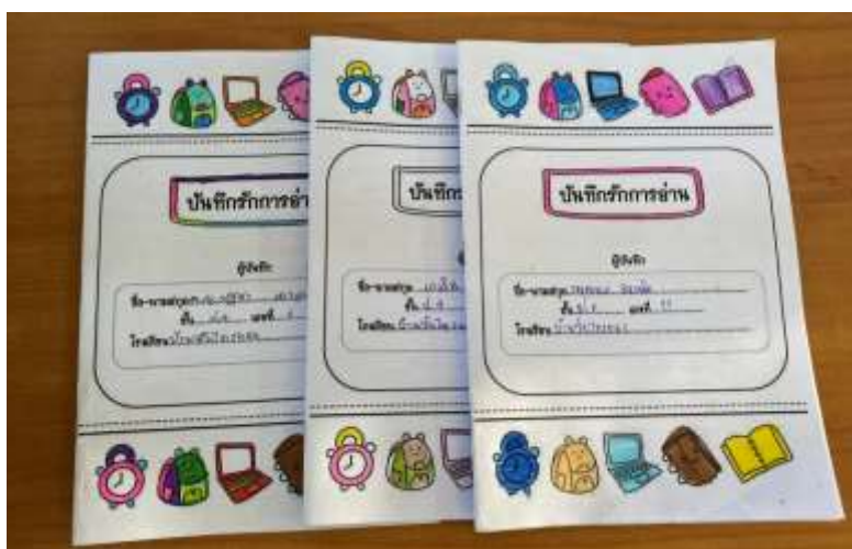
ภาพที่ 2.10 กิจกรรมบันทึกดีมีรางวัล