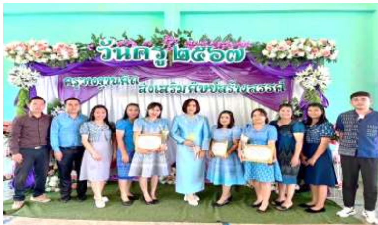
ภาพที่ 2.15 กิจกรรมวันครูแห่งชาติ