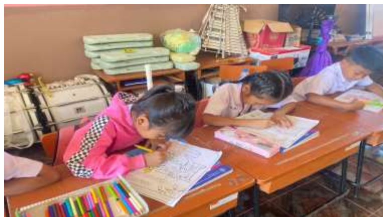
ภาพที่ 2.6 กิจกรรมวาดภาพระบายสีวันคริสต์มาส