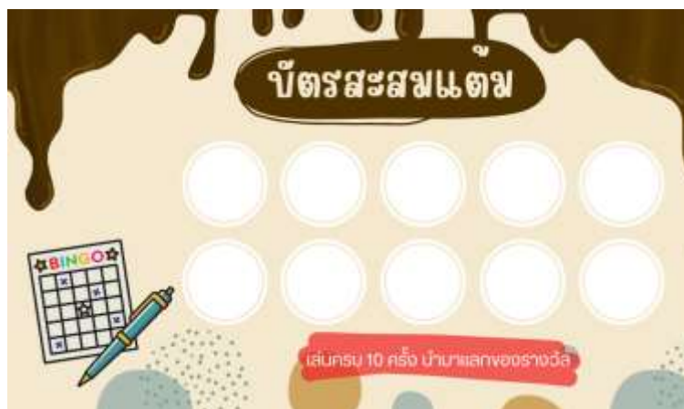
ภาพที่ 3.2 บัตรสะสมแต้มและของรางวัล

4.3.4 ทดลองใช้กิจกรรมส่งเสริมการอ่านกับนักเรียน โรงเรียนบ้านซับไทรทอง