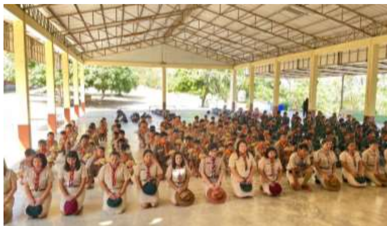
ภาพที่ 2.16 กิจกรรมเข้าค่ายลูกเสือ