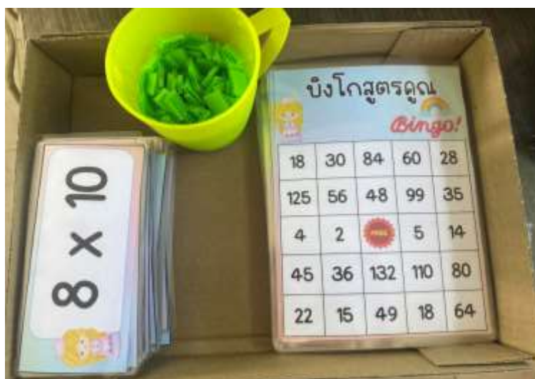
ภาพที่ 3.3 อุปกรณ์สำหรับกิจกรรมบิงโกสุตรคูณ