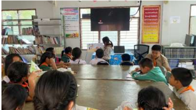
ภาพที่ 3.4 กิจกรรมเล่านิทาน