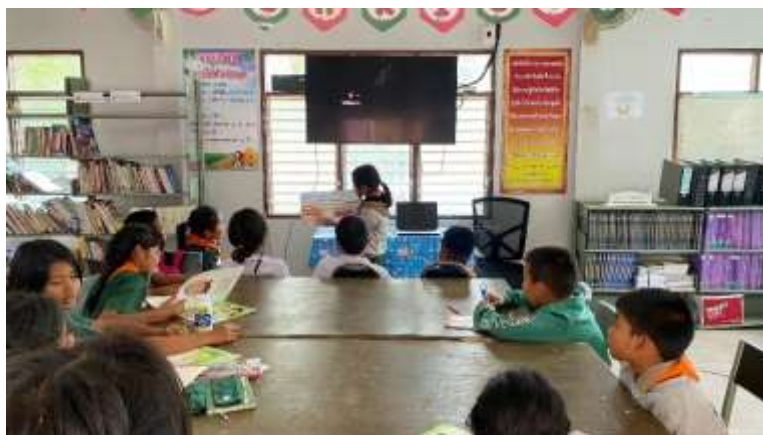
ภาพที่ 2.5 กิจกรรมเล่านิทาน