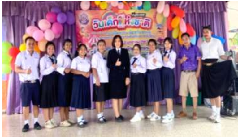
ภาพที่ 2.14 กิจกรรมวันเด็กแห่งชาติ