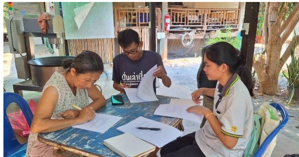
รูปภาพประกอบการสัมภาษณ์