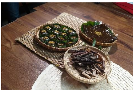
ภาพที่ 4.2 กาละแมวิสาหกิจชุมชนบ้านตำนาคดิน

กालะแมเป็นขนมที่มีรสชาติและกลิ่นหอมเป็นเอกลักษณ์จากสมุนไพรตำนาคดิน มีรสชาติหวานหอมจากกะทิและน้ำตาลมะพร้าว เหนียวนุ่มหนึบ ไม่ใส่สารกันบูด เก็บทานได้ 7 วัน ซึ่งชุมชนบ้านเขาพระเป็นต้นกำเนิดขนมชนิดนี้ วัตถุดิบที่ใช้ในการทำขนมกालะแมประกอบด้วย เม็ดข้าวเหนียว (ไม่ใช่แป้งข้าวเหนียว) หัวกะทิและหางกะทิ น้ำตาลมะพร้าว น้ำตำนาคดิน เกลือ มีขั้นตอนการทำโดยคร่าวๆ คือ การเทหางกะทิและแป้งลงไปในกระทะตั้งไฟบนเตาถ่าน นำเม็ดข้าวเหนียวมาแช่น้ำให้พองจนนิ่ม แล้วปั่นให้ละเอียดกับกะทิ จะช่วยลดเวลาในการกวนจาก 6 ชั่วโมงเหลือ 4 ชั่วโมง ใส่น้ำตำนาคดินลงไปผสม จากนั้นกวนจนข้าวเหนียวสุกประมาณ 15 นาที ใส่หัวกะทิและใส่น้ำตาลมะพร้าว กวนต่ออีกประมาณ 2 ชั่วโมง กวนจนกालะแมไม่ติดนิ้วก็สามารถทานหรือบรรจุภัณฑ์ได้ กาละแมสูตรโบราณนี้ไม่ใส่สารกันบูด แต่ใส่น้ำตำนาคดินซึ่งเป็นพืชสมุนไพรทำให้มีประโยชน์ต่อสุขภาพ