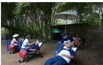
ภาพที่ 4.4 สครับผิวตำนานดินวิสาหกิจชุมชนบ้านตำนานดิน

สครับผิวตำนานดิน มีขั้นตอนการผลิตดังนี้ นำรากตำนานดินมาสับ และนำไปตากแดดประมาณ 5 แดด นำมาคั่วไฟในกระทะและโหลกเป็นผงให้หยาบ โดยมีส่วนผสมดังนี้ ผงตำนานดิน 1 ช้อนชา น้ำผึ้ง 2 ช้อนชา น้ำมันมะกอก 3 ช้อนชา และเกลือแกง 1 ช้อนชา มาผสมกันนำมาสครับผิวตัวเท่านั้น ช่วยให้ผิวเนียนนุ่ม ชะลอวัยและต้านอนุมูลอิสระ