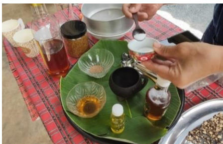
ภาพที่ 4.3 ชงชาตำนานดินวิสาหกิจชุมชนบ้านตำนานดิน

ชาตำนานดิน มีขั้นตอนการผลิตดังนี้ นำรากดิบต้นตำนานดินมาสับและนำไปตากแดด ประมาณ 5 แดด นำมาคั่วไฟในกระทะและโหลกให้เป็นผงให้ละเอียด นำไปร่อนแล้วคั่วไฟอีก 1-2 ครั้ง แล้วนำไปชงดื่มด้วยน้ำร้อน จะมีกลิ่นหอมเหมือนชาจีนเป็นเอกลักษณ์เฉพาะตัว มีประโยชน์ต่อสุขภาพช่วยยาบำรุงกำลัง บำรุงหัวใจ ขับลมในลำไส้ แก้บิดแก้ท้องเสีย