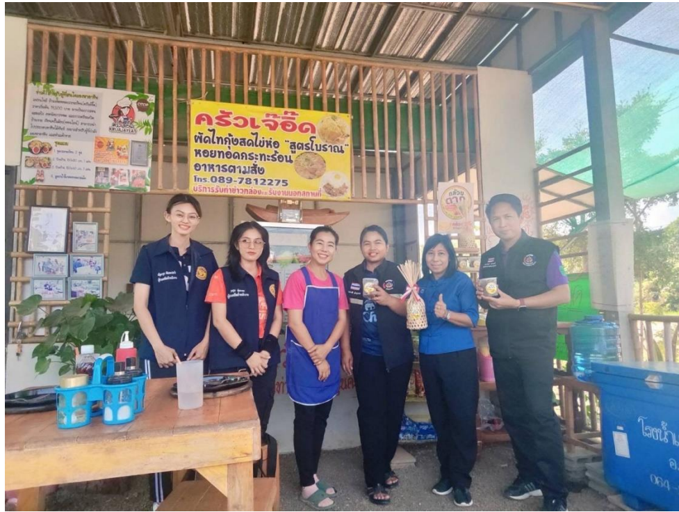
9. การนำกล้วยป๊อปปี้ไปทดลองให้กลุ่มเป้าหมายทั้ง 15 คนได้ชิมและทำแบบประเมินความพึงพอใจที่มีต่อกล้วยป๊อปปี้