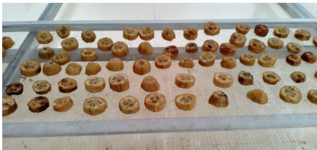
4.4.1.6. นำกล้วยที่ตากแดดแล้วมาพักไว้