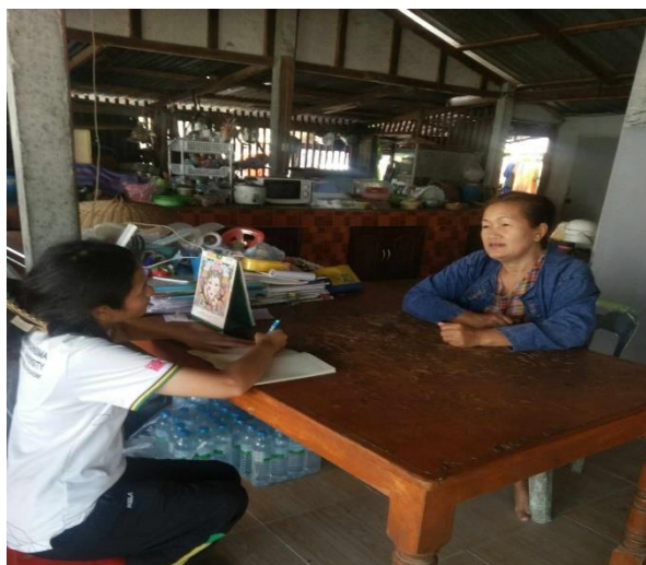
รูปภาพประกอบการสัมภาษณ์