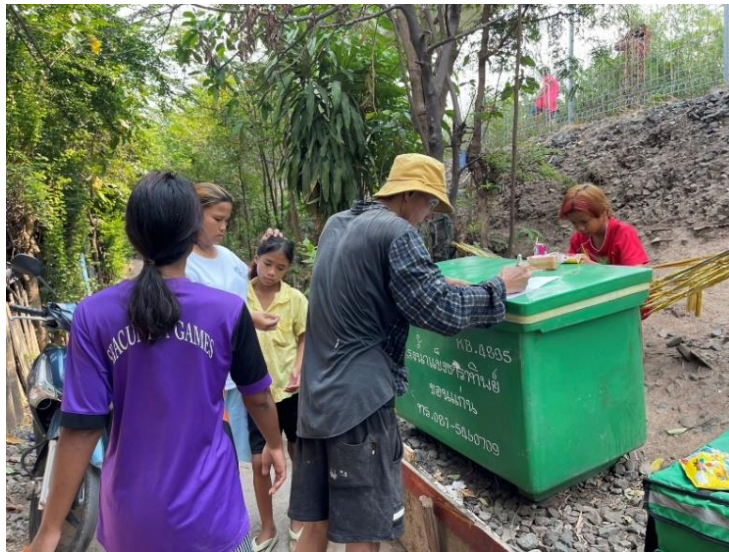
ภาพบรรยากาศตอนลงทะเบียน