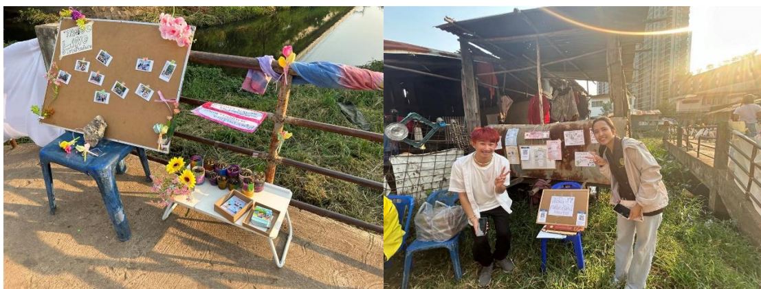
ภาพบรรยากาศตอนลงพื้นที่เข้าร่วมกิจกรรมเปิดโรงเรียนริมราง