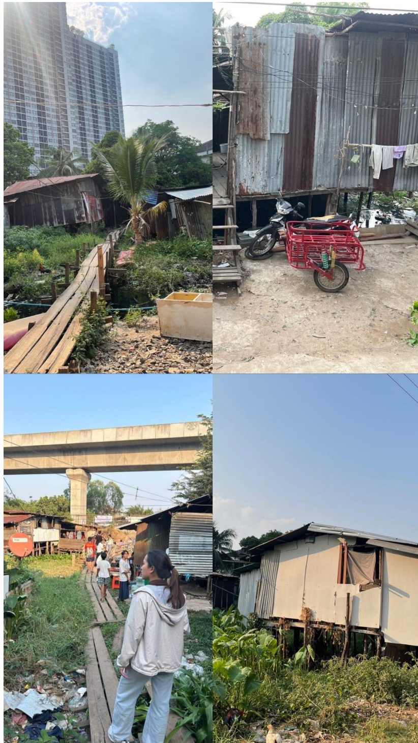
บ้านที่อยู่อาศัยของคนในชุมชน