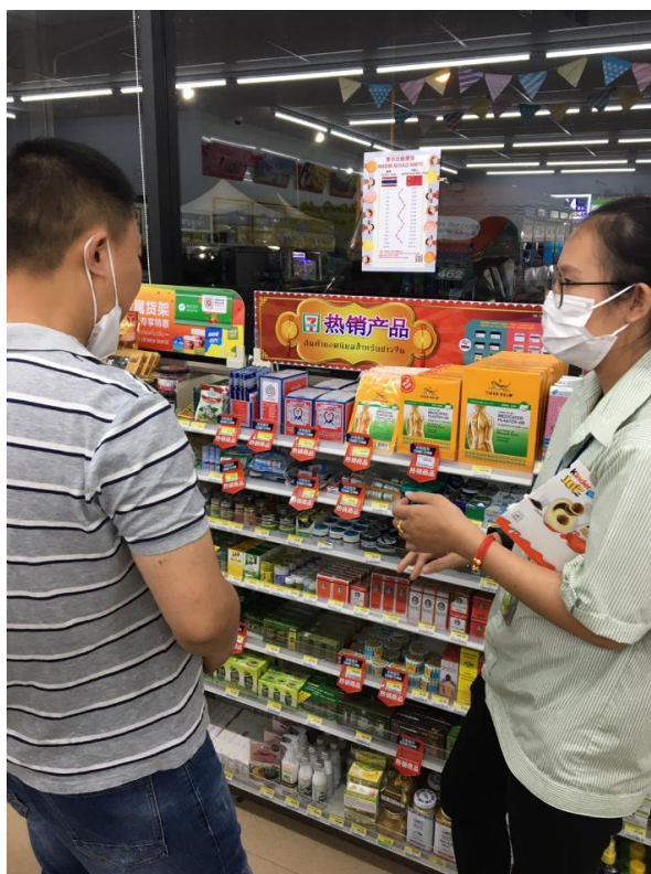
ภาพที่ 3 แนะนำสื่อให้กับลูกค้าชาวจีน