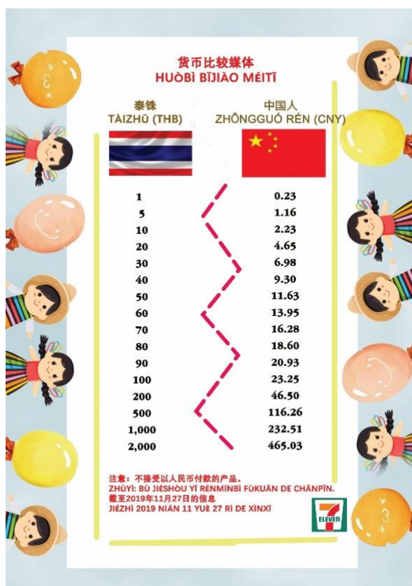
ภาพที่ 1 จัดทำสื่อเปรียบเทียบสกุลเงิน