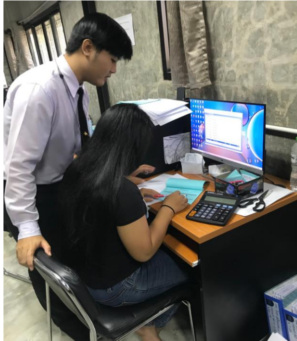
ภาพที่ 1 แสดงการสอนเพื่อนใช้คู่มือระบบการยื่นแบบชำระภาษีออนไลน์ และการนำส่งงบการเงินบัญชีรายชื่อผู้ถือหุ้น