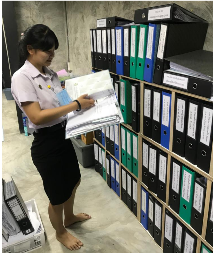
ภาพที่ 5 แสดงการทำงานภายในสำนักงาน