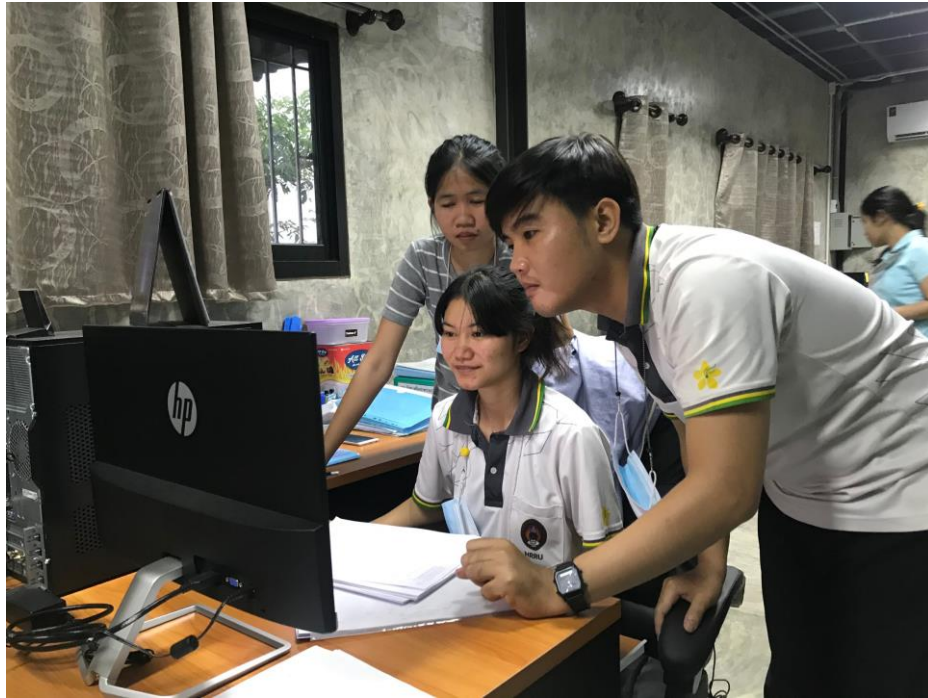
ภาพที่ 7 แสดงการทำงานภายในสำนักงาน