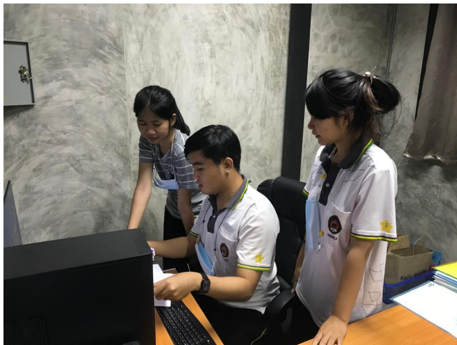
ภาพที่ 8 แสดงการทำงานภายในสำนักงาน