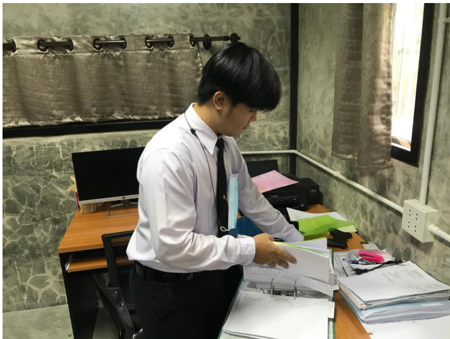
ภาพที่ 6 แสดงการทำงานภายในสำนักงาน