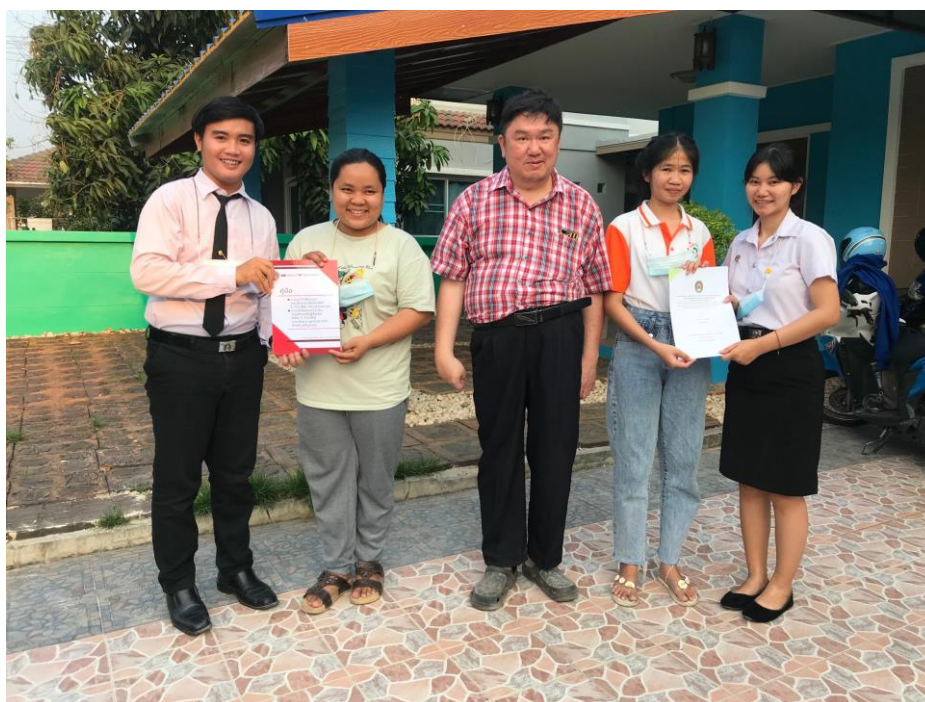
ภาพที่ 10 ถ่ายภาพร่วมกับพนักงานพี่เลี้ยงหุ้นส่วนผู้จัดการ และส่งมอบเล่มคู่มือระบบการยื่นแบบชำระภาษีออนไลน์ และการนำส่งงบการเงินบัญชีรายชื่อผู้ถือหุ้น