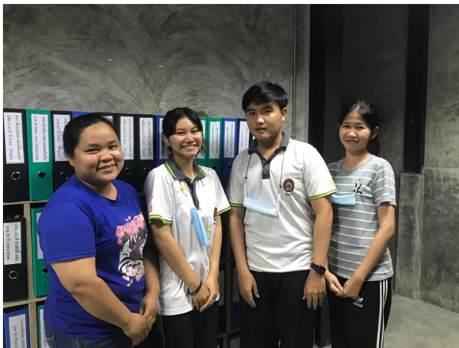
ภาพที่ 9 ถ่ายภาพร่วมกับพนักงานพี่เลี้ยง