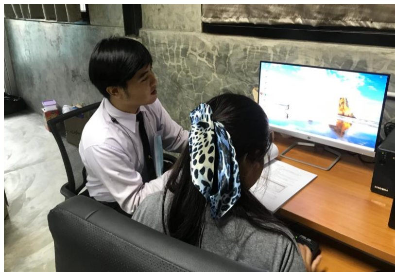
ภาพที่ 2 แสดงการสอนเพื่อนใช้คู่มือระบบการยื่นแบบชำระภาษีออนไลน์ และการนำส่งงบการเงินบัญชีรายชื่อผู้ถือหุ้น