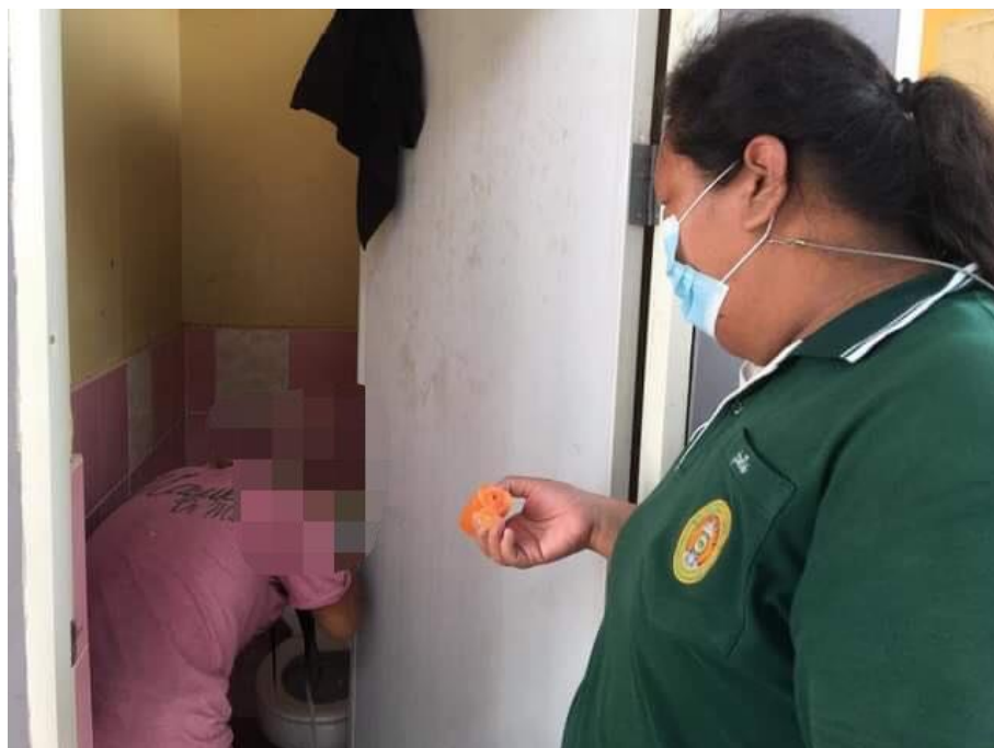
ภาพที่ 19 กิจกรรมการอาบน้ำสระผม วันที่ 28 มกราคม 2564