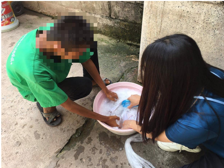
ภาพที่ 14 กิจกรรมทำความสะอาดเครื่องนุ่งห่ม วันที่ 10 กุมภาพันธ์ 2564