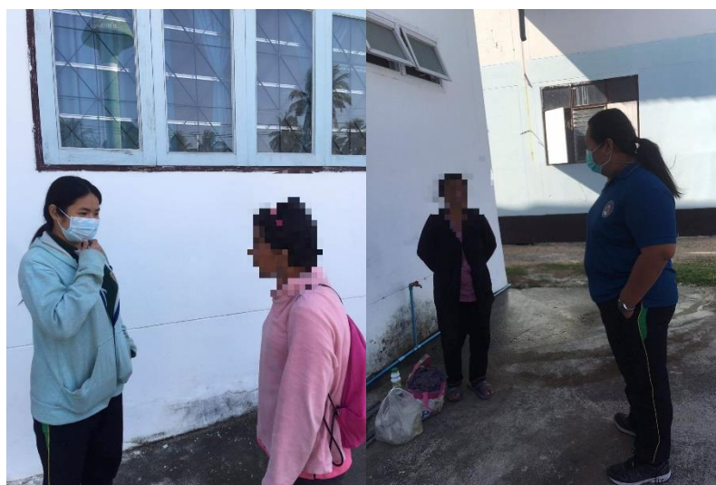
ภาพที่ 5 กิจกรรมการสร้างความสัมพันธ์กับผู้ใช้บริการในเขตหญิง