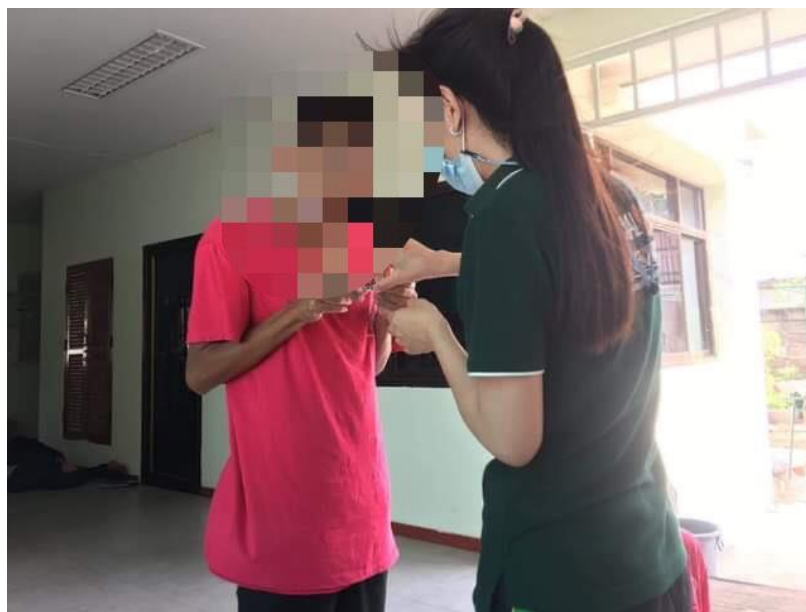
ภาพที่ 11 กิจกรรมการตัดเล็บมือเล็บเท้า วันที่ 19 มกราคม 2564