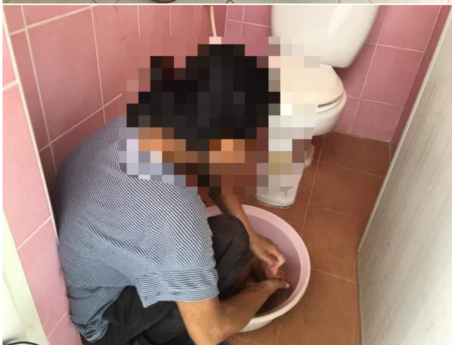
ภาพที่ 25 กิจกรรมทำความสะอาดเครื่องนุ่งห่ม วันที่ 24 กุมภาพันธ์ 2564