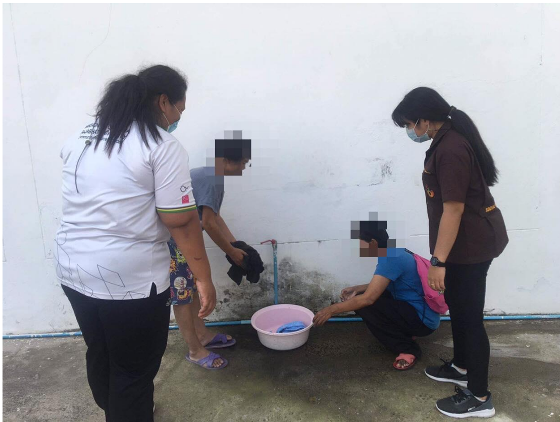
ภาพที่ 23 กิจกรรมทำความสะอาดเครื่องนุ่งห่ม วันที่ 19 มกราคม 2564