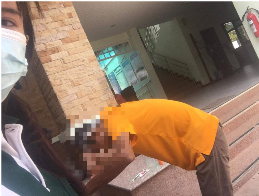
ภาพที่ 9 กิจกรรมการอาบน้ำสระผม วันที่ 7 มกราคม 2564