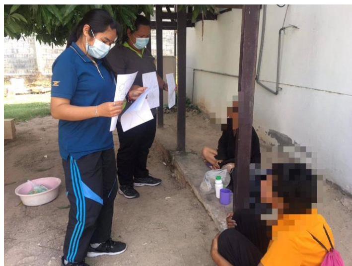
ภาพที่ 7 กิจกรรมการให้ความรู้กับผู้ให้บริการในเขตหญิง