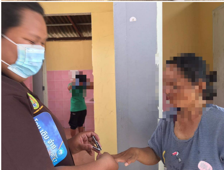
ภาพที่ 21 กิจกรรมการตัดเล็บมือเล็บเท้า วันที่ 4 กุมภาพันธ์ 2564