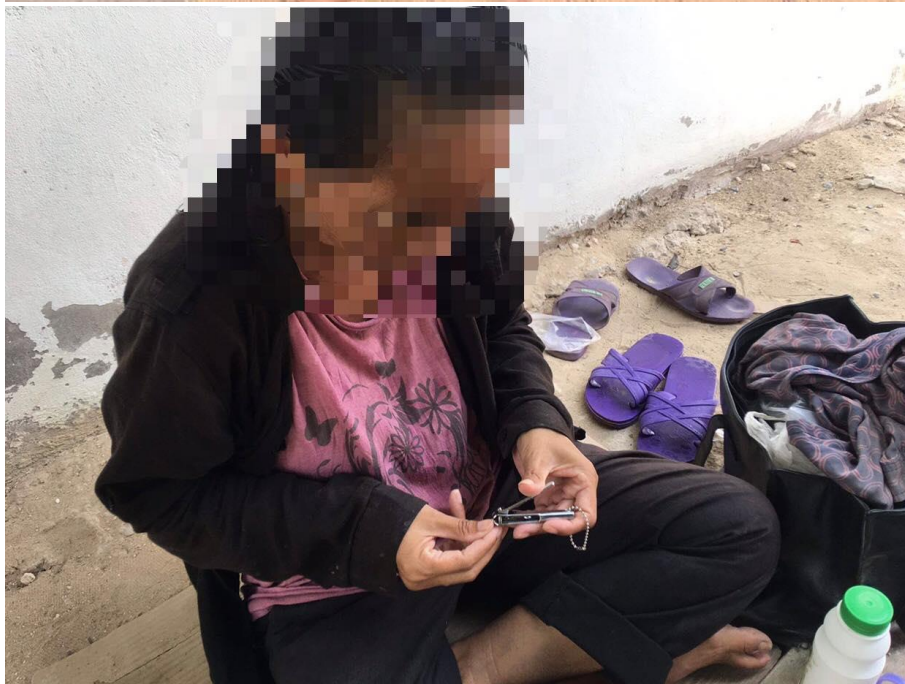
ภาพที่ 22 กิจกรรมการตัดเล็บมือเล็บเท้า วันที่ 16 กุมภาพันธ์ 2564