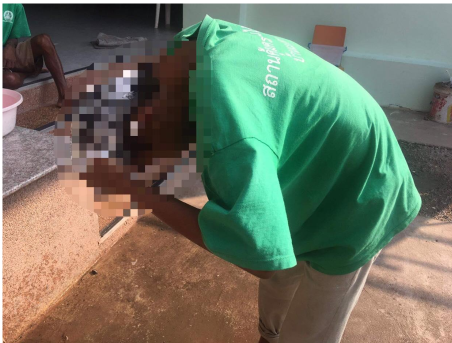
ภาพที่ 10 กิจกรรมการอาบน้ำสระผม วันที่ 13 มกราคม 2564 2) กิจกรรมการตัดเล็บมือเล็บเท้า