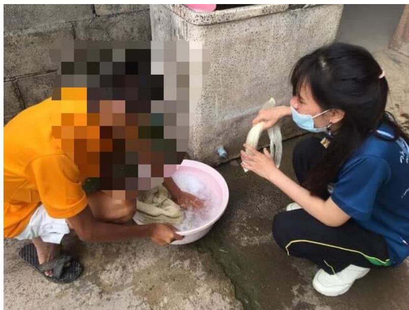
ภาพที่ 15 กิจกรรมทำความสะอาดเครื่องนุ่งห่ม วันที่ 18 กุมภาพันธ์ 2564