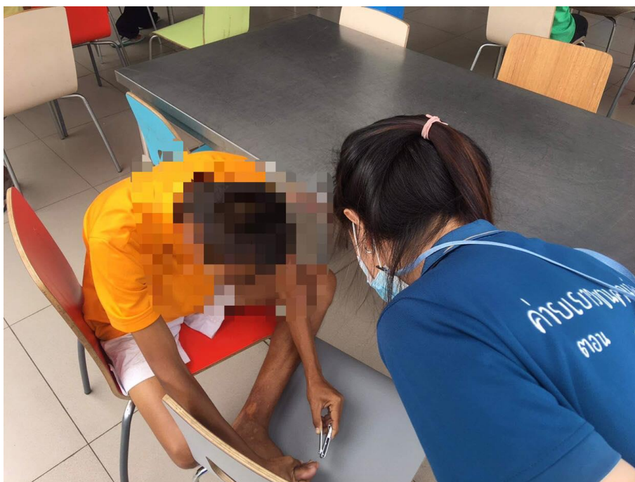
ภาพที่ 12 กิจกรรมการตัดเล็บมือเล็บเท้า วันที่ 2 กุมภาพันธ์ 2564