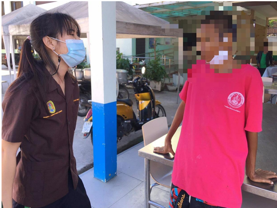
ภาพที่ 4 กิจกรรมการสร้างความสัมพันธ์กับผู้ใช้บริการในเขตชาย