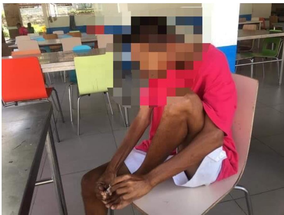
ภาพที่ 13 กิจกรรมการตัดเล็บมือเล็บเท้า วันที่ 28 กุมภาพันธ์ 2564