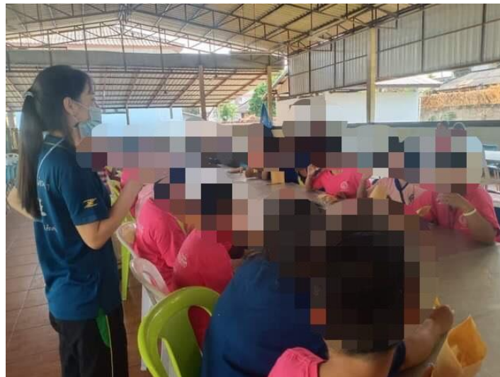
ภาพที่ 3 กิจกรรมการสังเกตพฤติกรรมของผู้ใช้บริการ