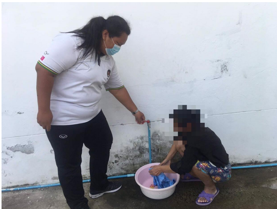
ภาพที่ 24 กิจกรรมทำความสะอาดเครื่องนุ่งห่ม วันที่ 9 กุมภาพันธ์ 2564