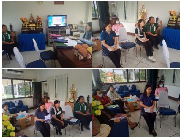
ภาพที่ 2 การประชุมของทีมผู้ดำเนินโครงการและนักสังคมสงเคราะห์

กิจกรรมการประชุมการวางแผนการดำเนินโครงการพัฒนาสุขอนามัยของผู้ใช้บริการ (เฉพาะบุคคล) ในสถานคุ้มครองคนไร้ที่พึ่งบ้านเมตตา จังหวัดนครราชสีมา