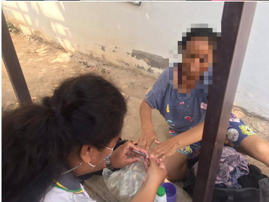
ภาพที่ 20 กิจกรรมการตัดเล็บมือเล็บเท้า วันที่ 13 มกราคม 2564