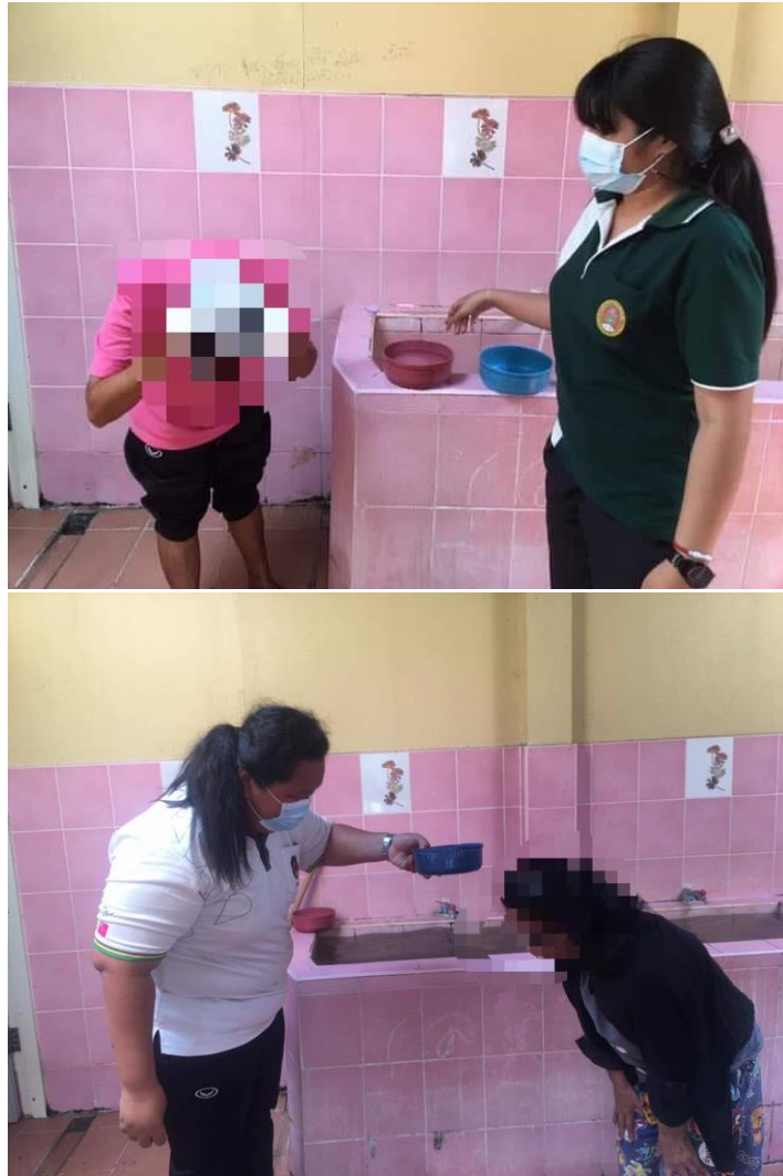
ภาพที่ 17 กิจกรรมการอาบน้ำสระผม วันที่ 5 มกราคม 2564