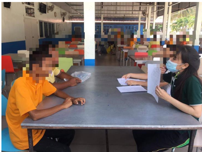
ภาพที่ 6 กิจกรรมการให้ความรู้กับผู้ให้บริการในเขตชาย