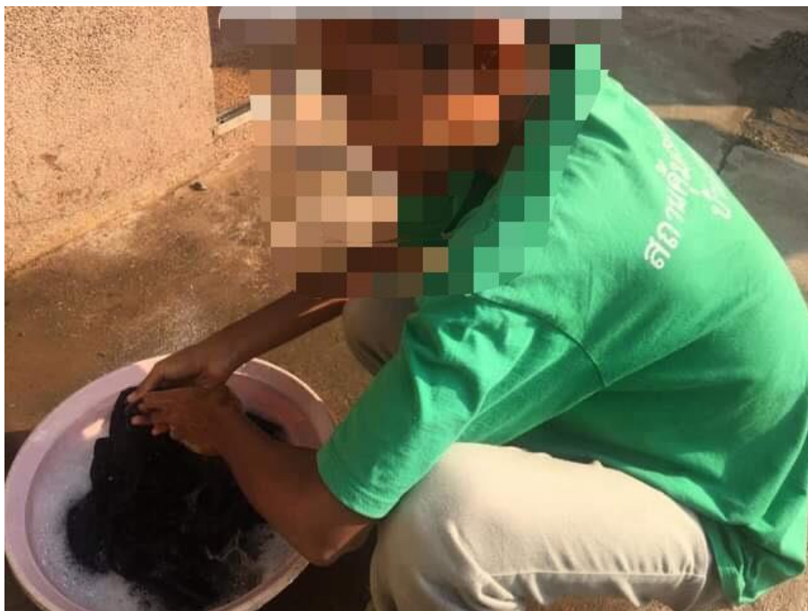
ภาพที่ 16 กิจกรรมทำความสะอาดเครื่องนุ่งห่ม วันที่ 24 กุมภาพันธ์ 2564