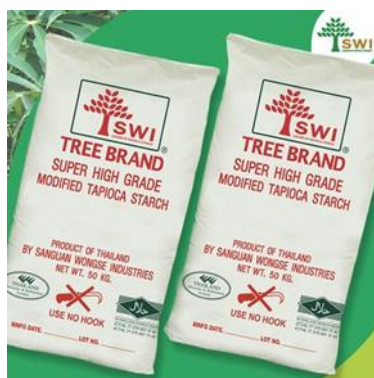
รูปที่ 1.3 ผลิตภัณฑ์แป้งมันสำปะหลัง

บริษัท สงวนวงศ์อุตสาหกรรม จำกัด มีการผลิตแป้งมันสำปะหลังเกรดอุตสาหกรรมและเกรดอาหาร โดยมีทั้งแป้ง Native และแป้ง Modified