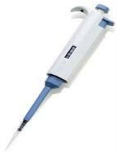
ภาพที่ 4 ไมโครปิเปต (Micropipette)