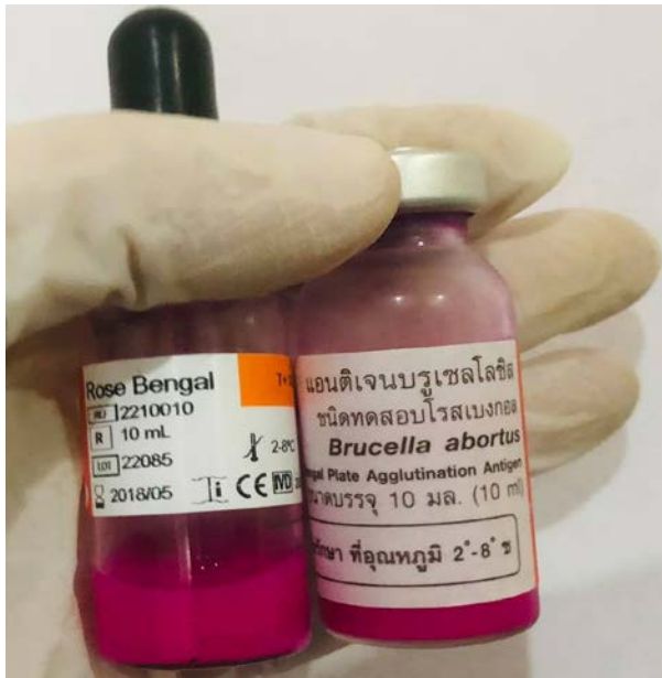
ภาพที่ 5 น้ำยา Rose Bengal test (RBT) และ แอนติเจนบรูเซลโลซิส ชนิดทดสอบโรสเบงกอล