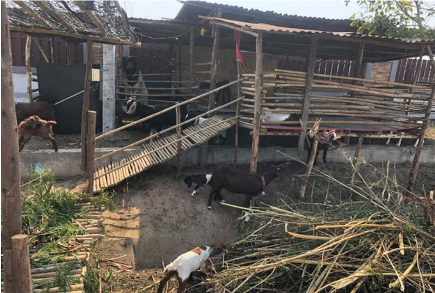
ภาพที่ 1 ลงพื้นที่เก็บตัวอย่างแพะ