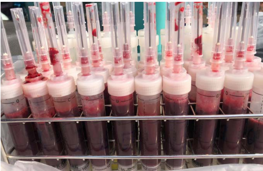
ภาพที่ 2 ตัวอย่างเลือดแพะ