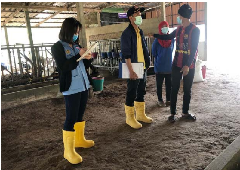
ภาพที่ 7 ทำแบบสอบถามเกษตรกรผู้เลี้ยงแพะ และให้คำแนะนำ