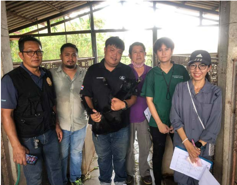
ภาพที่ 6 ลงพื้นที่สอบถามเกษตรกรเลี้ยงแพะ