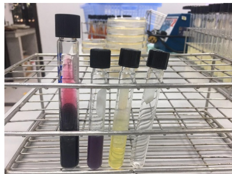
รูปที่ 1.4 การทดสอบ Biochemical test