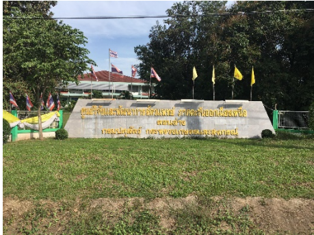
รูปที่ 1.1 ศูนย์วิจัยและพัฒนาการสัตวแพทย์ ภาคตะวันออกเฉียงเหนือตอนล่าง