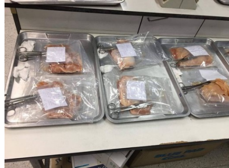
รูปที่ 1.2 เนื้อไก่ดิบและเนื้อสุกรดิบ