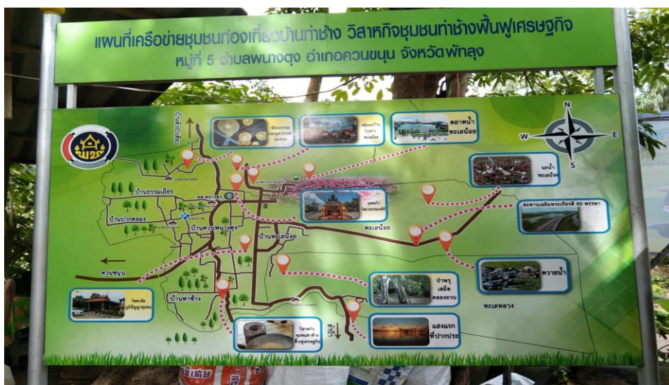
แผนที่ท่องเที่ยวชุมชน ตำบลทะเลน้อย ตำบลนางตงและตำบลลำปำ