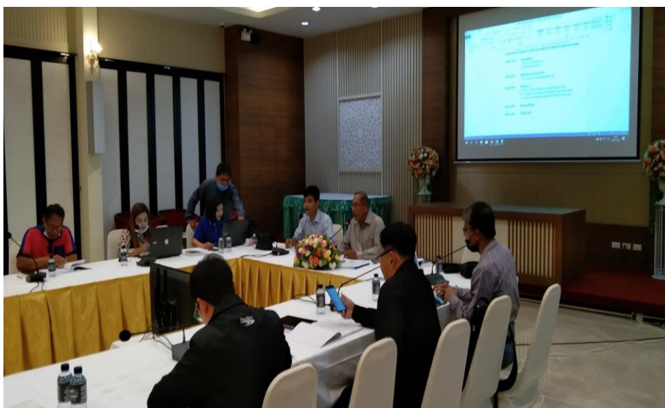
การประชุมคณะทำงานขับเคลื่อนเศรษฐกิจภาคใต้