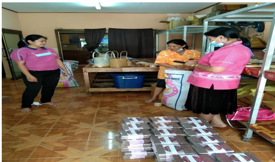
เจ้าหน้าที่จากกรมอุตสาหกรรมเข้ามาส่งเสริมด้านบรรจุภัณฑ์ข้าวสังข์หยด