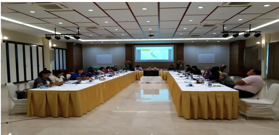
การประชุมคณะกรรมการขับเคลื่อนเศรษฐกิจภาคใต้ เรื่องธุรกิจเพื่อชุมชน cbmc