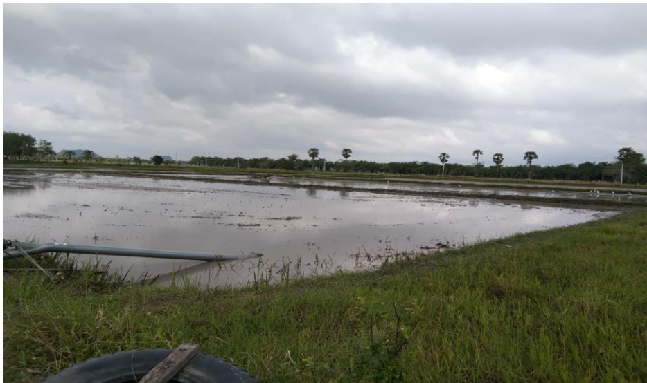
แปลงนาที่สูบน้ำเข้าไปเพื่อเตรียมการดำนา