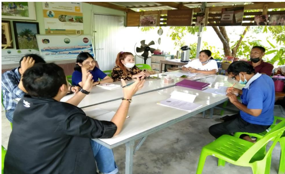
เจ้าหน้าที่ พอช.และไทยเบฟเวอเรจที่เข้ามาส่งเสริมเรื่องธุรกิจเพื่อชุมชน cbmc