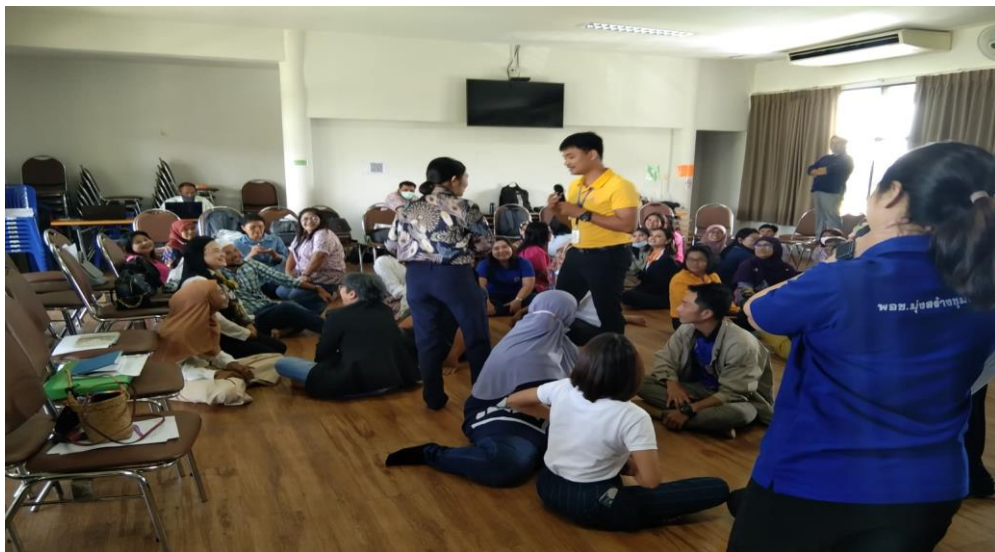
งานสัมมนางานกองเลขา พอช. ภาคใต้