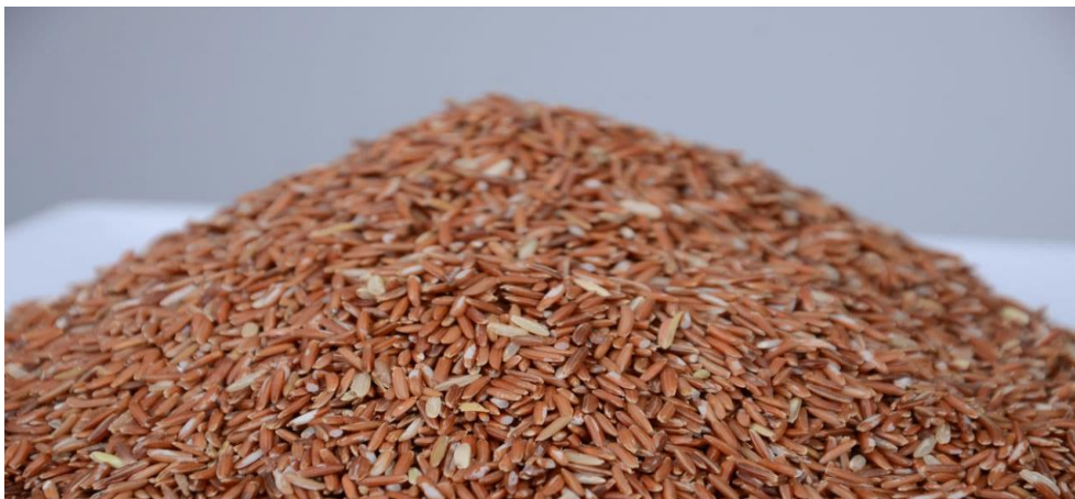
ข้าวสังข์หยดคุณภาพที่ได้จากการผลิตของวิสาหกิจชุมชนท่าช้าง