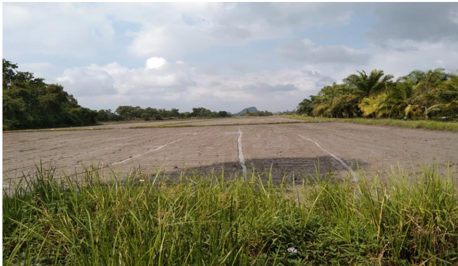
การเตรียมแปลงนาปลูกข้าวของป้าชะอ้อน