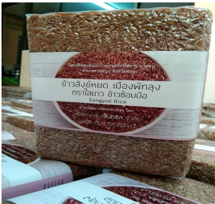
ข้าวสังข์หยดที่บรรจุด้วยเครื่องขึ้นสูญญากาศ