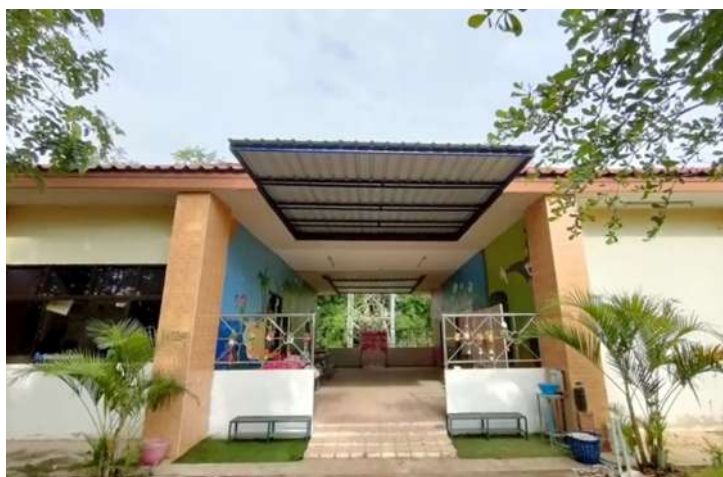
ภาพที่ 1.3 อาคารเรียนระดับชั้นอนุบาล

โรงเรียนบ้านโกรกกลี เป็นสถานศึกษาขนาดเล็ก เป็นโรงเรียนต้นแบบ (NODE) การเปลี่ยนแปลงเชิงระบบด้วยนวัตกรรมจิตศึกษา PBL และ PLC เปิดสอนระดับชั้นปฐมวัย ถึงระดับชั้นประถมศึกษาปีที่ 6 โรงเรียนบ้านโกรกกลีมีลักษณะการให้บริการ ได้แก่ จัดการสอนตามหลักสูตรแกนกลางการศึกษาขั้นพื้นฐาน พ.ศ. 2561 โดยได้ร่วมกันจัดสรรส่วนของเวลาเรียน : สาระ การเรียนรู้ ในแต่ละกลุ่มสาระ สาระเพิ่มเติม และกิจกรรมพัฒนาผู้เรียน รวมถึงการส่งเสริมแหล่งเรียนรู้ภายในโรงเรียน ได้แก่ กิจกรรมการเรียนรู้ PBL กิจกรรมชุมนุม กิจกรรมจิตศึกษาอนุบาล กิจกรรมการเรียนรู้ภาษาอังกฤษกับครูอาสา ดนตรี ห้องสมุด สนามฟุตบอล บาสเกตบอล เพื่อเสริมสร้างทักษะความรู้ ความคิด และการแก้ปัญหาให้ผู้เรียนอยู่เสมอ