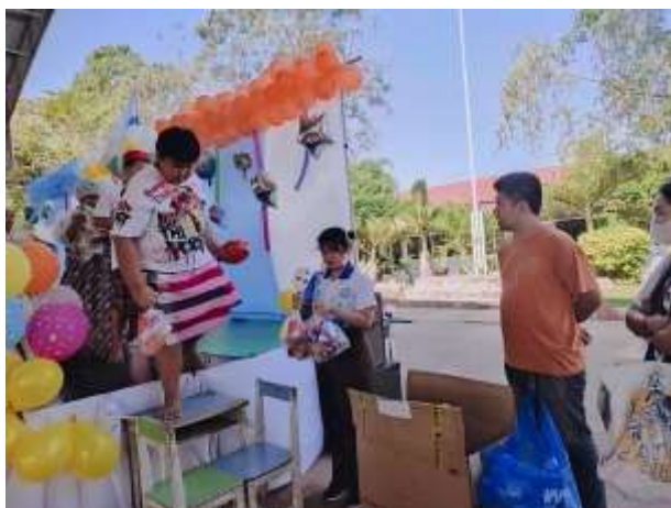
ภาพที่ 2.15 กิจกรรมวันเด็กแห่งชาติ