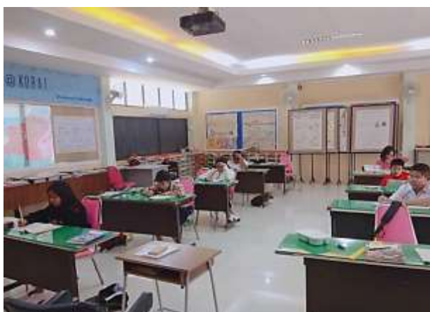
ภาพที่ 2.12 คุมการทดสอบเพื่อเตรียมความพร้อมในการสอบ O-net