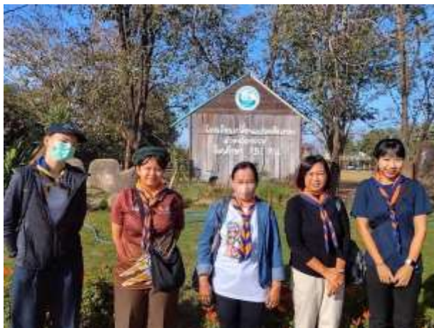
ภาพที่ 2.14 เข้าค่ายลูกเสือ