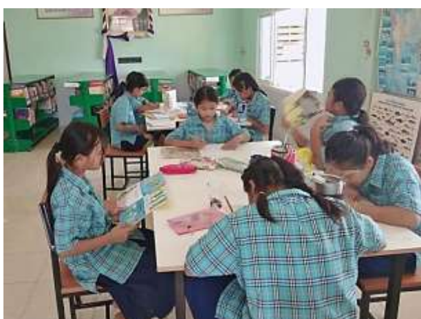
ภาพที่ 2.10 กิจกรรมอ่านแล้ววาดได้