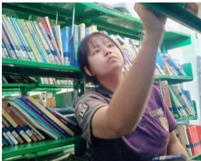
ภาพที่ 2.2 จัดหนังสือเข้าชั้นวางหนังสือ