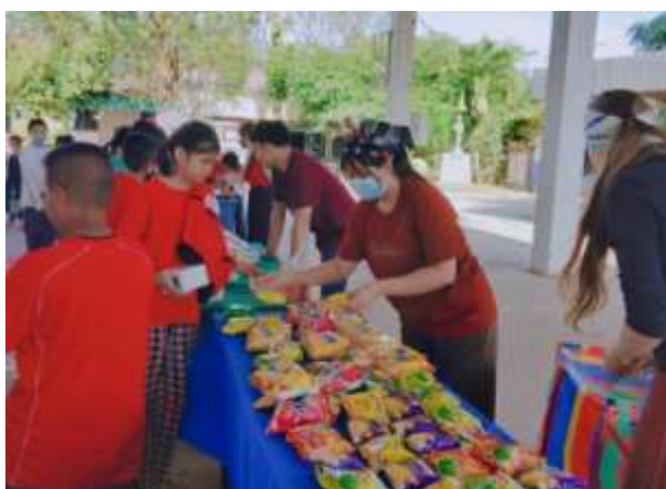
ภาพที่ 2.16 กิจกรรมวันคริสต์มาสและวันขึ้นปีใหม่