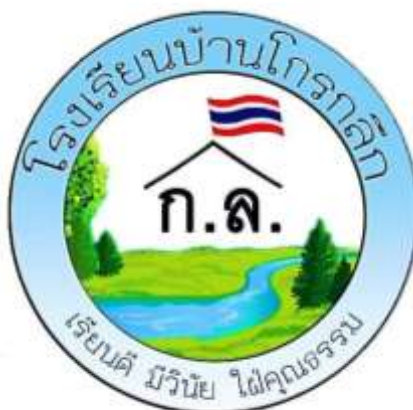
ภาพที่ 1.1 ตราสัญลักษณ์โรงเรียนบ้านโกรกกลีกลง

โรงเรียนบ้านโกรกกลีกลง ตั้งอยู่ที่ 54 บ้านโกรกกลีกลง ตำบลตะเคียน อำเภอด่านขุนทด จังหวัดนครราชสีมา รหัสไปรษณีย์ 30210 สังกัดสำนักงานคณะกรรมการการศึกษาขั้นพื้นฐาน ประเภทโรงเรียนรัฐบาล เขตการศึกษา สำนักงานเขตพื้นที่การศึกษาประถมศึกษานครราชสีมา เขต 5 เบอร์โทรศัพท์ : 0813908643, Email : mgaroon@gmail.com (โรงเรียนบ้านโกรกกลีกลง, 2565)