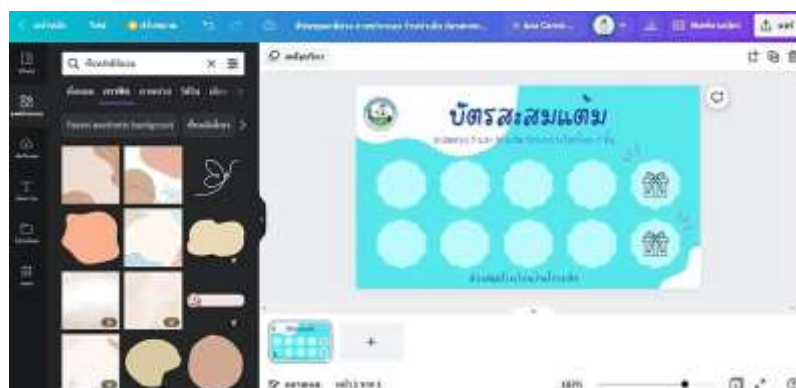
ภาพที่ 2.3 ออกแบบบัตรสะสมแต้ม โดยใช้โปรแกรม Canva