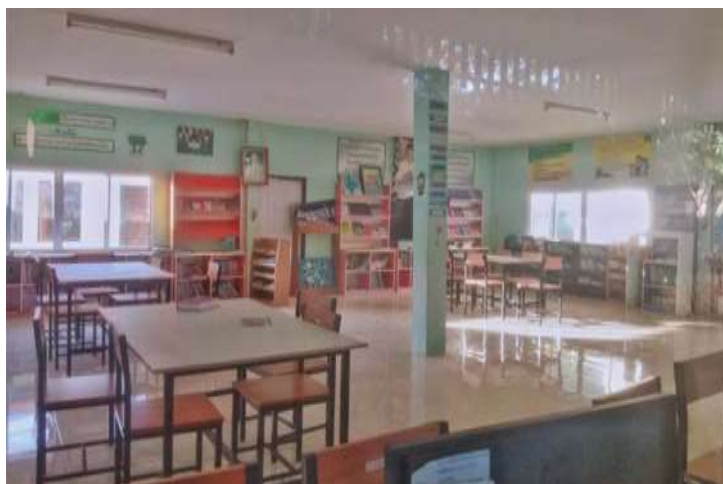
ภาพที่ 1.5 ห้องสมุดโรงเรียนบ้านโกรกกลี

การให้บริการของโรงเรียนบ้านโกรกกลี เปิดการเรียนการสอนทุกวันจันทร์ - ศุกร์ (หยุดวันนักขัตฤกษ์และวันเสาร์ - อาทิตย์) เวลาเข้าเรียน 08.30 น. - เวลาเลิกเรียน 16.00 น.