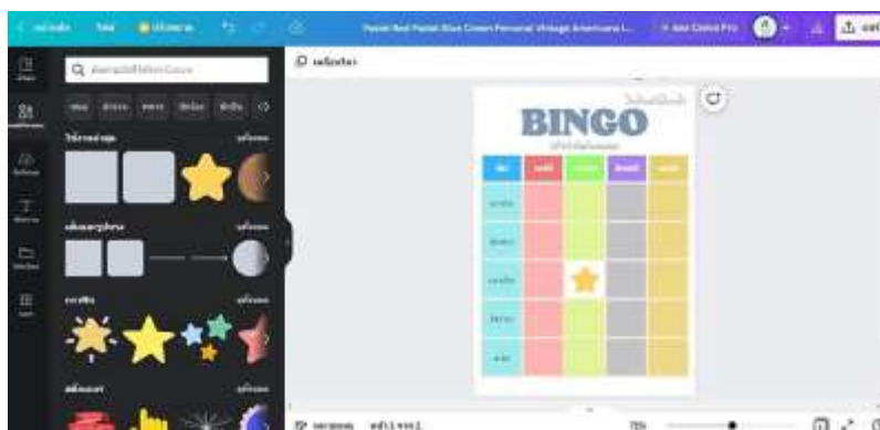
ภาพที่ 2.4 ออกแบบแผ่นเกมบิงโกคำศัพท์ โดยใช้โปรแกรม Canva