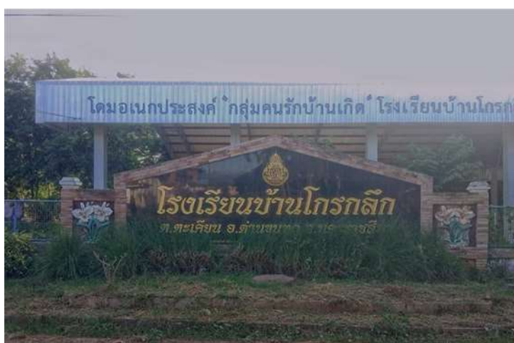
ภาพที่ 1.6 ภาพถ่ายโรงเรียนบ้านโกรกกลี

ทั้งนี้การจัดการเรียนการสอนเป็นรูปแบบ Onsite บริการหลักของโรงเรียนบ้านโกรกกลี ส่วนใหญ่เน้นเรื่องการเรียนรู้เป็นหลัก โรงเรียนบ้านโกรกกลีมีวิธีการจัดการเรียนรู้โดยใช้ปัญหาเป็นฐาน (Problem-based Learning : PBL) โดยปัญหานั้นเป็นเรื่องที่ใกล้ตัวและเกี่ยวข้องสัมพันธ์กับผู้เรียน อาจเป็นเรื่องที่ผู้เรียนสนใจ ซึ่งสามารถนำมาสร้างกระบวนการเรียนรู้ได้ การเรียนรู้ด้วย PBL มุ่งสร้างประสบการณ์ตรง จึงเน้นให้ผู้เรียนลงมือปฏิบัติ ฝึกทักษะการคิดวิเคราะห์ เผชิญ