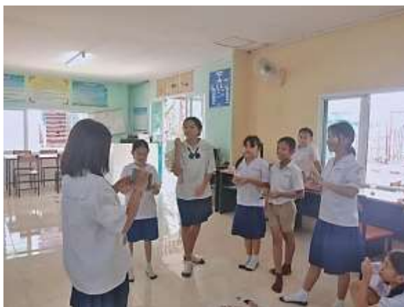
ภาพที่ 2.7 กิจกรรมไปคำทายคำ