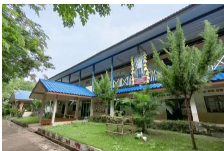
ภาพที่ 1.4 อาคารเรียนระดับชั้นประถมศึกษา