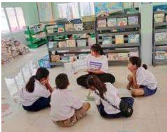
ภาพที่ 2.11 กิจกรรมเล่นิทาน

2.3 ผู้ช่วยตามหน้าที่อื่น ๆ ที่ได้รับมอบหมาย