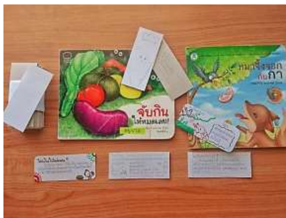
ภาพที่ 3.4 ออกแบบตัวอย่างกิจกรรมที่คั่นหนังสือสื่อความรู้