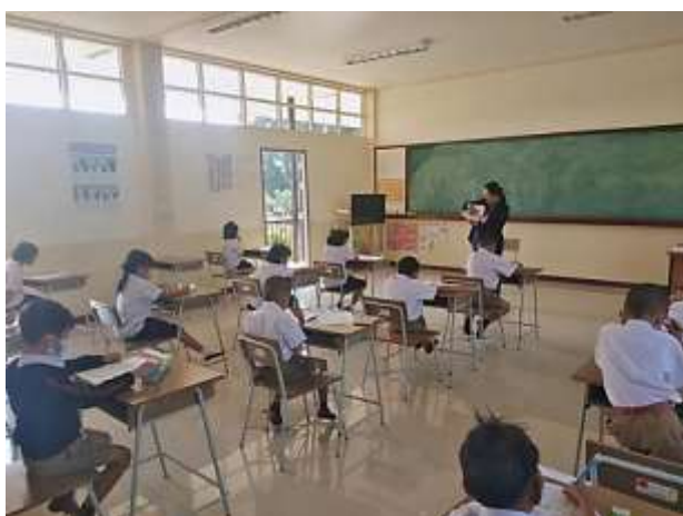
ภาพที่ 2.13 คุมสอบการประเมินความสามารถด้านการอ่านของผู้เรียน ชั้นประถมศึกษาปีที่ 1