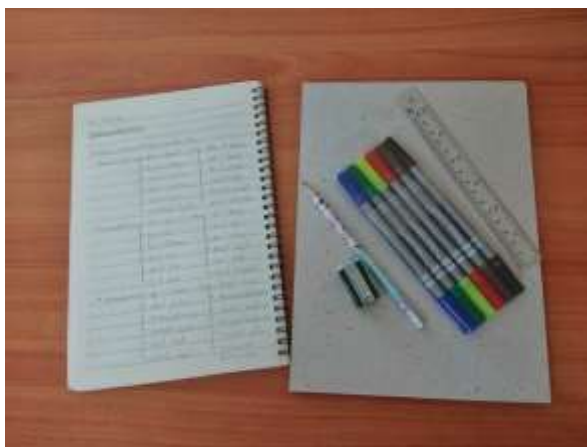
ภาพที่ 2.5 ออกแบบบัตรคำศัพท์