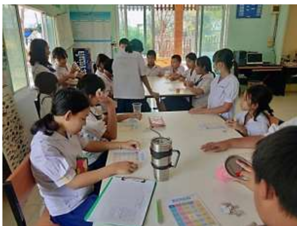
ภาพที่ 2.9 กิจกรรมบิงโกคำศัพท์