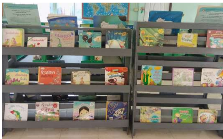
ภาพที่ 2.1 ภาพชั้นหนังสือในห้องสมุดโรงเรียนบ้านโกรกกลี

2.1.1 ให้บริการและดูแลห้องสมุดโรงเรียนบ้านโกรกกลี ให้บริการตอบคำถาม และให้คำแนะนำ รวมทั้งจัดกิจกรรมส่งเสริมการอ่าน