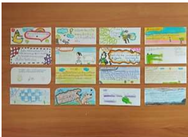
ภาพที่ 2.8 ผลงานจากกิจกรรมที่คั่นหนังสือสื่อความรู้