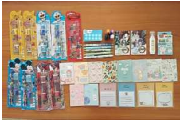
ภาพที่ 3.2 บัตรสะสมแต้มและของรางวัล