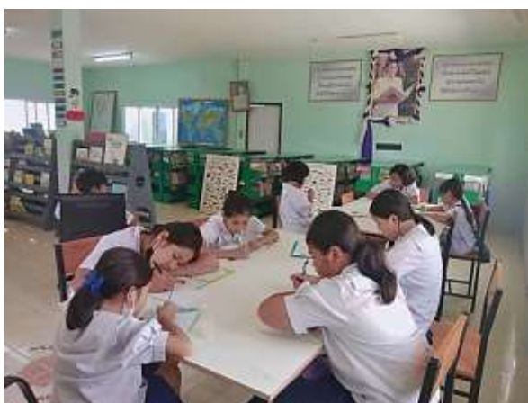
ภาพที่ 2.6 กิจกรรมอ่านดีมีรางวัล