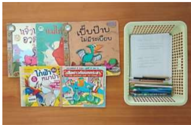
ภาพที่ 3.6 อุปกรณ์สำหรับกิจกรรมเล่านิทาน