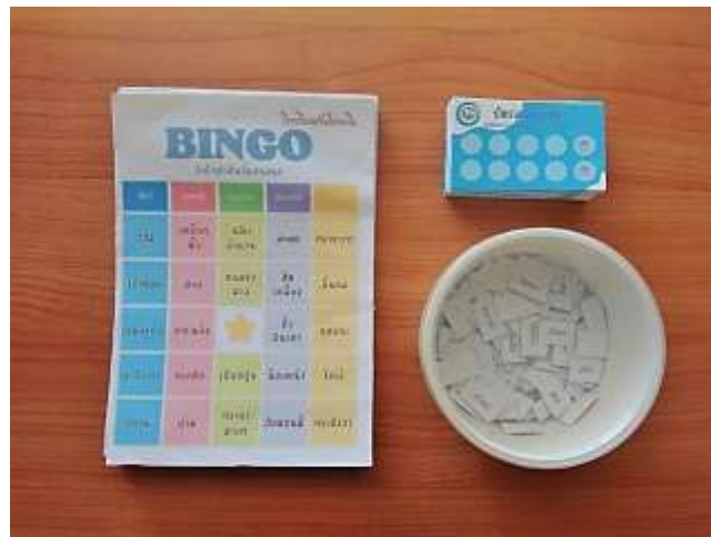
ภาพที่ 3.5 อุปกรณ์สำหรับกิจกรรมบิงโกคำศัพท์