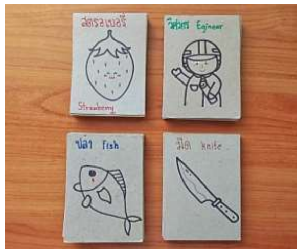
ภาพที่ 3.3 อุปกรณ์สำหรับกิจกรรมใช้ทายคำ