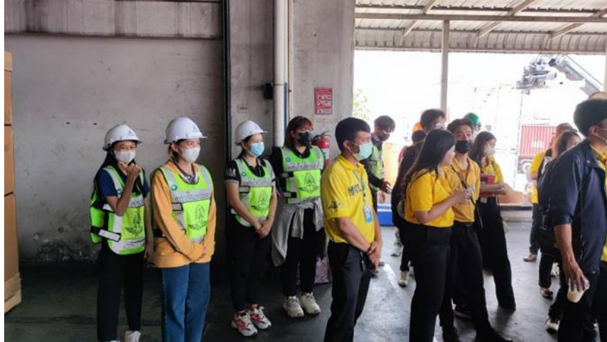
ภาพที่ ก.7 รับคณะดูงานจากการทำเรือแห่งประเทศไทย