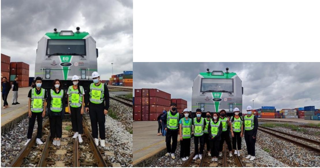
ภาพที่ ก.3 ทดสอบหัวรถจักร EV