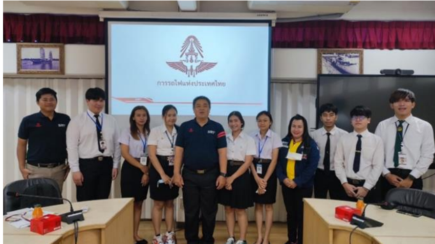
ภาพที่ ก.5 ประชุมผู้ประกอบการ