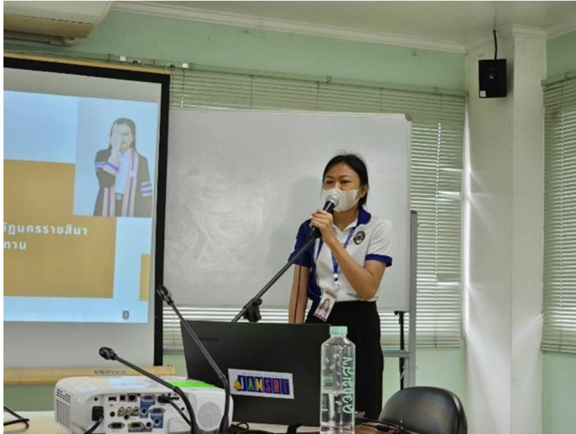
ภาพที่ ก.6 อาจารย์นิเทศนักศึกษา