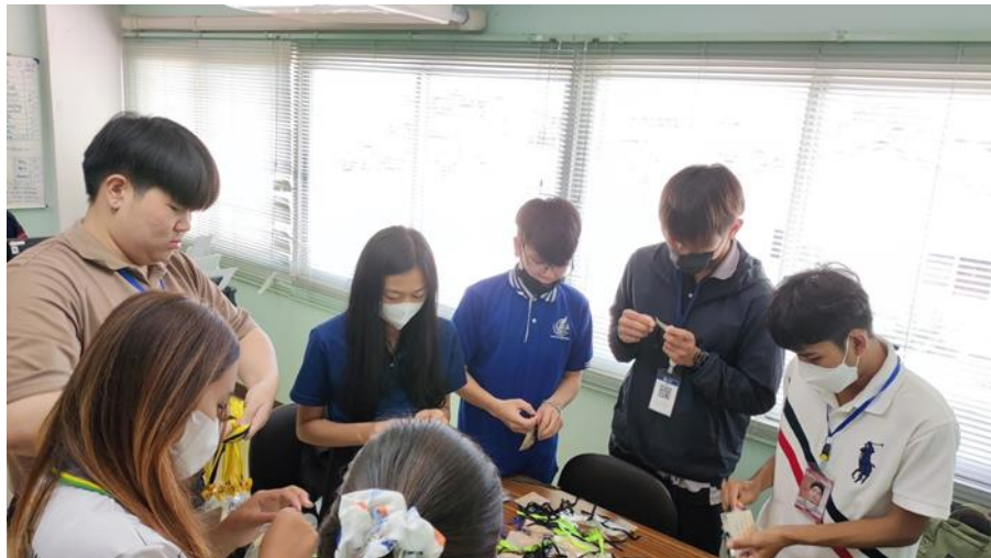
ภาพที่ ก.8 ทำกิจกรรมต่าง ๆ