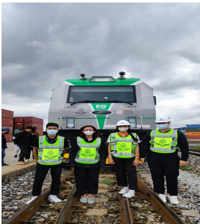
ภาพที่ ก.10 ทดสอบหัวรถจักร EV