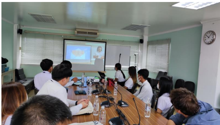
ภาพที่ ก.1 การแนะนำตัวการเริ่มปฏิบัติงานจริง