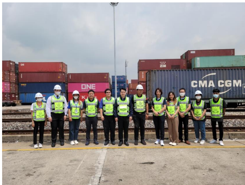
ภาพที่ ก.5 ต้อนรับคณะศึกษาดูงานและพาเยี่ยมชมลานสินค้าของไอซีทีลาดกระบัง