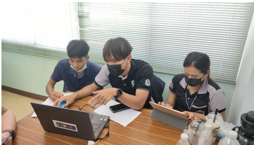
ภาพที่ ก.7 อบรมการทำ App Sheet