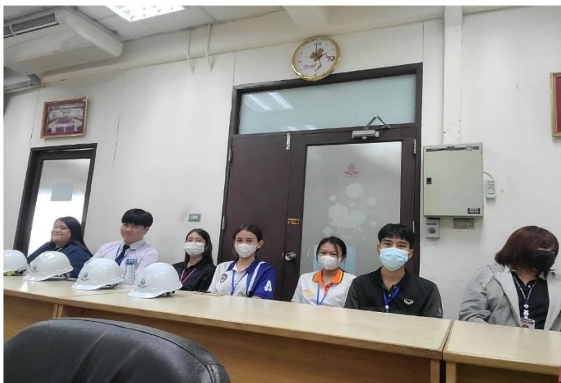
ภาพที่ ก.3 เข้าร่วมฟังการประชุมผู้ประกอบการ