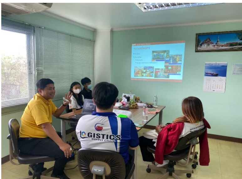
ภาพที่ ก.2 อบรมเกี่ยวกับไอซีอีลาดกระบัง