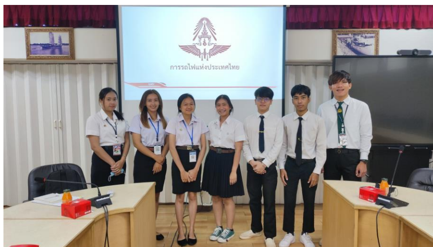
ภาพที่ ก.8 จัดห้องประชุมผู้ประกอบการ