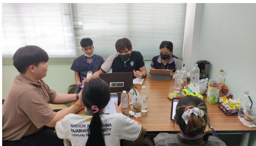
ภาพที่ ก.6 อบรมการทำ App Sheet