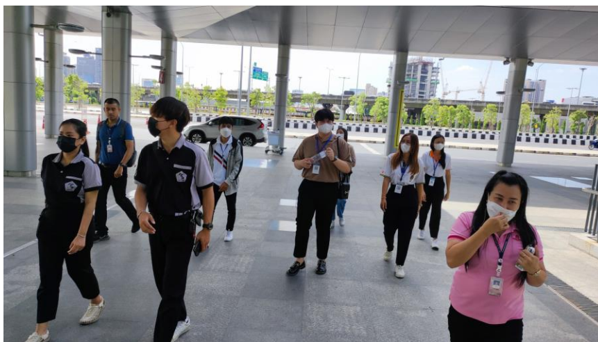
ภาพที่ ก.9 ดูงานที่สถานีกลางบางซื่อ