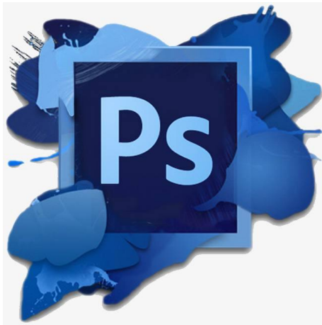
รูปภาพที่ 2.3.2.1 Icon แสดงสัญลักษณ์ของโปรแกรม Adobe Photoshop