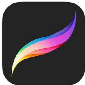
รูปภาพที่2.3.2.3 ภาพโลโก้ของแอป Procreate