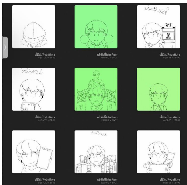
รูปภาพที่ 4.2.1 ภาพวาดสติ๊กเกอร์ไลน์ภาพที่ 1